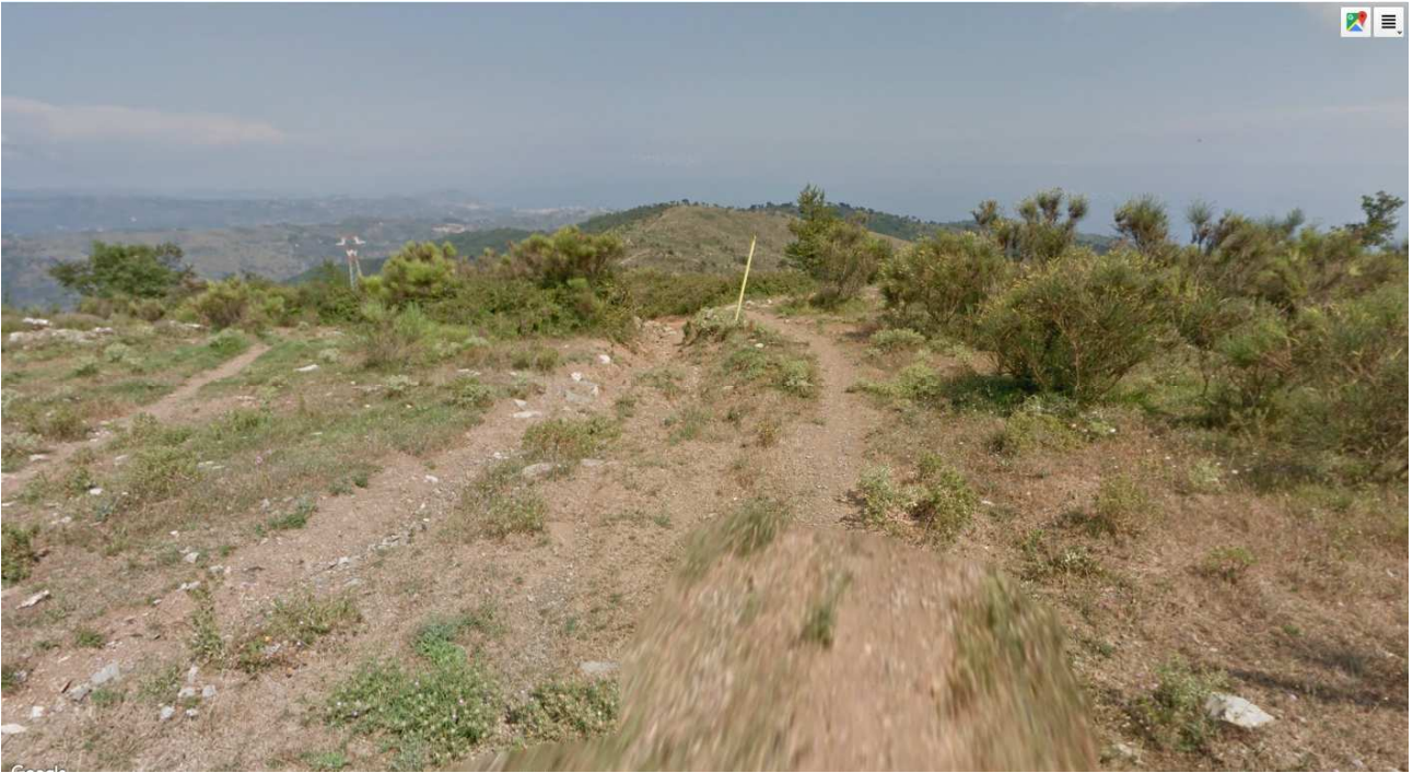
Figura 1 – TRATTO A – sul tracciato della linea di adduzione del gas