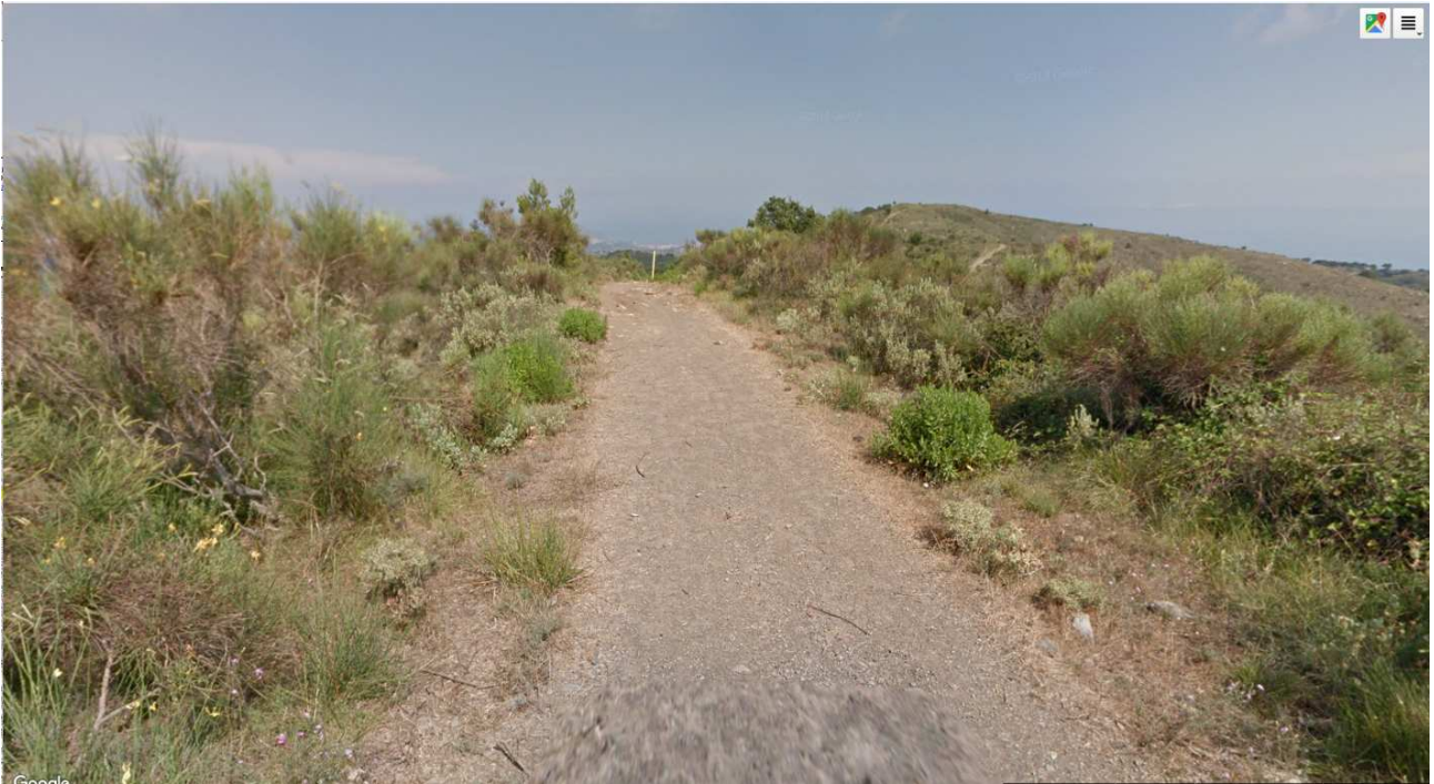
Figura 2 – TRATTO B – sul tracciato della linea di adduzione del gas – copertura a ginestra