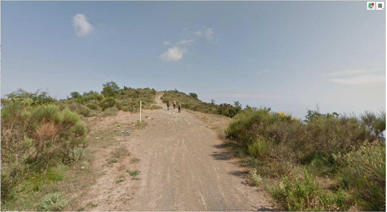
Figura 3 – TRATTO C – sul tracciato della linea di adduzione del gas – copertura a ginestra