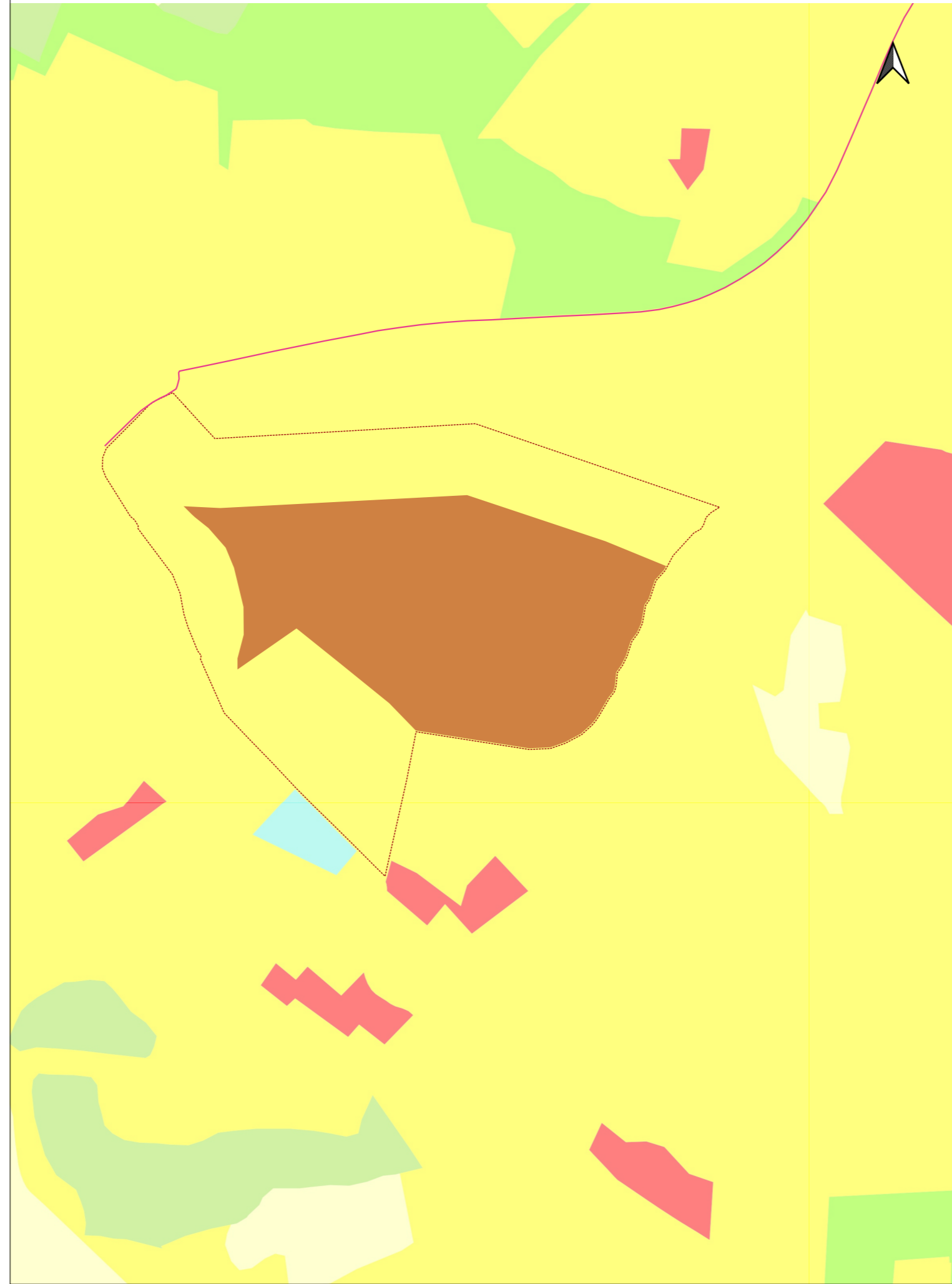
Stralcio cartografia Uso Suolo_Lotto Impianto AGV_Linea di connessione