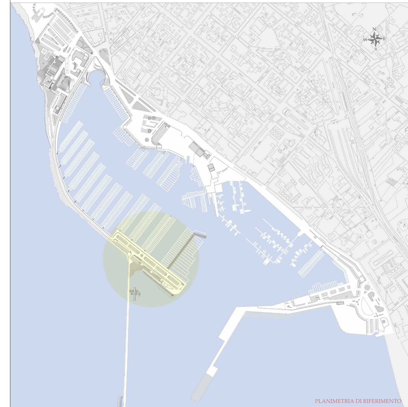
PLANIMETRIA DI RIFERIMENTO