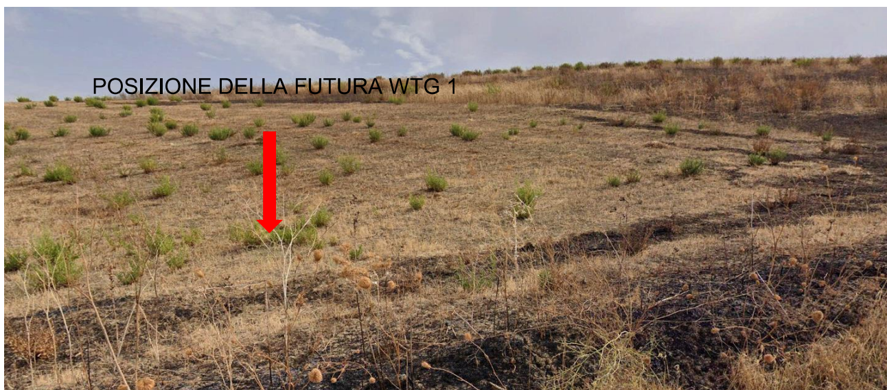
Figura 3 - Stato di fatto della futura piazzola per la turbina WTG 1