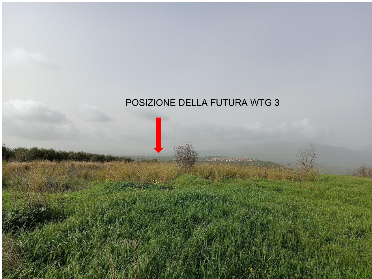
Figura 4 - Stato di fatto della futura piazzola per la turbina WTG 3