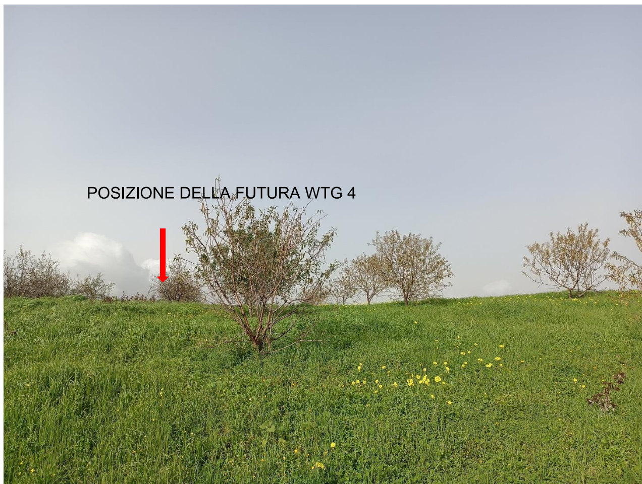
Figura 5 - Stato di fatto della futura piazzola per la turbina WTG 4