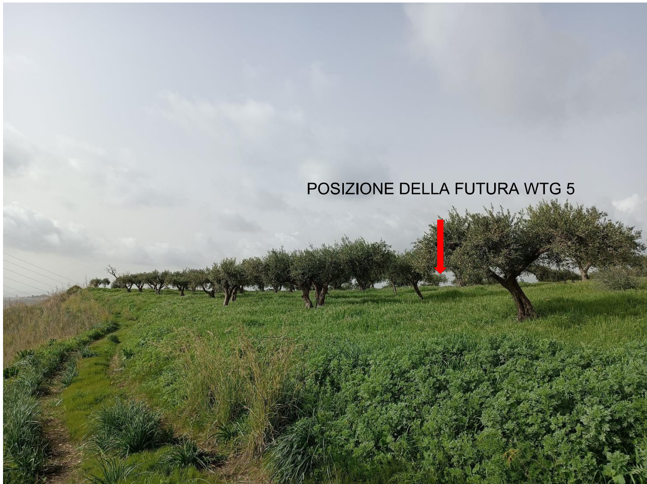
Figura 6 - Stato di fatto della futura piazzola per la turbina WTG 5