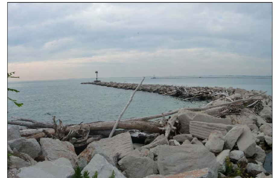
7 - Digue di accesso al porto