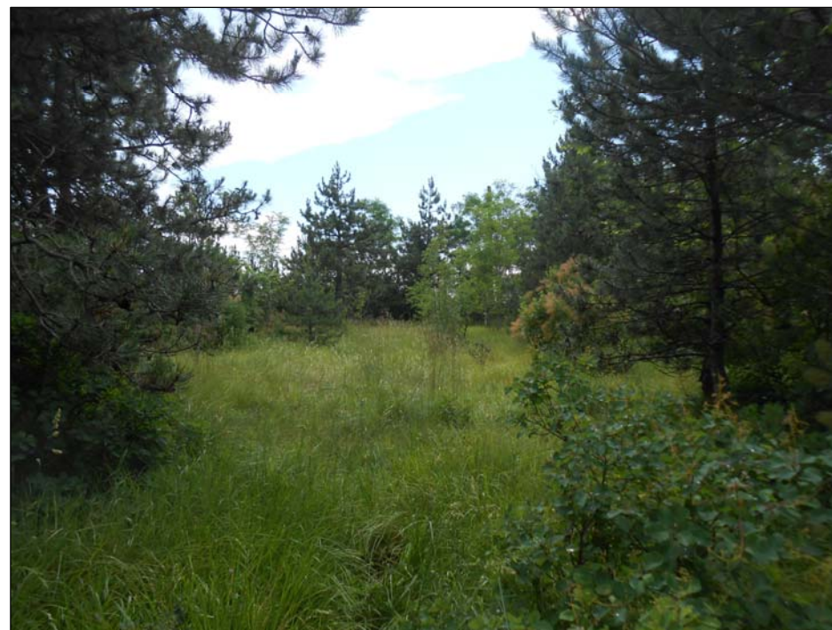
4 - Vista su area PIL2