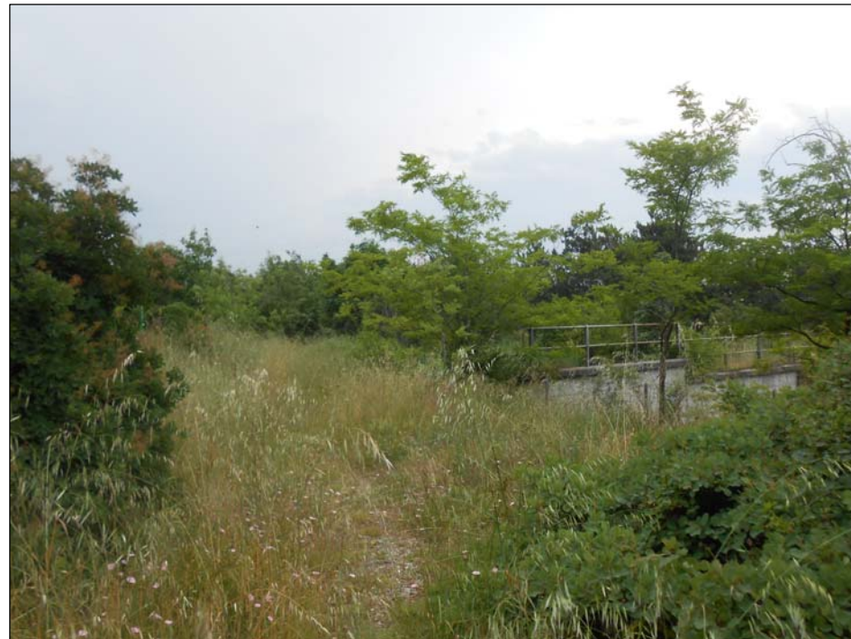
1 - Vista su area PIL1