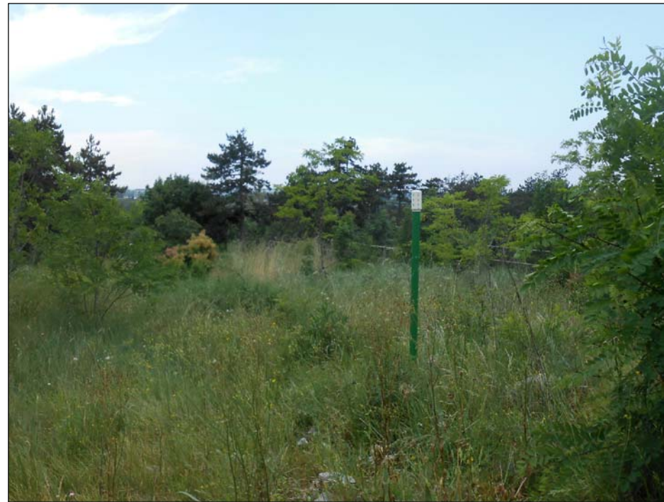
2 - Vista su area PIL1