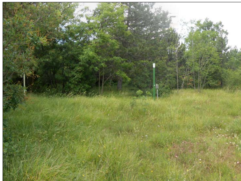
3 - Vista su area PIL2