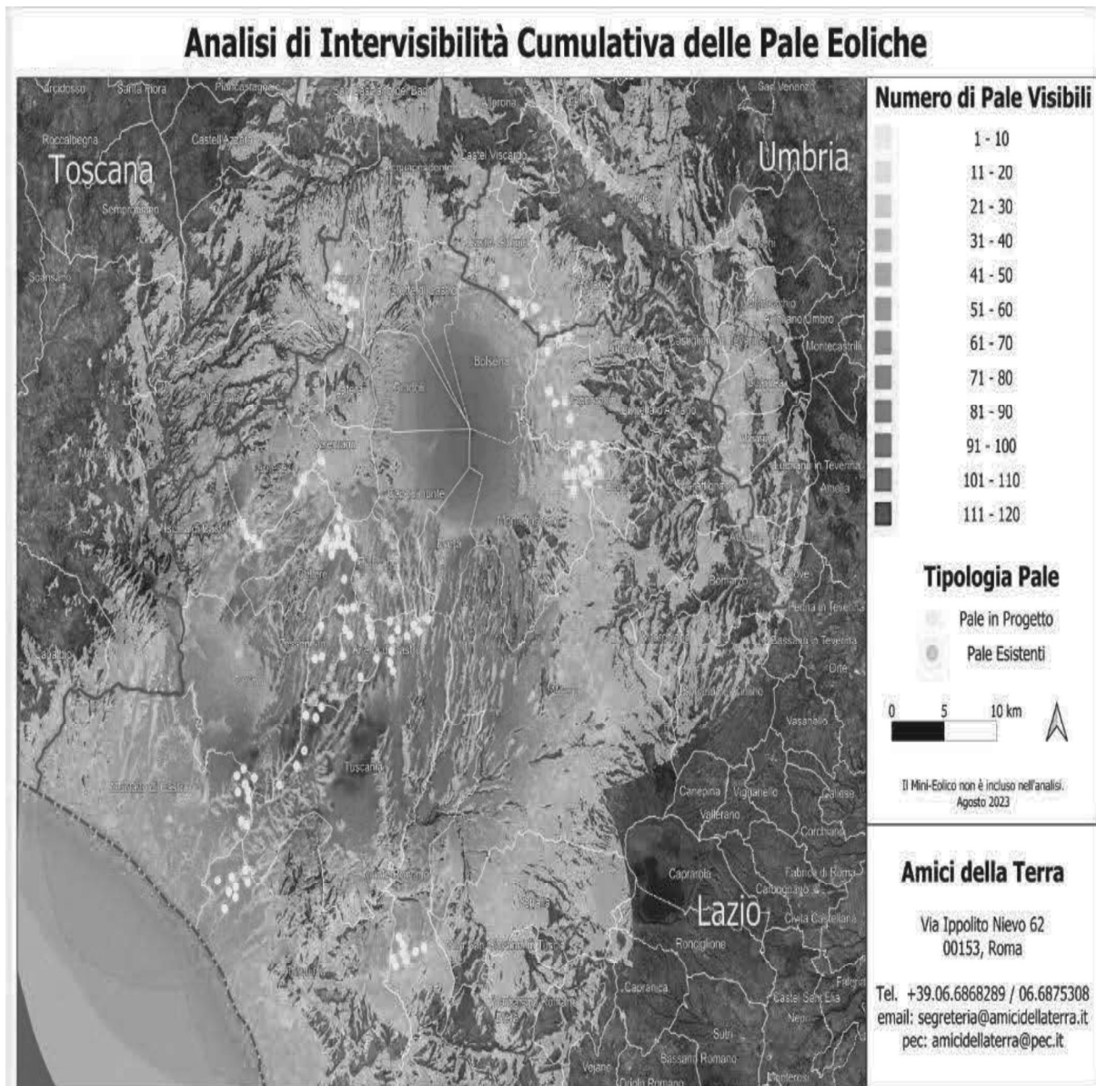
IMMAGINE n. 7 Mappa della intervisibilità degli impianti eolici elaborata dall'Associazione nazionale Amici della Terra. La mappa non è aggiornata comunque rende molo bene dell'enorme impatto visivo creato dal cumulo degli impianti.