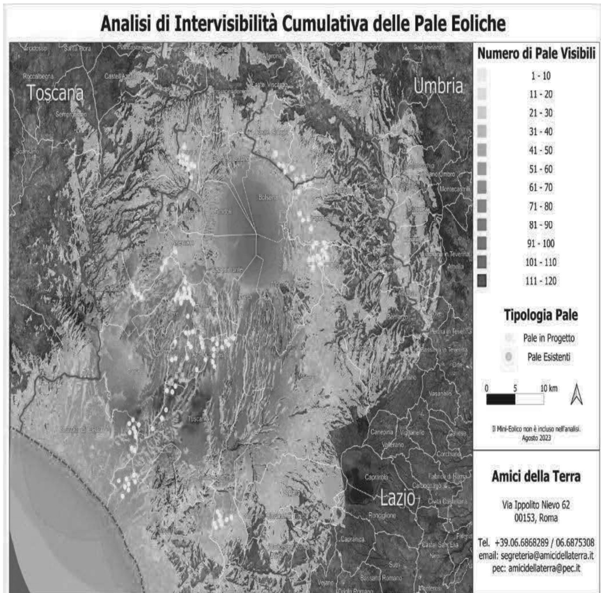
IMMAGINE n. 7 Mappa della intervisibilità degli impianti eolici elaborata dall'Associazione nazionale Amici della Terra. La mappa non è aggiornata comunque rende molto bene dell'enorme impatto visivo creato dal cumulo degli impianti.