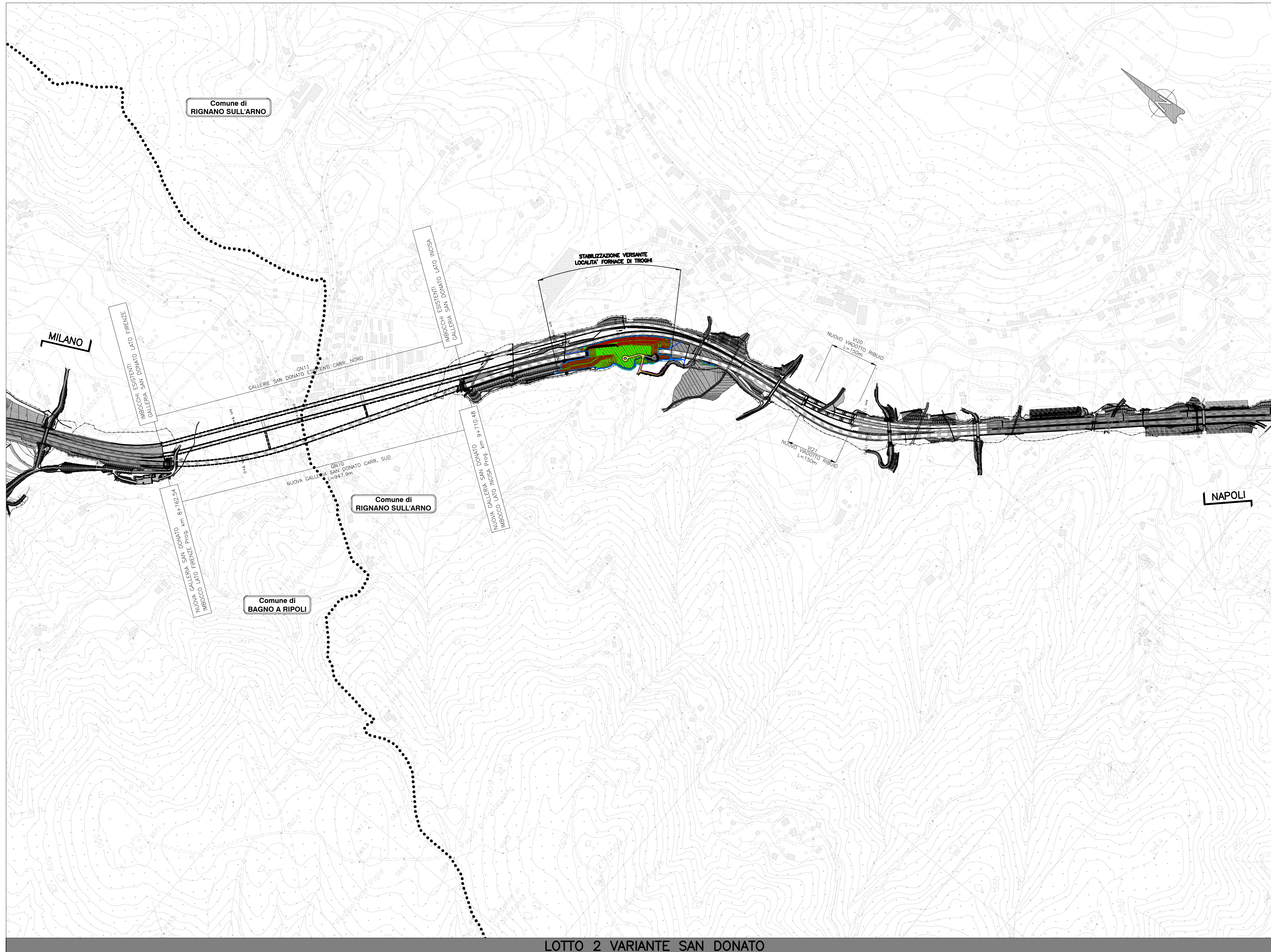
LOTTO 2 VARIANTE SAN DONATO