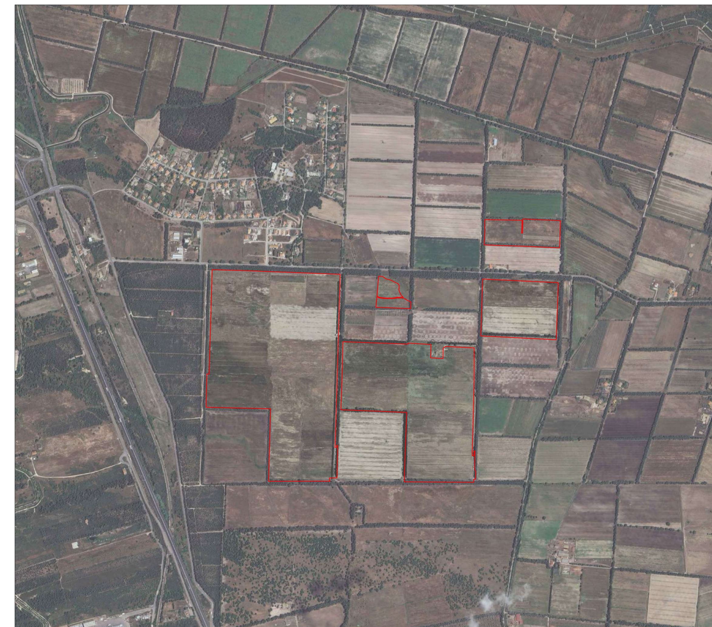
PLANIMETRIA SU ORTOFOTO - SCALA 1:10.000