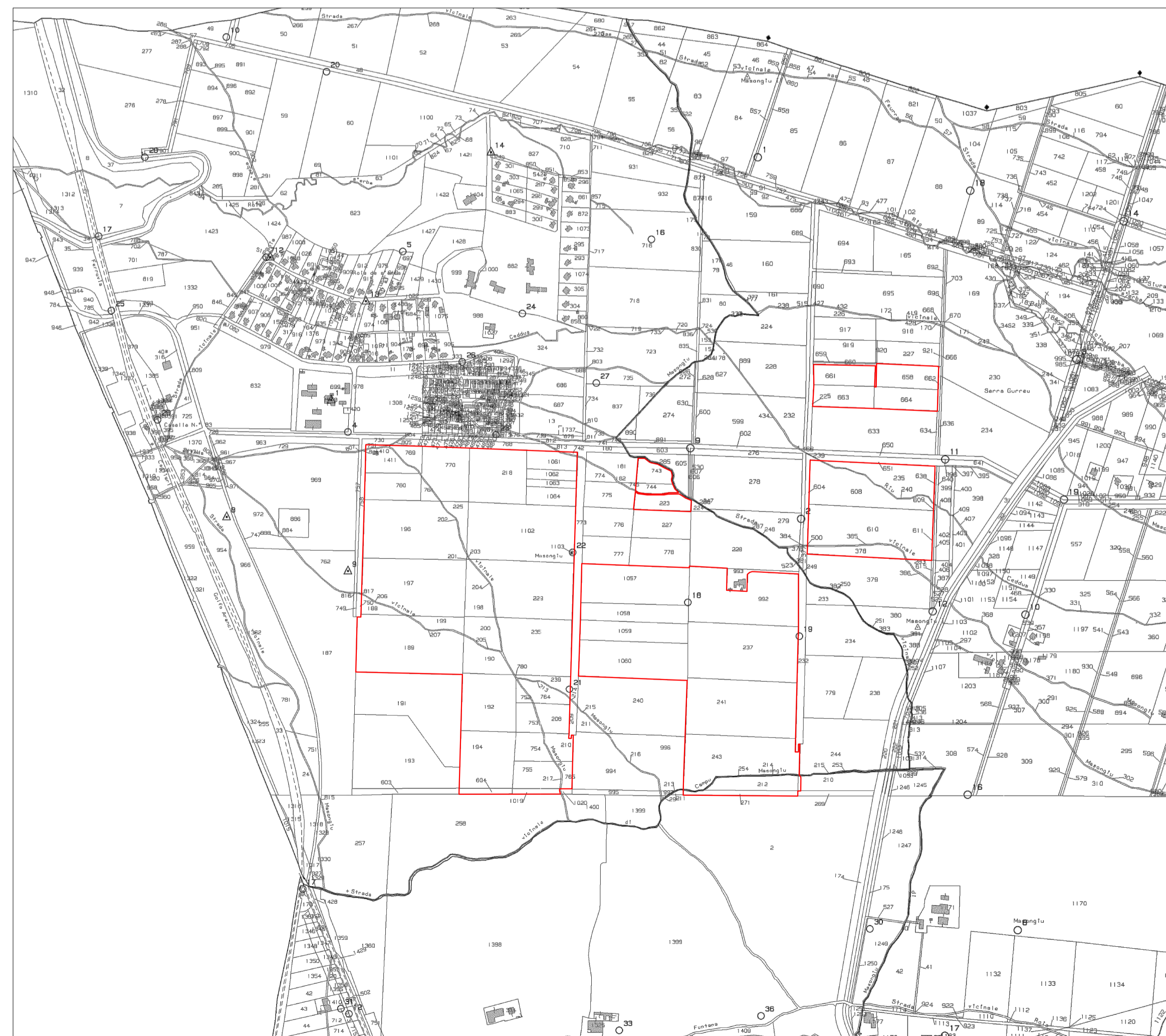
PLANIMETRIA SU BASE CATASTALE - SCALA 1:10.000

PROGETTISTA - TIMBRO E FIRMA PROGETTISTA - TIMBRO E FIRMA