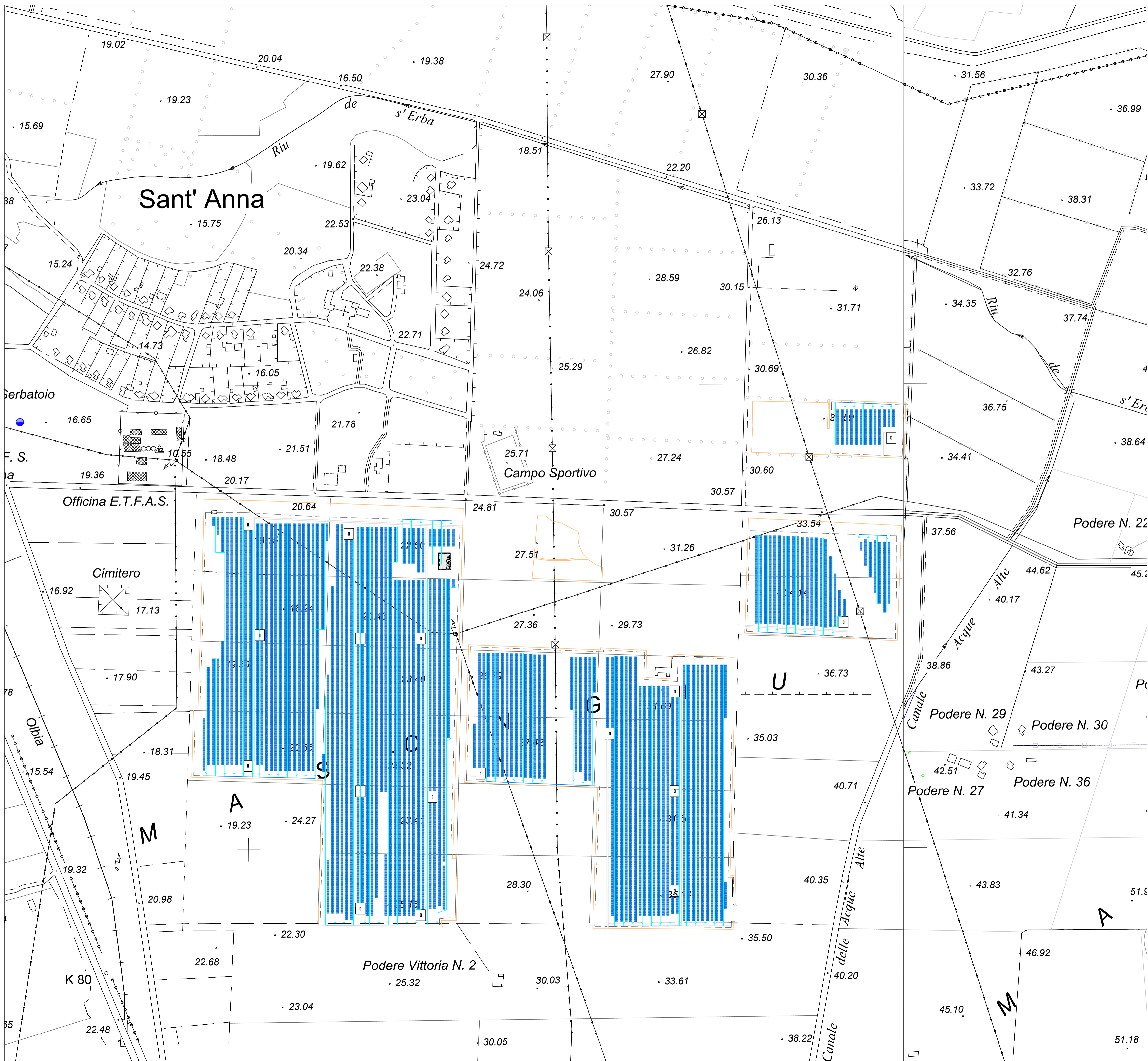
LAYOUT IMPIANTO CON SISTEMA DRENAGGIO ACQUE METEORICHE SU BASE CTR - SCALA 1:4.000

Le canale sono realizzate a sezione ridotta, non è necessario inserire grosse tubazioni, considerando la tipologia del terreno e soprattutto il limitatissimo impatto dovuto al progetto, che non andrà a modificare l'assetto esistente. All'interno dello scavo, di dimensioni 30x40 cm, verrà posato un tubo drenante PEAD microforato con riempimento massimo del 50% e con diametro ø120 mm. Verrà poi ricoperto il tutto con il terreno di risulta, per questo motivo non è necessario lo smaltimento in discarica del materiale di scavo, perché lo stesso viene utilizzato per il riporto; inoltre, non sono necessari né l'approvvigionamento né la movimentazione di pesanti e costosi materiali granulari naturali, non sempre facilmente reperibili.