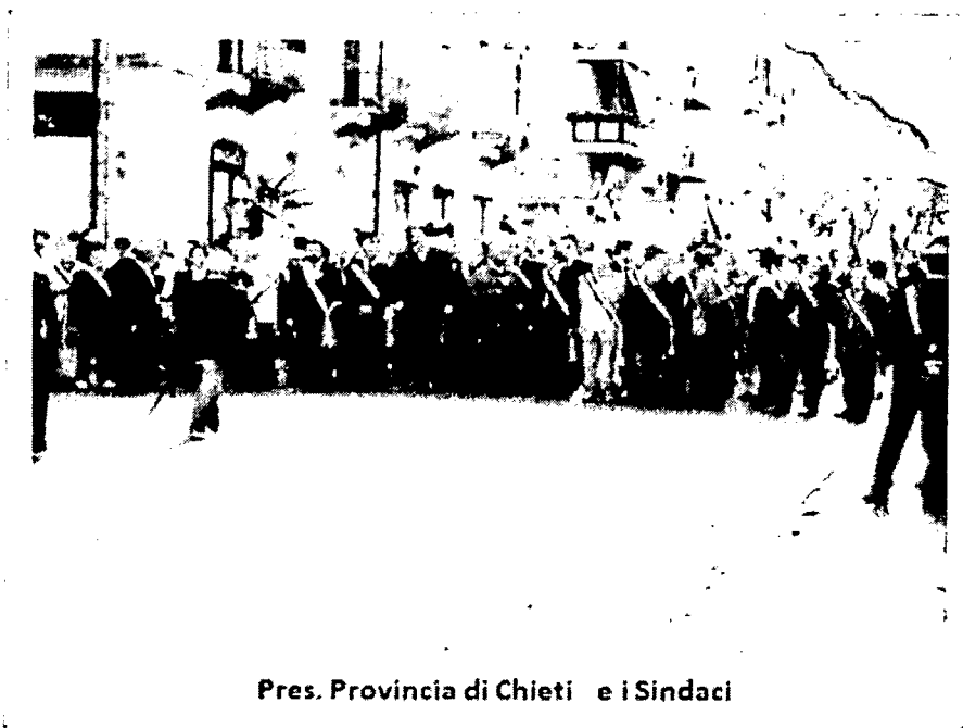
Pres. Provincia di Chieti e i Sindaci

Il procedimento di AIA presentato dalla Medoilgas ed imposto dal TAR del Lazio il 16 Aprile 2014 non aggiunge nulla di nuovo a quanto già' diffuso dalla Medoilgas. Non esistono dunque le basi per ulteriori valutazioni del progetto che possano dissiparne dubbi e i fortissimi motivi di contrarietà espressi nel corso degli anni da tutto l'Abruzzo civile nonché dalla Commissione Tecnica VIA-VAS con parere n. 541 del 07.10.2010. Fra questi la potenzialità di inquinare il mare e l'atmosfera con il rilascio e l'incenerimento di sostanze tossiche, i danni alla pesca e alle zone di ripopolamento ittico presenti all'interno della concessione, l'uso di fanghi aggressivi e di tecniche di acidificazione e fratturazione come già dichiarato durante le fasi preliminari del 2008, il rischio sismico, di subsidenza indotta e di erosione della costa, il rischio di incidenti, la distruzione di tutti i progetti di turismo sostenibile lungo il Parco Nazionale della Costa dei Trabocchi, la scarsità del petrolio da estrarre, i dati poco trasparenti diffusi dalla Medoilgas e il suo esiguo capitale sociale che non le consentiranno di far fronte a possibili incidenti. Tutta la società civile d'Abruzzo, dalla Chiesa ai commercianti, dagli operatori turistici a quelli agricoli, si è espressa contro Ombrina, incluse le 40,000 persone scese in piazza il giorno 13 Aprile 2013. Il diniego di questo progetto è imposto dai più elementari principi di democrazia.