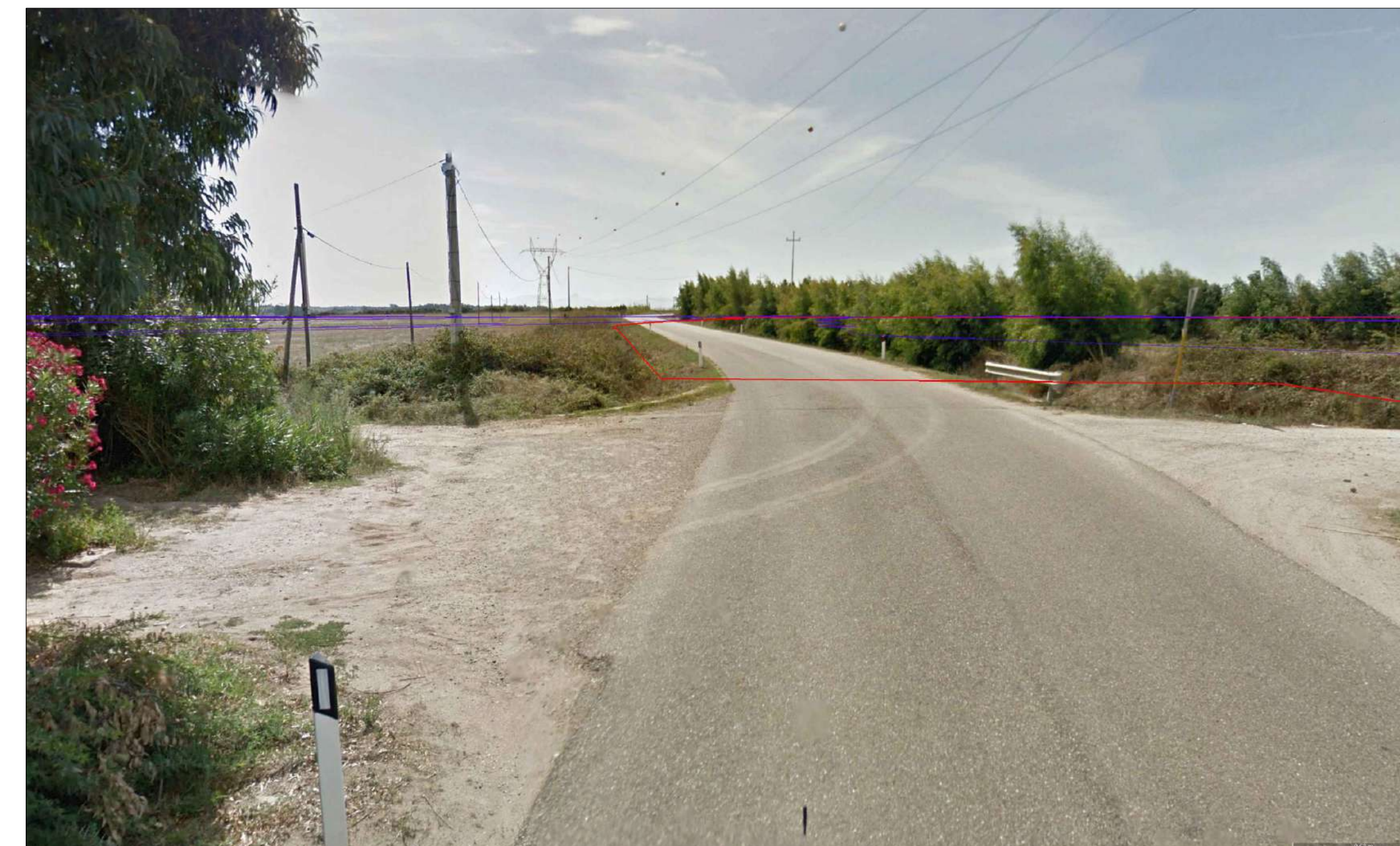
INQUADRAMENTO SU ORTOFOTO E VISTA STRADA - ATTRAVERSAMENTO STRADALE 04 CON STRADA PROVINCIALE SP 53