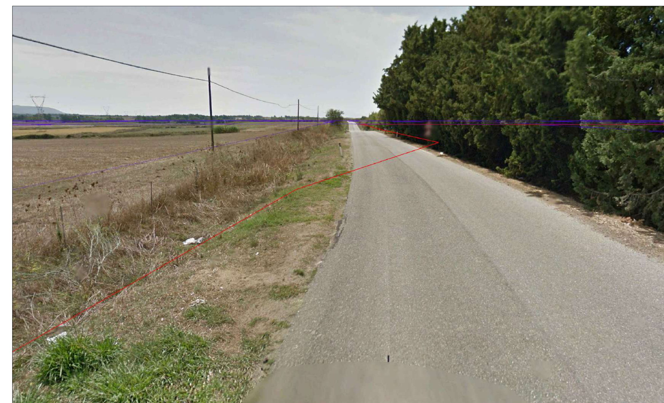
INQUADRAMENTO SU ORTOFOTO E VISTA STRADA - ATTRAVERSAMENTO STRADALE 05 CON STRADA PROVINCIALE SP 53