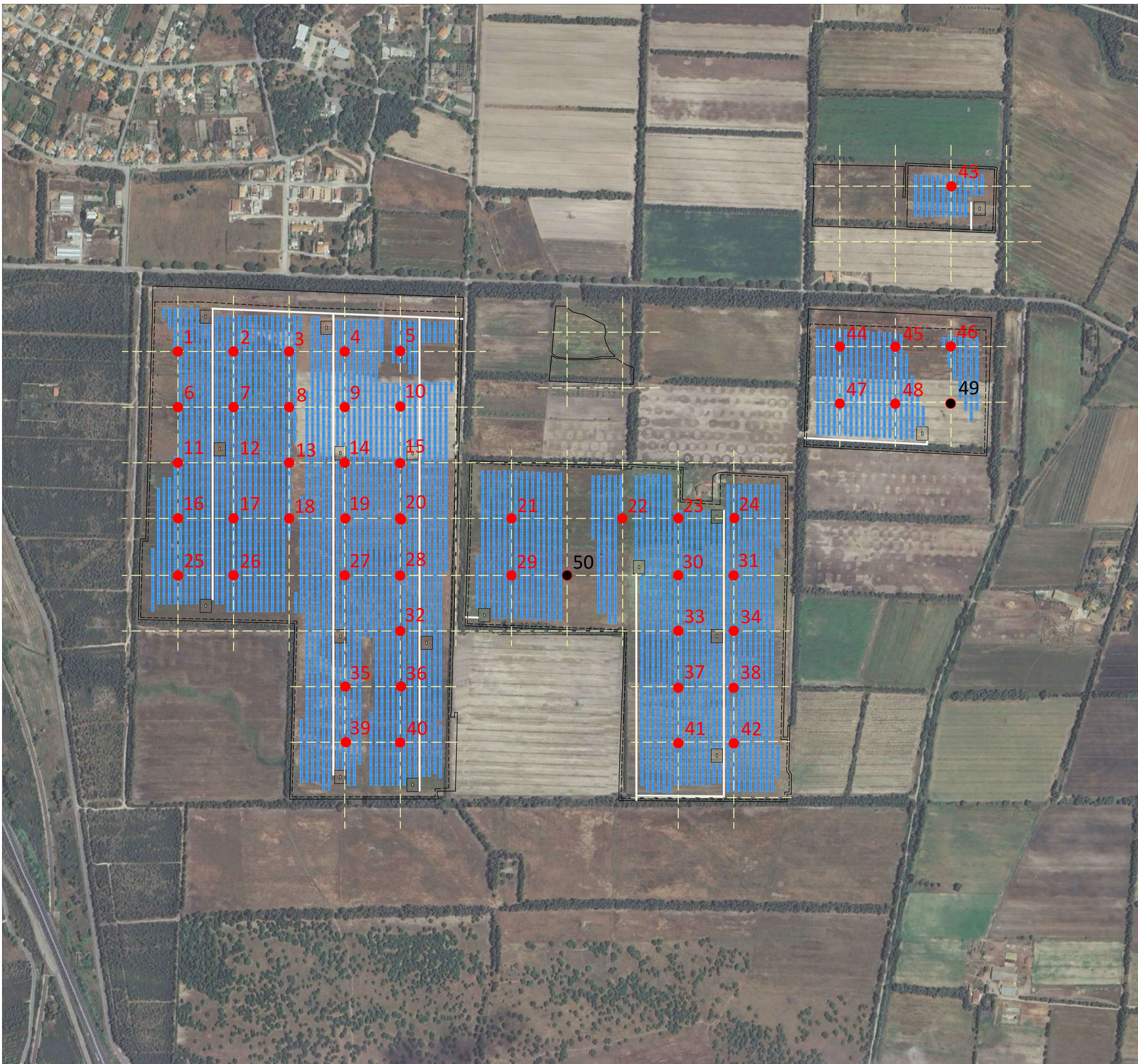
CAMPIONAMENTI AREA DI IMPIANTO

STUDIO ALCHEMIST Via Isola Pantelleria 12 - 09126 Cagliari (CA)