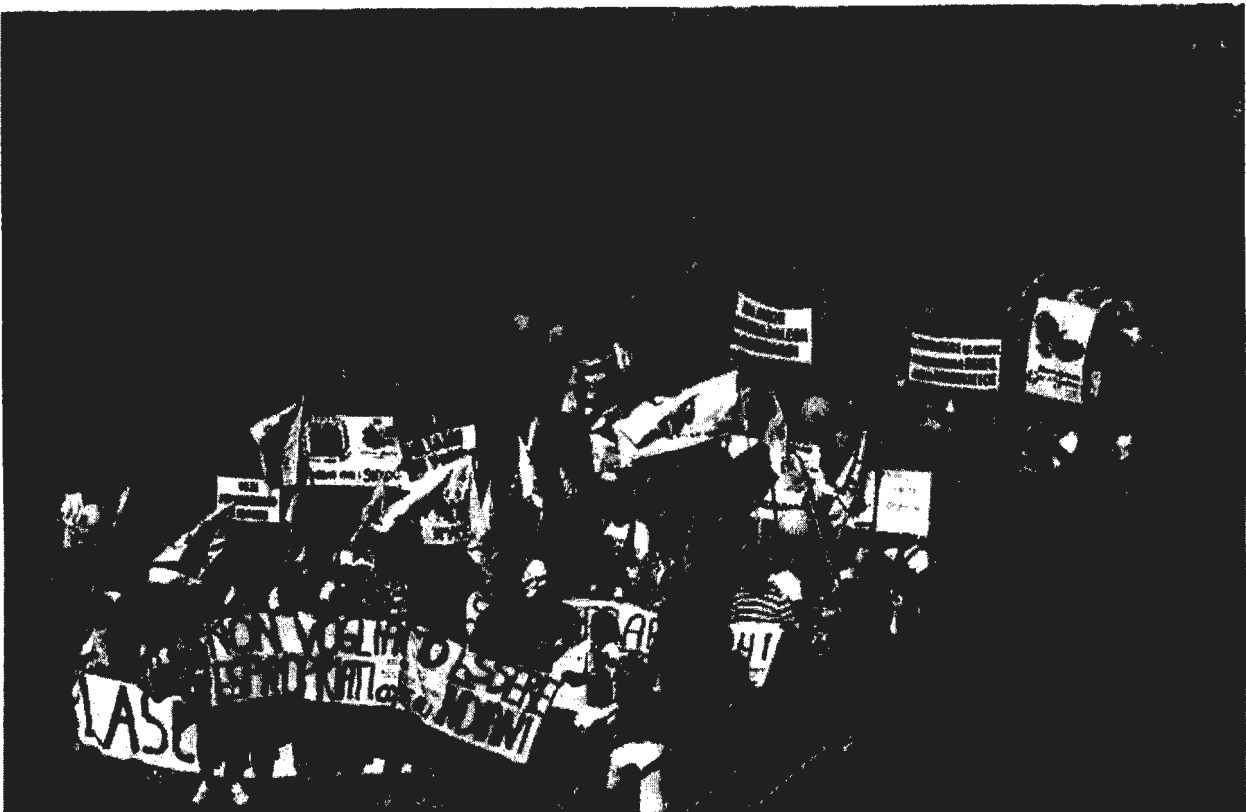
Pescara 13 aprile 2013 corteo "No Ombrina" con 40.000 persone

Il procedimento di AIA presentato dalla Medoilgas ed imposto dal TAR del Lazio il 16 Aprile 2014 non aggiunge nulla di nuovo a quanto già diffuso dalla Medoilgas. Non esistono dunque le basi per ulteriori valutazioni del progetto che possano dissiparne dubbi e i fortissimi motivi di contrarietà espressi nel corso degli anni da tutto l'Abruzzo civile nonché dalla Commissione Tecnica VIA-VAS con parere n. 541 del 07.10.2010. Fra questi la potenzialità di inquinare il mare e l'atmosfera con il rilascio e l'incenerimento di sostanze tossiche, i danni alla pesca e alle zone di ripopolamento ittico presenti all'interno della concessione, l'uso di fanghi aggressivi e di tecniche di acidificazione e fratturazione come già dichiarato durante le fasi preliminari del 2008, il rischio sismico, di subsidenza indotta e di erosione della costa, il rischio di incidenti, la distruzione di tutti i progetti di turismo sostenibile lungo il Parco Nazionale della Costa dei Trabocchi, la scarsità del petrolio da estrarre, i dati poco trasparenti diffusi dalla Medoilgas e il suo esiguo capitale sociale che non le consentiranno di far fronte a possibili incidenti. Tutta la società civile d'Abruzzo, dalla Chiesa ai commercianti, dagli operatori turistici a quelli agricoli, si è espressa contro Ombrina, incluse le 40,000 persone scese in piazza il giorno 13 Aprile 2013. Il diniego di questo progetto è imposto dai più elementari principi di democrazia.