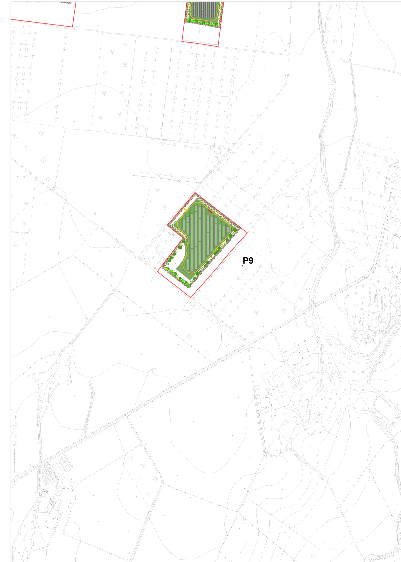
Layout generale d'impianto - Quadrante C - Piastra P9 scala 1:5.000