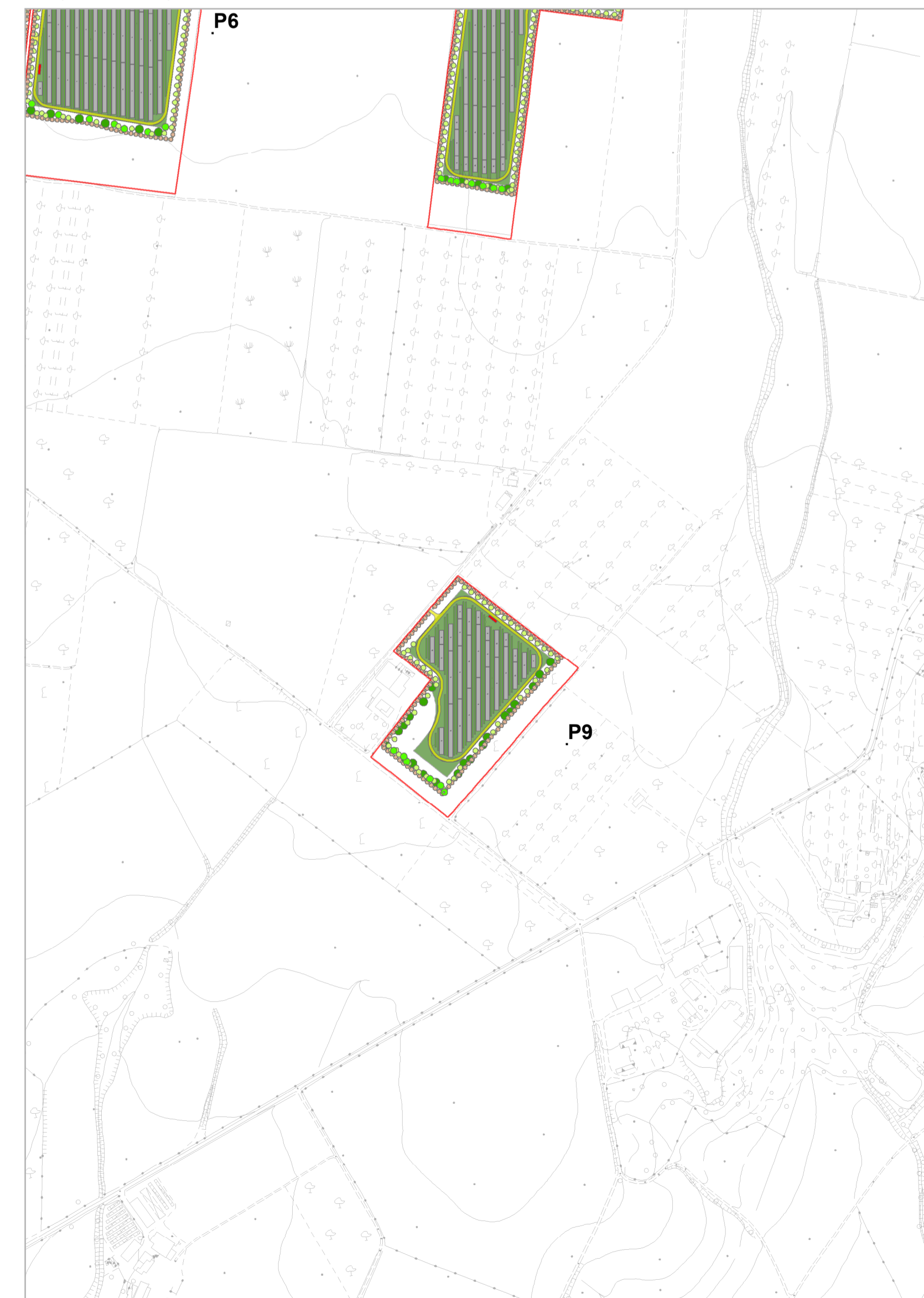
Progetto di mitigazione - Quadrante C - Piastra P9 scala 1:5.000