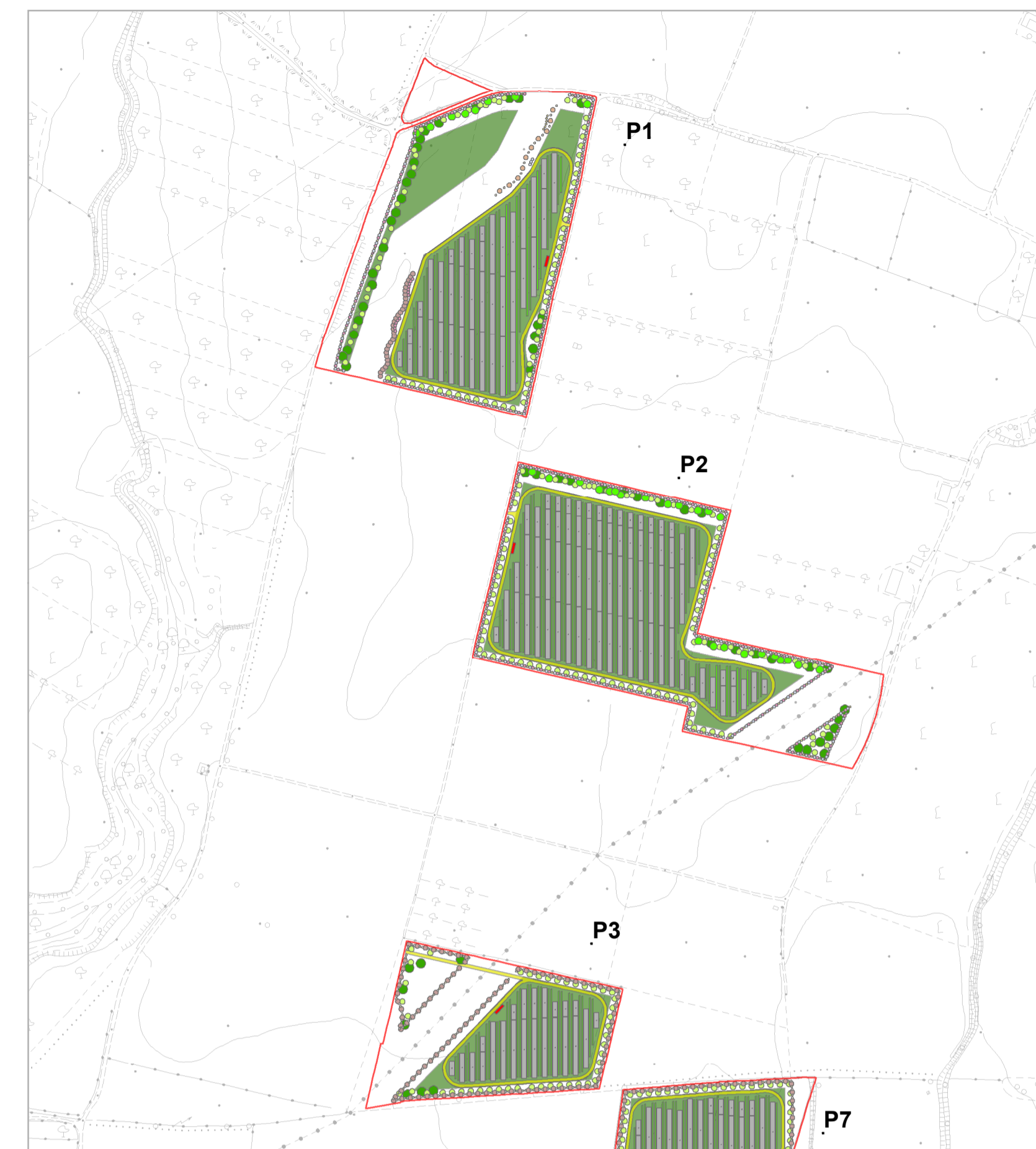
Progetto di mitigazione: Planimetria generale Quadrante A - Piastre P1 - P2 - P3 scala 1:5.000