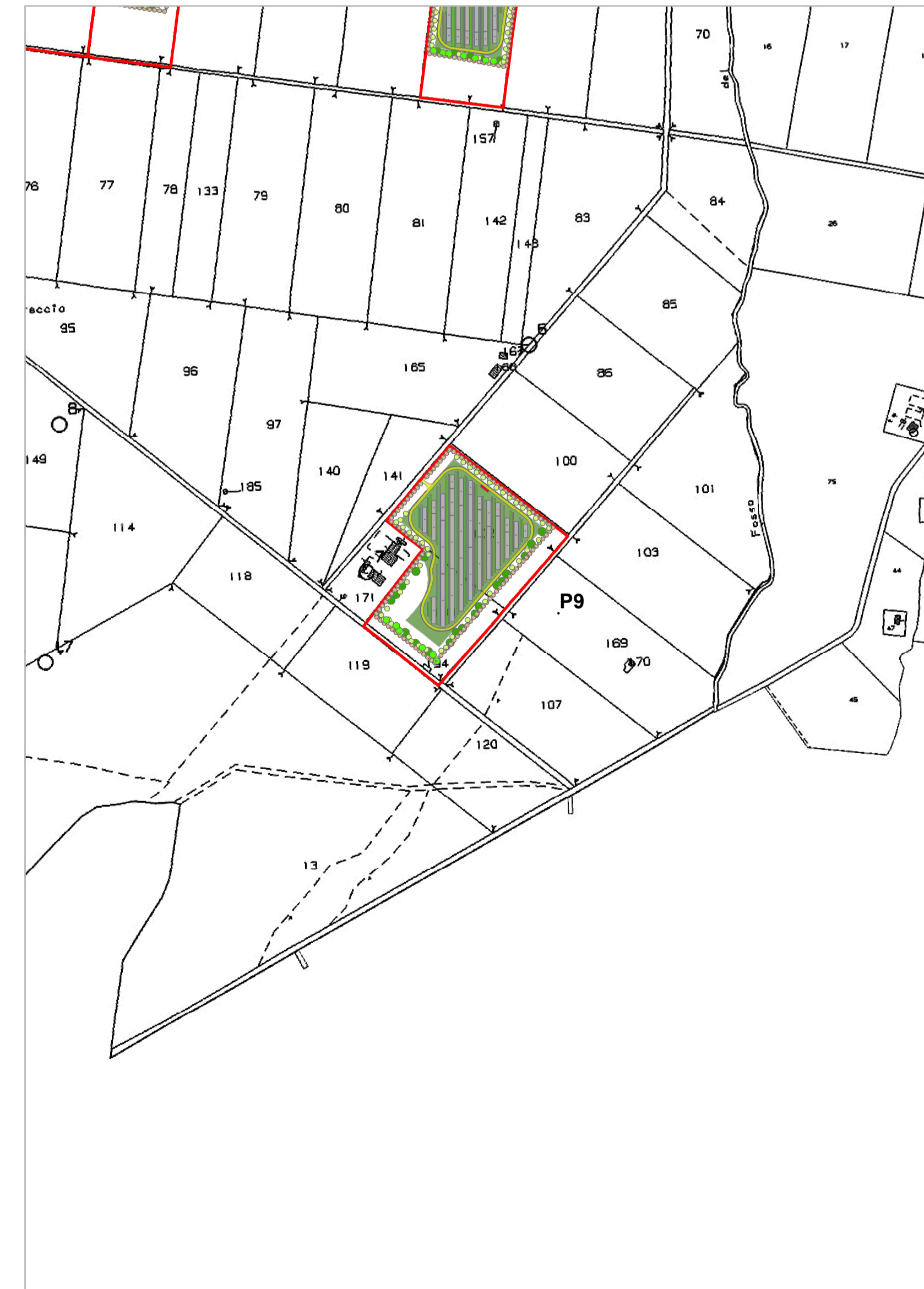
Layout su catastale - Quadrante C - Piastra P9 scala 1:5.000