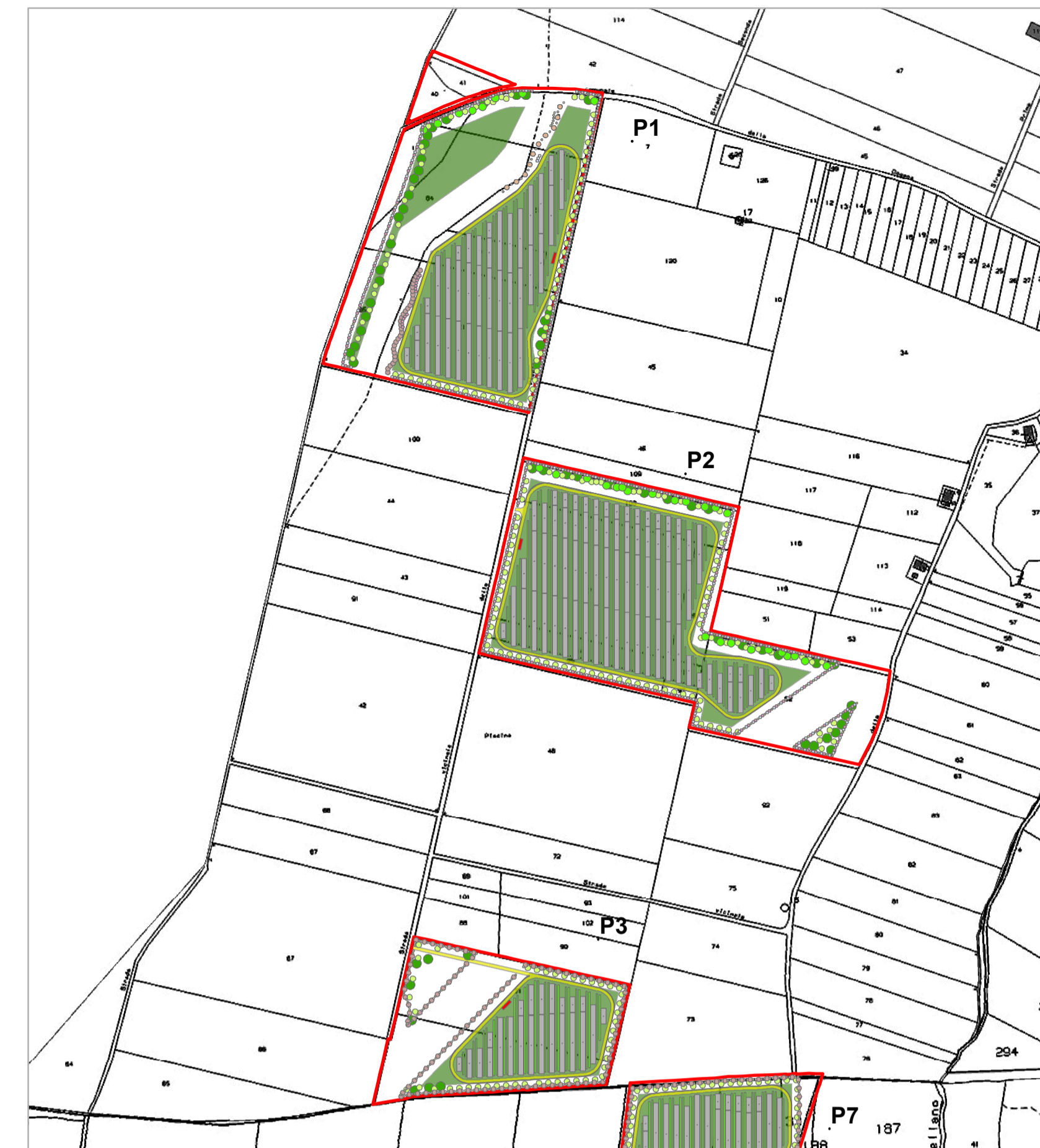
Layout su catastale Quadrante A - Piastre P1 - P2 - P3 scala 1:5.000