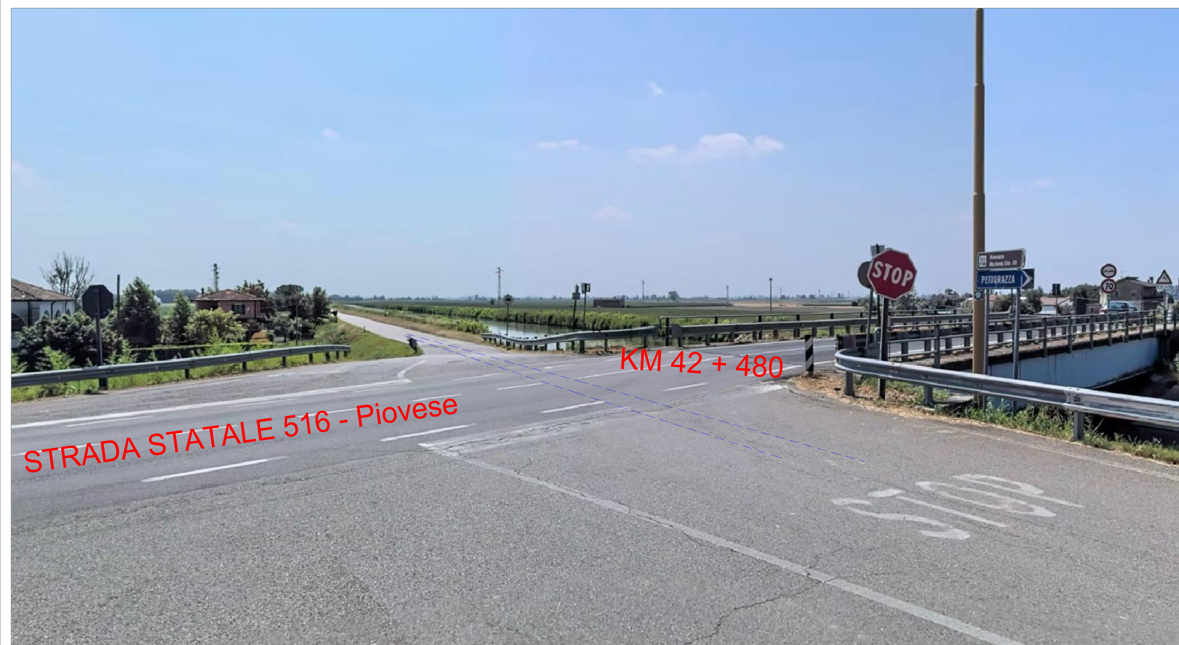
PARTICOLARE DELLO STATO ATTUALE CON INDICAZIONE DELLO SCAVO PER CAVIDOTTO INTERRATO