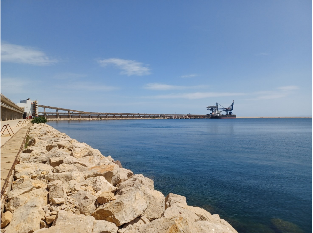
Figura 2.8: Foto No. 08 – Area di Intervento FSRU vista da Ovest-Sud-Ovest