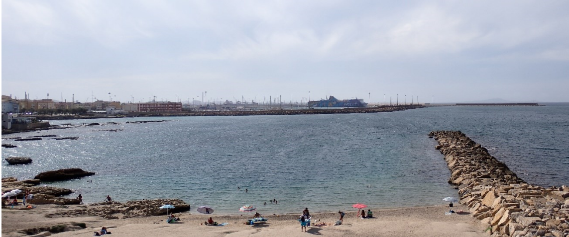
Figura 2.1: Foto No. 01 - Lungomare Balai