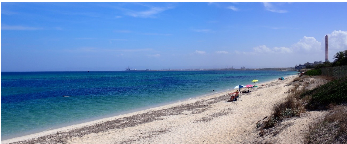
Figura 2.3: Foto No. 03 – Spiaggia di Fiumesanto