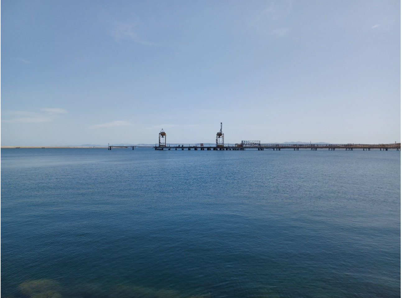
Figura 2.9: Foto No. 09 – Bacino Portuale vista da Ovest