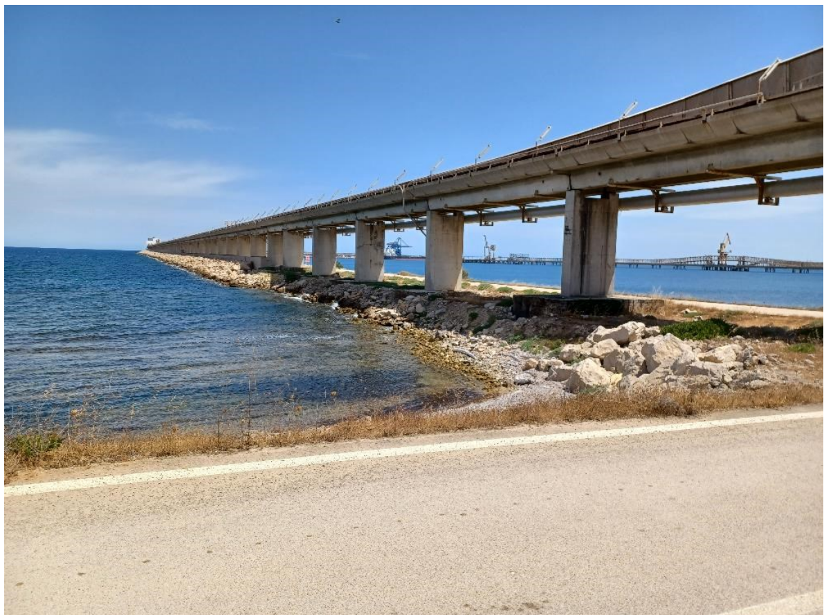
Figura 2.5: Foto No. 05 – Area di Intervento FSRU Vista da Sud-Ovest