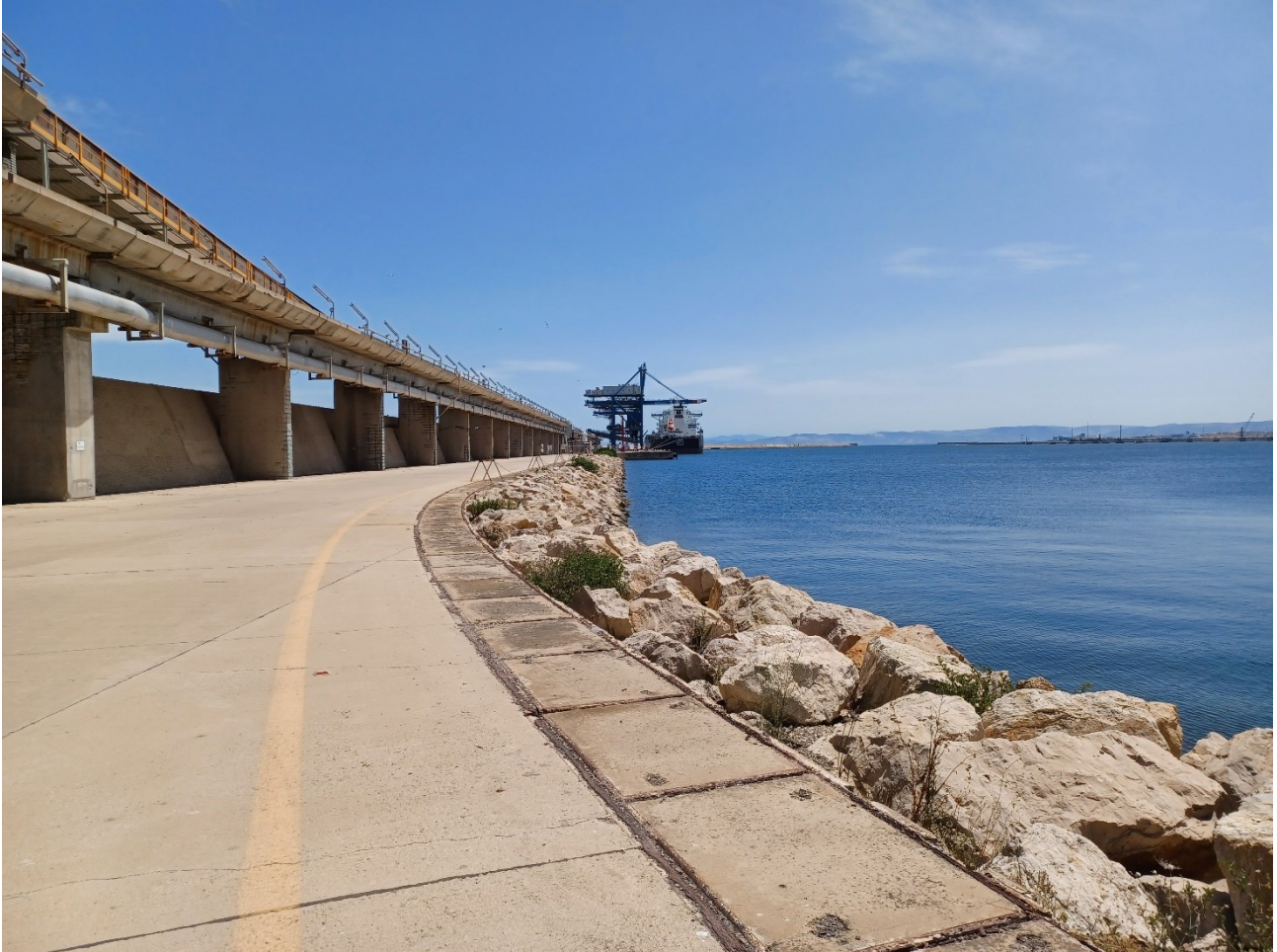
Figura 2.10: Foto No. 10 – Area di Intervento vista da Ovest