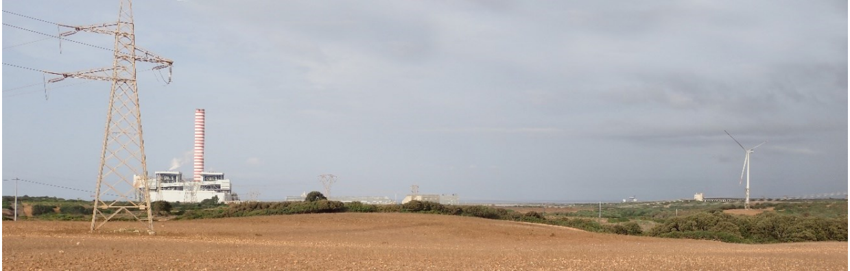
Figura 2.4: Foto No. 04 – Strada SP 4