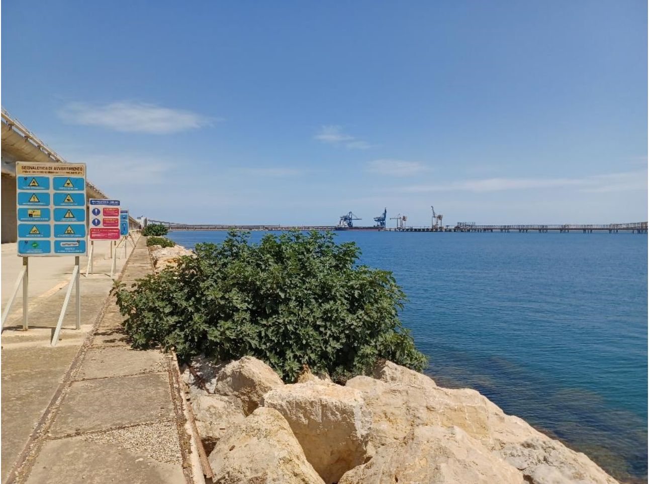
Figura 2.7: Foto No. 07 – Area di Intervento FSRU Vista da Sud-Ovest