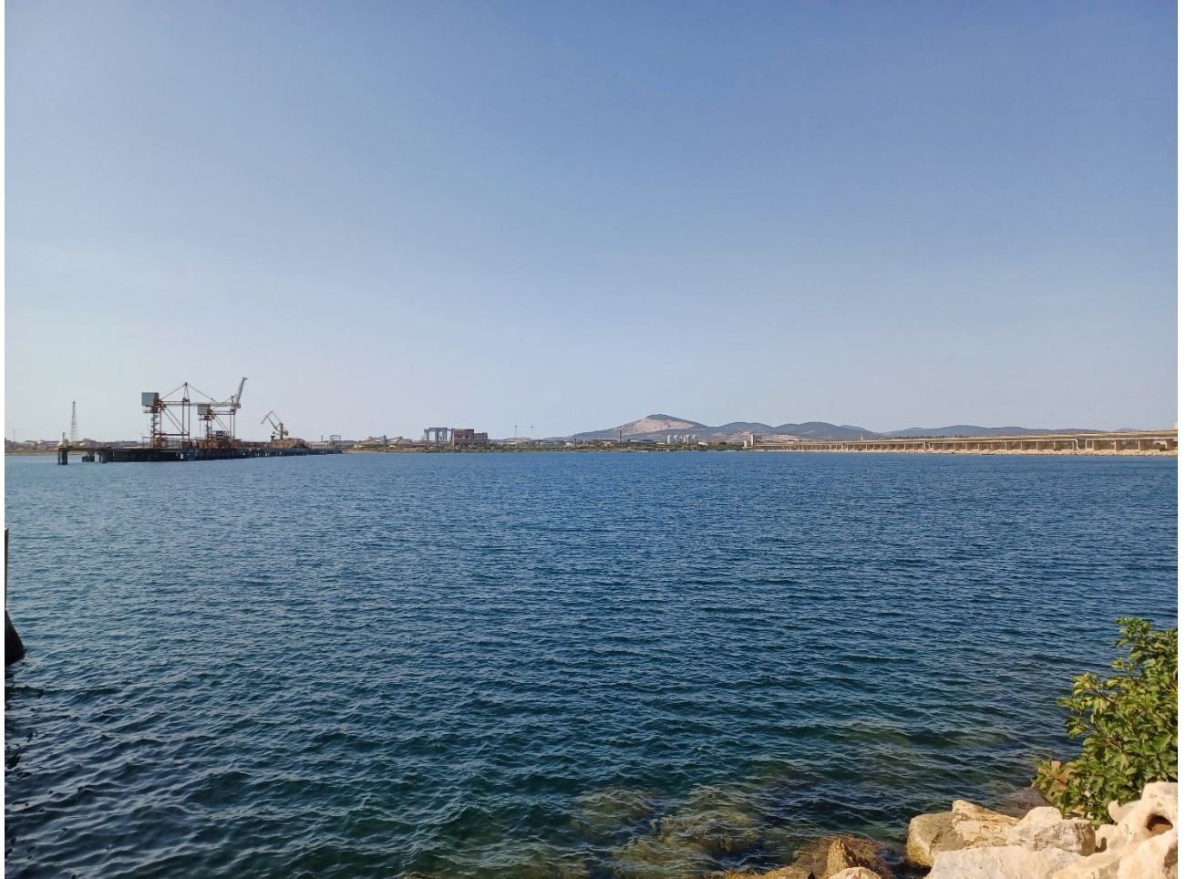
Figura 2.12: Foto No. 12 – Area di Intervento (Approdo Condotta a Mare) vista da Nord