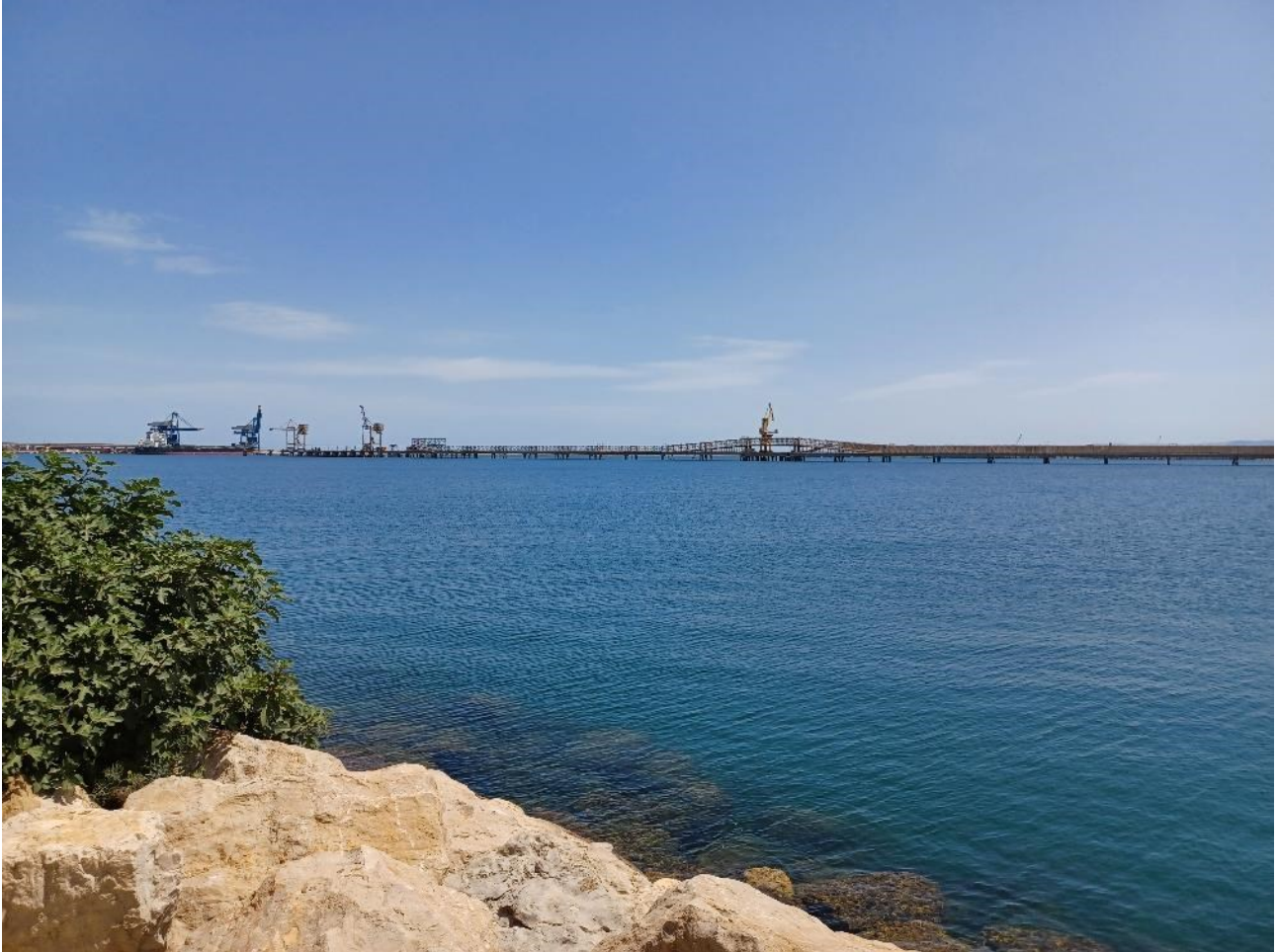
Figura 2.6: Foto No. 06 – Area di Intervento FSRU Vista da Sud-Ovest