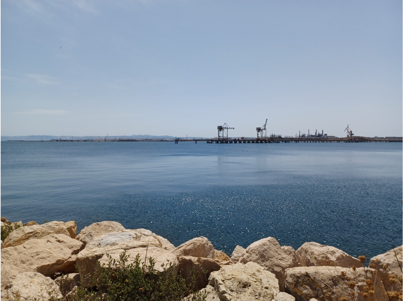
Figura 2.11: Foto No. 11 – Bacino Portuale vista da Ovest