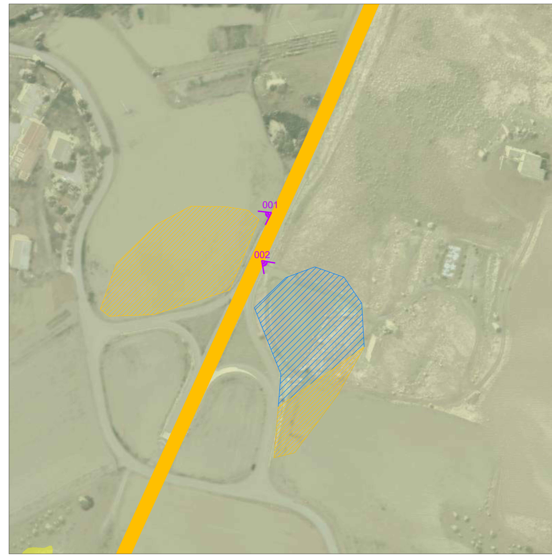
AREA DI CANTIERE SU FOTOPIANO 1:2.000