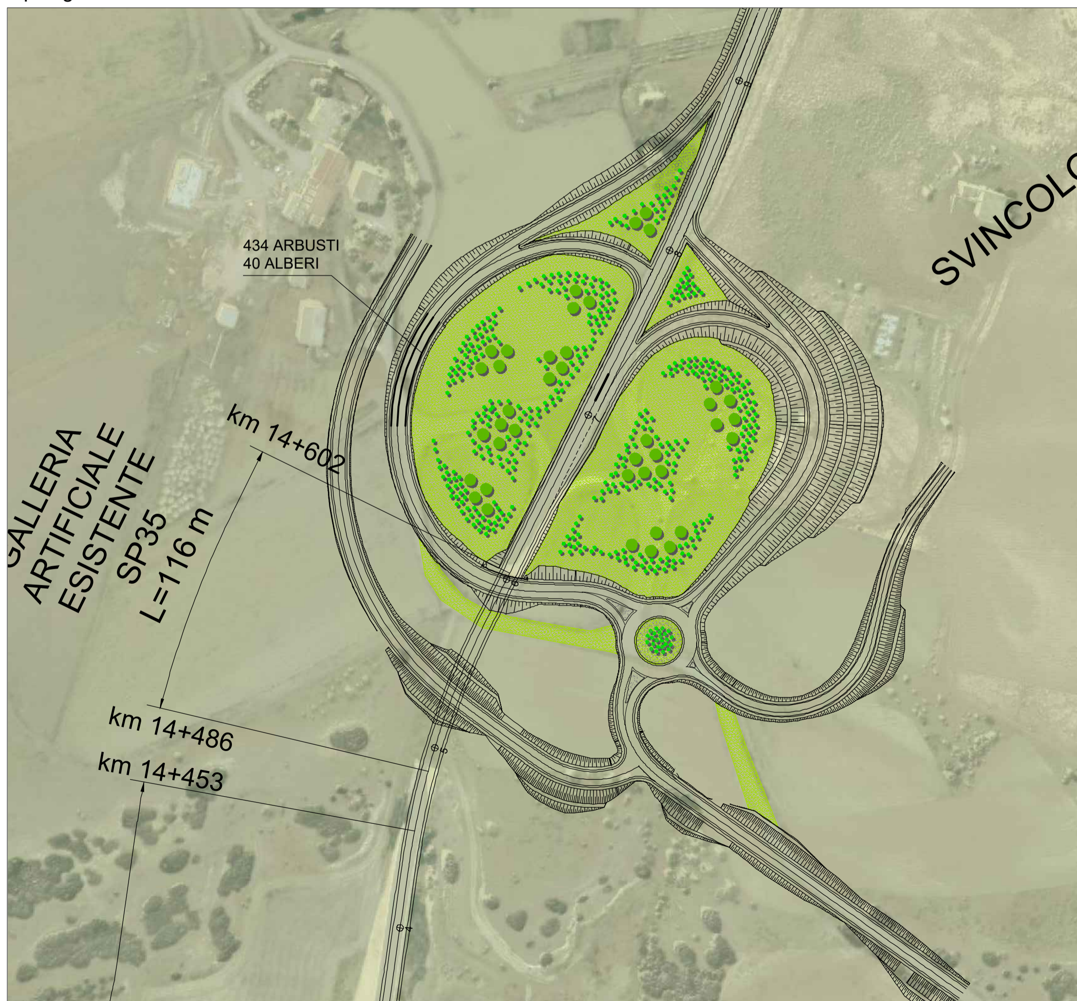
Sistemazione ornamentale Svincolo esistente su SP 35 Tipologici di intervento: MP4.b - MP5