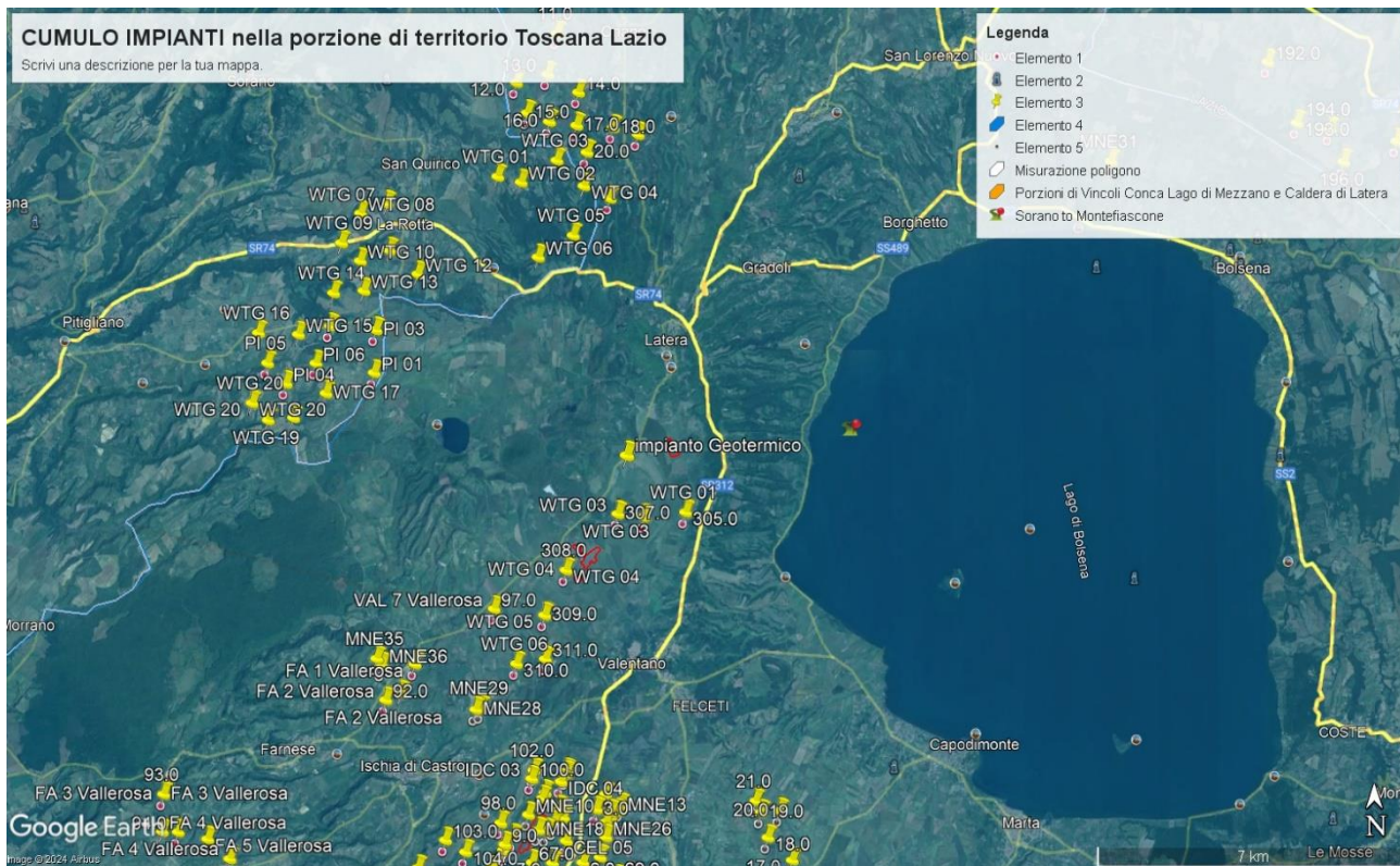
Immagine 3. Cumulo di una parte di impianti eolici, fotovoltaici e geotermici industriali in progettazione ed esistenti intorno all’eolico industriale “Pitigliano”.

Nella Parte IV delle Linee guida citate al punto 16.1, nello stabilire i requisiti per la valutazione positiva dei progetti nel procedimento di VIA si parla di individuazione delle aree idonee per l’insediamento degli impianti tenendo conto di aree degradate da attività antropiche pregresse o in atto (brownfield) tra cui siti industriali, cave, discariche, siti contaminati. Stessa raccomandazione viene ribadita anche nell’art.20 del D.Lgs n. 199/2021. Ma appare inascoltata dalla proponente. Infatti, insiste molto nel dire che il suo impianto industriale è compatibile con il territorio nonostante le numerose incompatibilità paesaggistiche, culturali, economiche e naturalistiche che esso incontra.