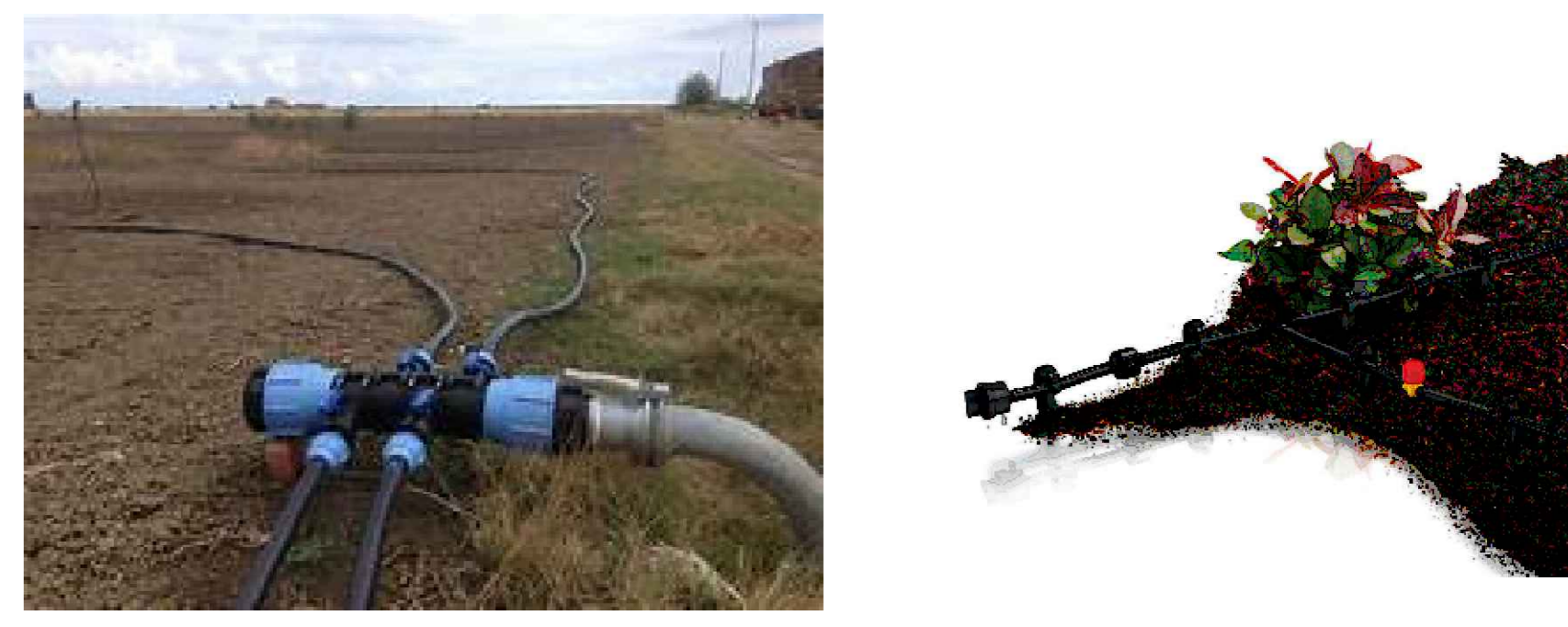
SISTEMA DI IRRIGAZIONE PER MITIGAZIONE PERIMETRALE E IRRIGAZIONE AREE COLTIVE