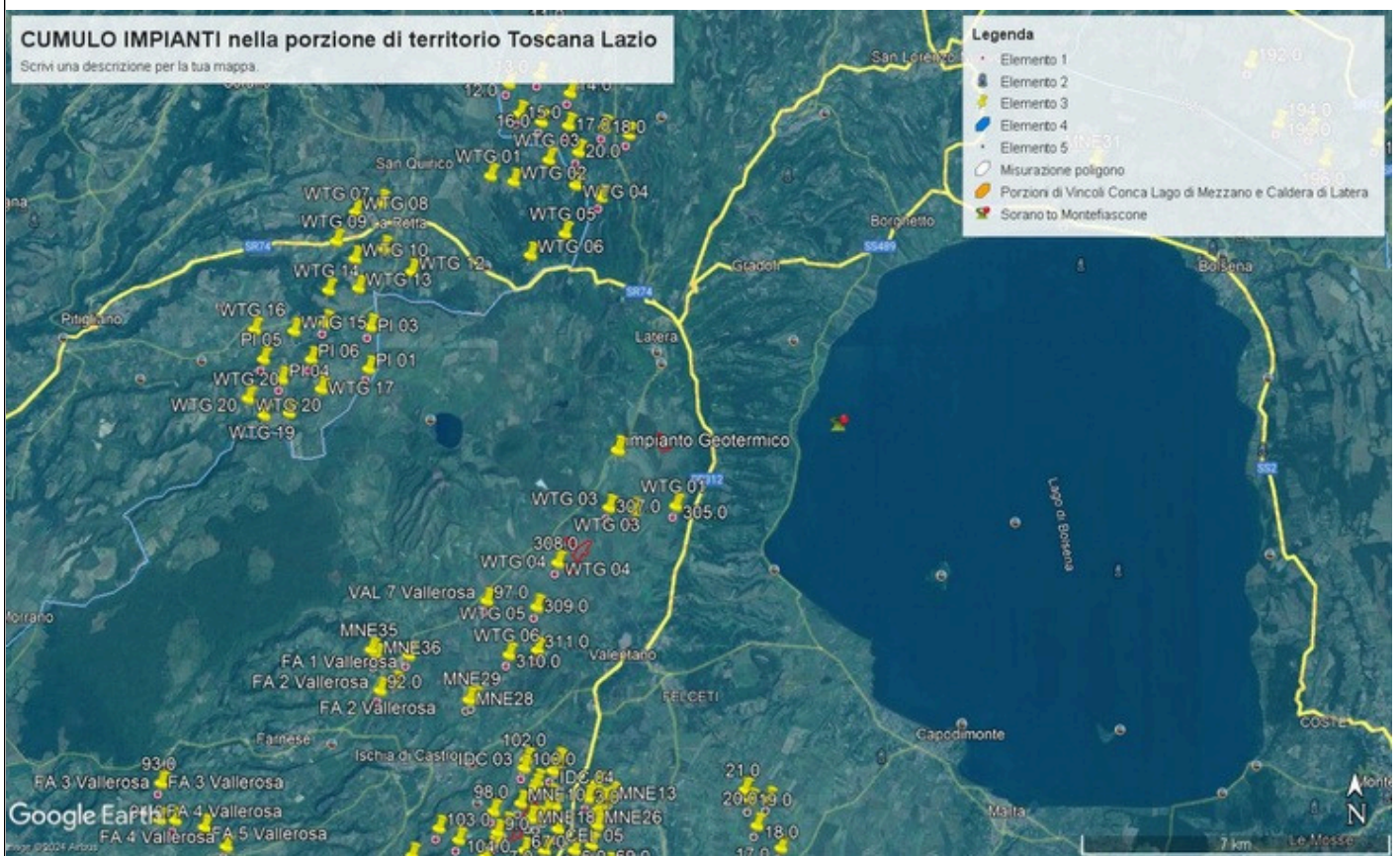
Immagine 3. Cumulo di una parte di impianti eolici, fotovoltaici e geotermici industriali in progettazione ed esistenti intorno all'eolico industriale Pitigliano .

Nella Parte IV delle Linee guida citate al punto 16.1, nello stabilire i requisiti per la valutazione positiva dei progetti nel procedimento di VIA si parla di individuazione delle aree idonee per l'insediamento degli impianti tenendo conto di aree degradate da attività antropiche pregresse o in atto (brownfield) tra cui siti industriali, cave, discariche, siti contaminati. Stessa raccomandazione viene ribadita anche nell'art.20 del D.Lgs n. 199/2021. Ma appare inascoltata dalla proponente. Infatti, insiste molto nel dire che il suo impianto industriale è compatibile con il territorio nonostante le numerose incompatibilità paesaggistiche, culturali, economiche e naturalistiche che esso incontra.