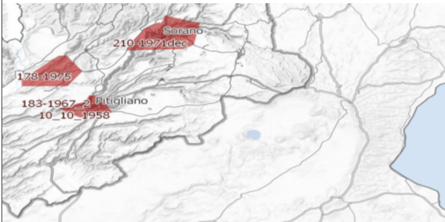
Immagine 1. Vincoli ex art. 136 del CBC dal PIT della Regione Toscana e zona approssimativa dove è progettato l'impianto industriale.

E ancora, come sostiene la stessa Proponente, parte dell'impianto si verrebbe a trovare a 3,5 km dal centro abitato di Sorano. Infatti, due degli aerogeneratori WTG 08 e 09, sono addirittura all'interno delle fasce di rispetto dei 3 km del vincolo paesaggistico di notevole interesse pubblico ex art 136 del CBC. Si evidenzia che così si crea un'ulteriore incompatibilità con la tutela del Paesaggio.