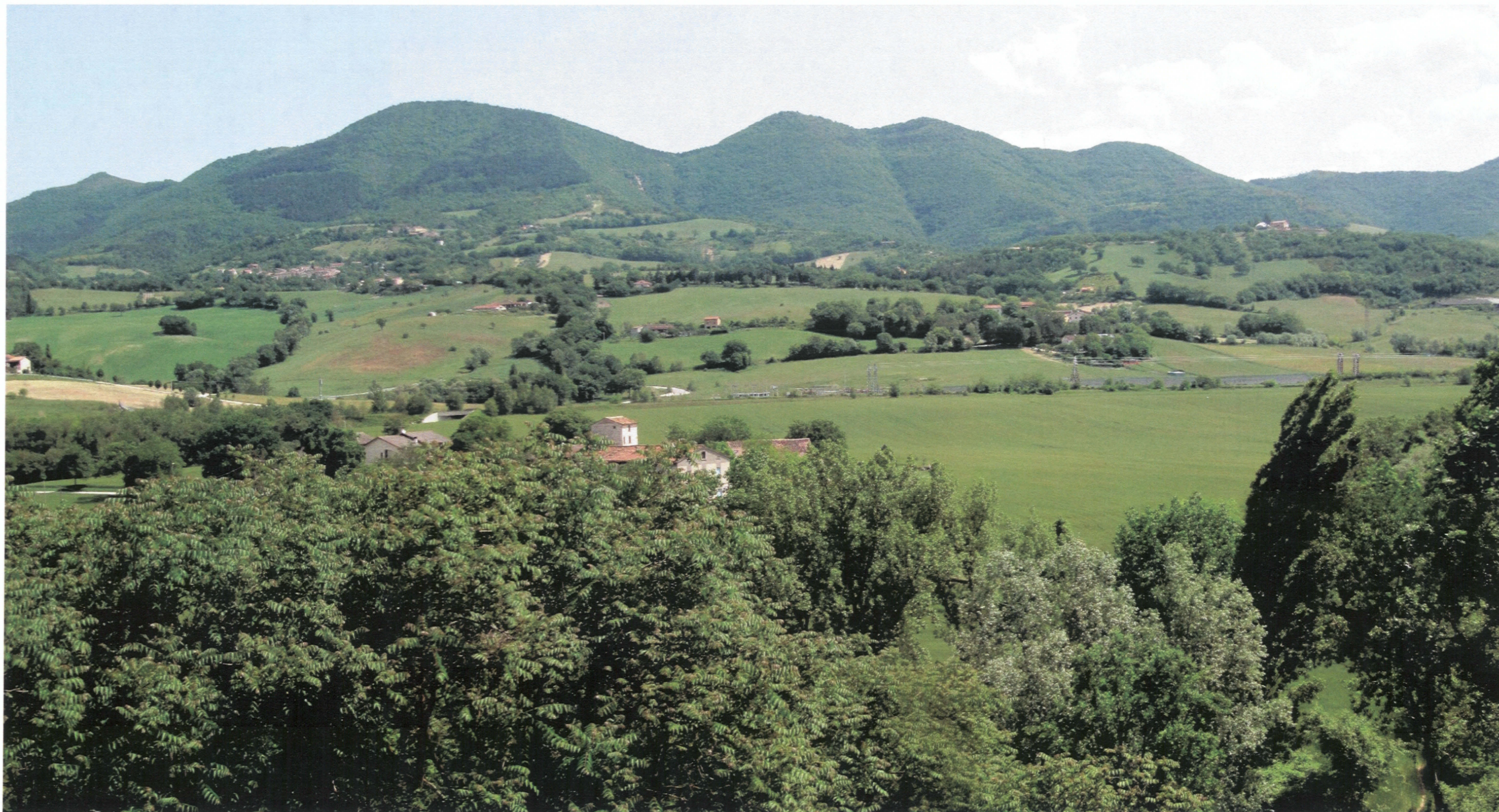
RIPRESA FOTOGRAFICA 1 _ STATO POST OPERAM