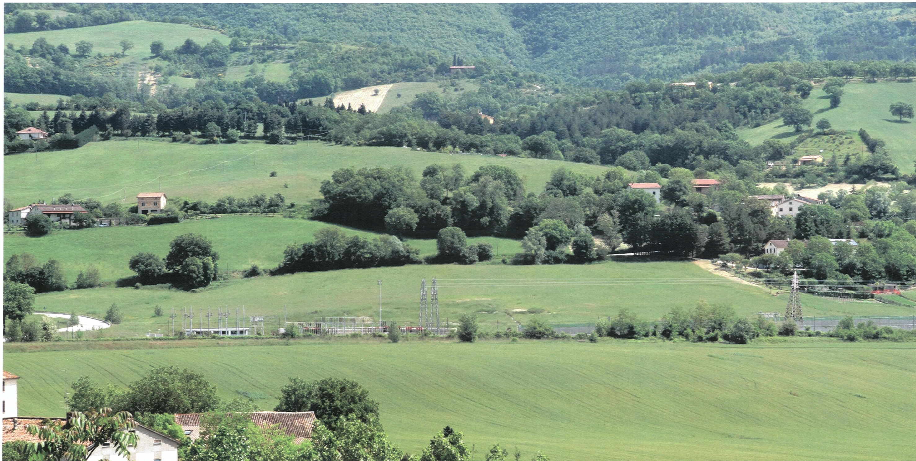
RIPRESA FOTOGRAFICA 2 _ STATO POST OPERAM