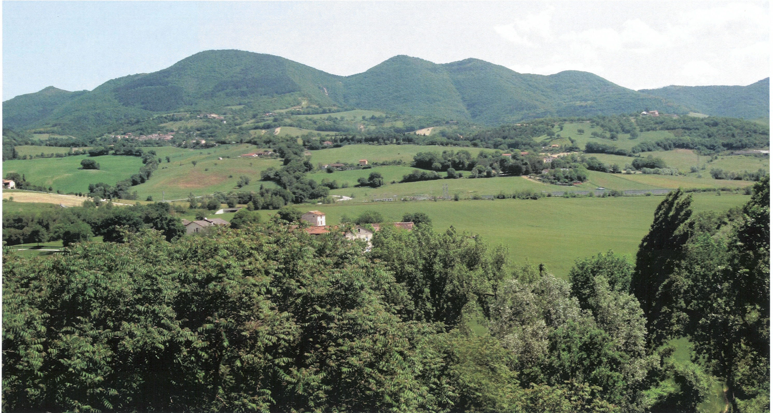
RIPRESA FOTOGRAFICA 1 _ STATO ANTE OPERAM