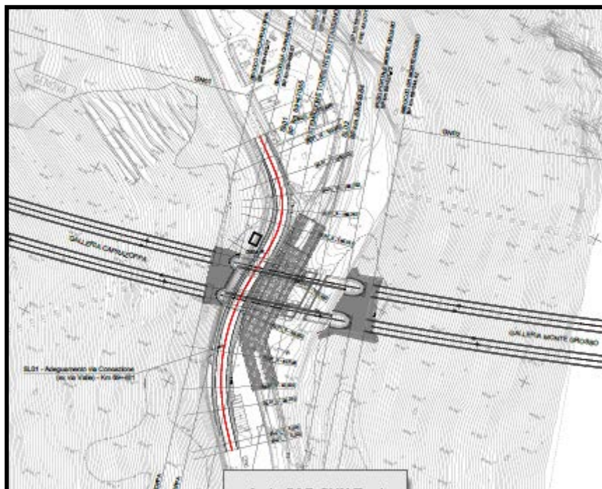
Figura 4 – Stato di progetto

Il limite amministrativo è stato imposto pari a 40 km/h, pari alla velocità di progetto massima utilizzata.