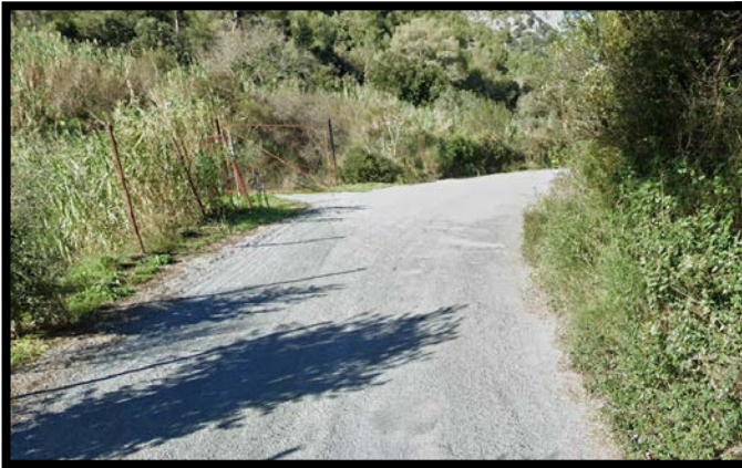
Figura 1 – Stato di fatto - Geometrie

La viabilità attuale presenta forti criticità e si riscontrano diversi elementi di geometria stradale assolutamente non conformi alla normativa per la tipologia di riferimento. In primis vi è la presenza di curve con raggi molto ridotti e comunque sempre prive di elementi di transizione.