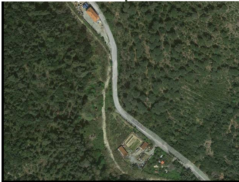
Figura 3 – Stato di fatto – Vista dall'alto

Infine, la pavimentazione presenta evidenti segni di usura, risultando spesso sconnessa, e manca, in parte, una corretta regimentazione delle acque meteoriche, che provoca importanti problemi di sicurezza e una forte accelerazione dei fenomeni di deterioramento.