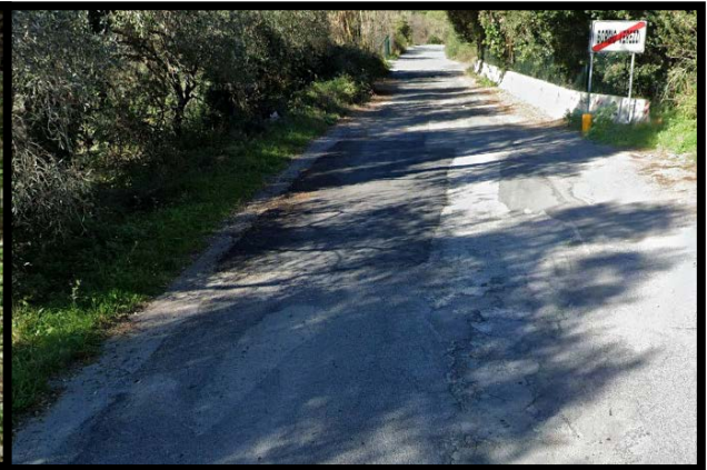
Figura 2 – Stato di fatto - Pavimentazione