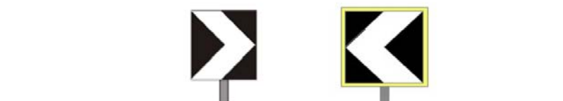
Figura 7 - CMF Delineatori di curva