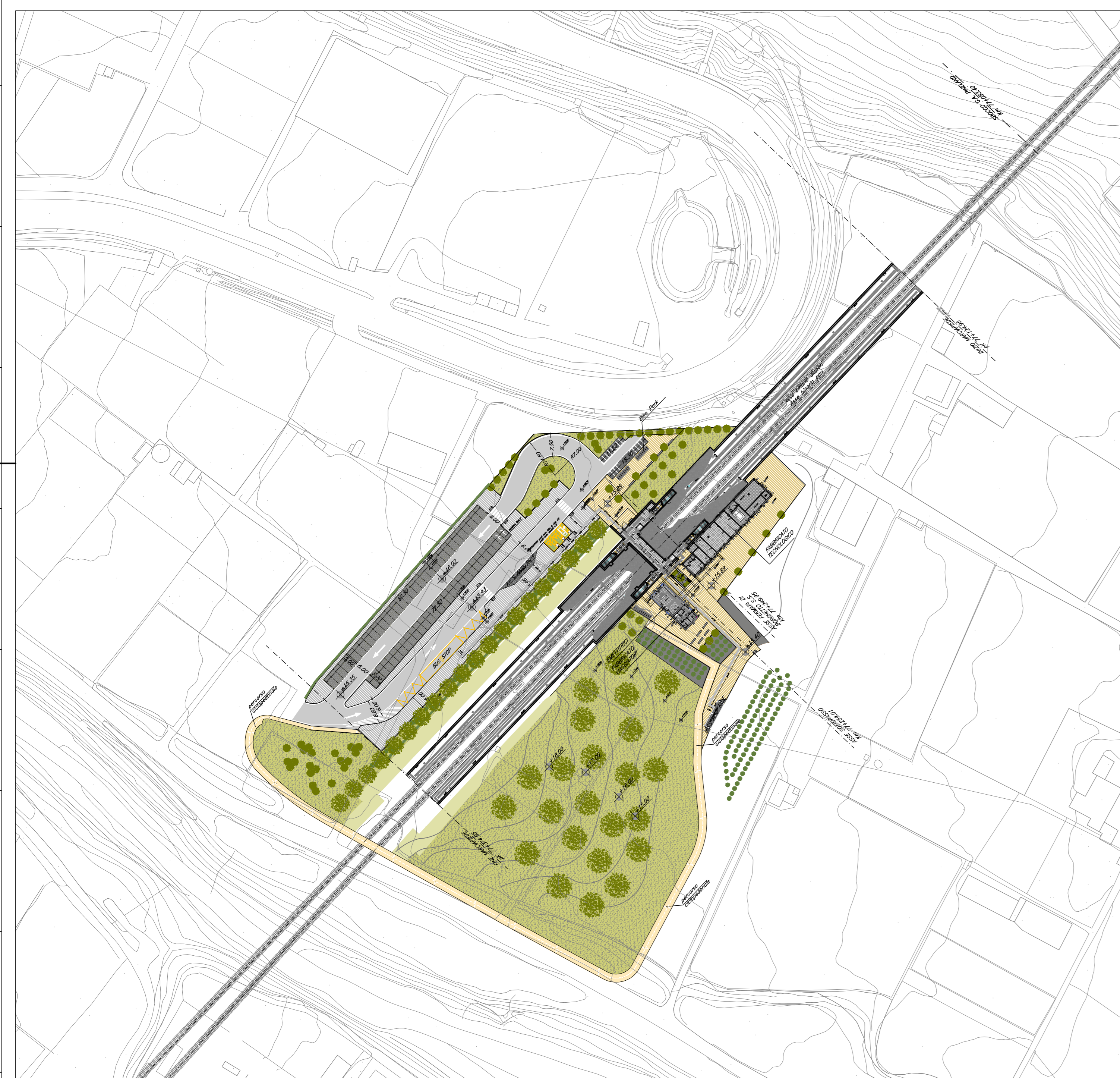
PIANTA CHIAVE - SCALA 1:1000