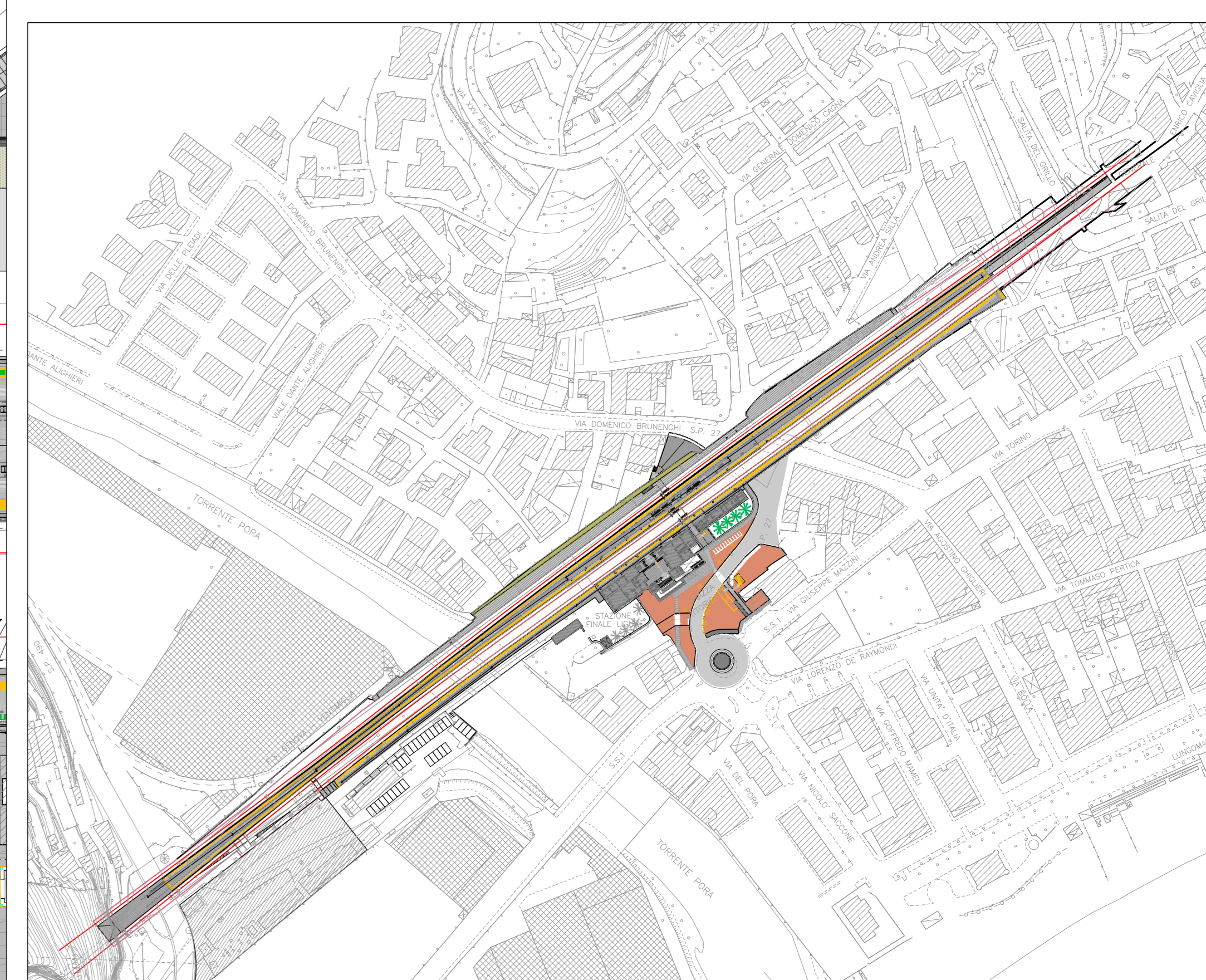
PIANTA CHIAVE - SCALA 1:2000