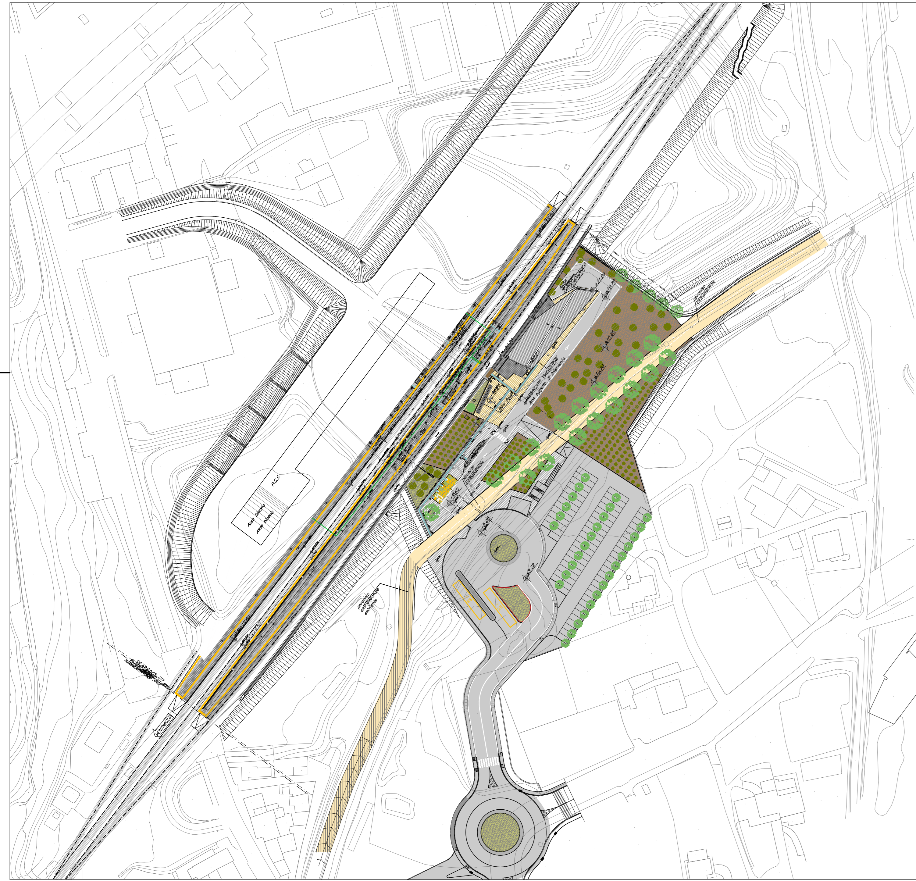
PIANTA CHIAVE - SCALA 1:1000

NOTE I cavi di alimentazione delle telecamere saranno passati all'interno di una condotta portacavi comune a tutti gli impianti a correnti deboli. I cavidotti ed i pozzetti lungo le banchine ed all'interno del sottopasso saranno condivisi e computati da altre specialistiche, per i dettagli fare riferimento agli elaborati LM/OSCC. La posizione delle telecamere installate lungo le banchine sarà finalizzata nella fase di progettazione esecutiva in coordinamento con la posizione finale dei poli di illuminazione.