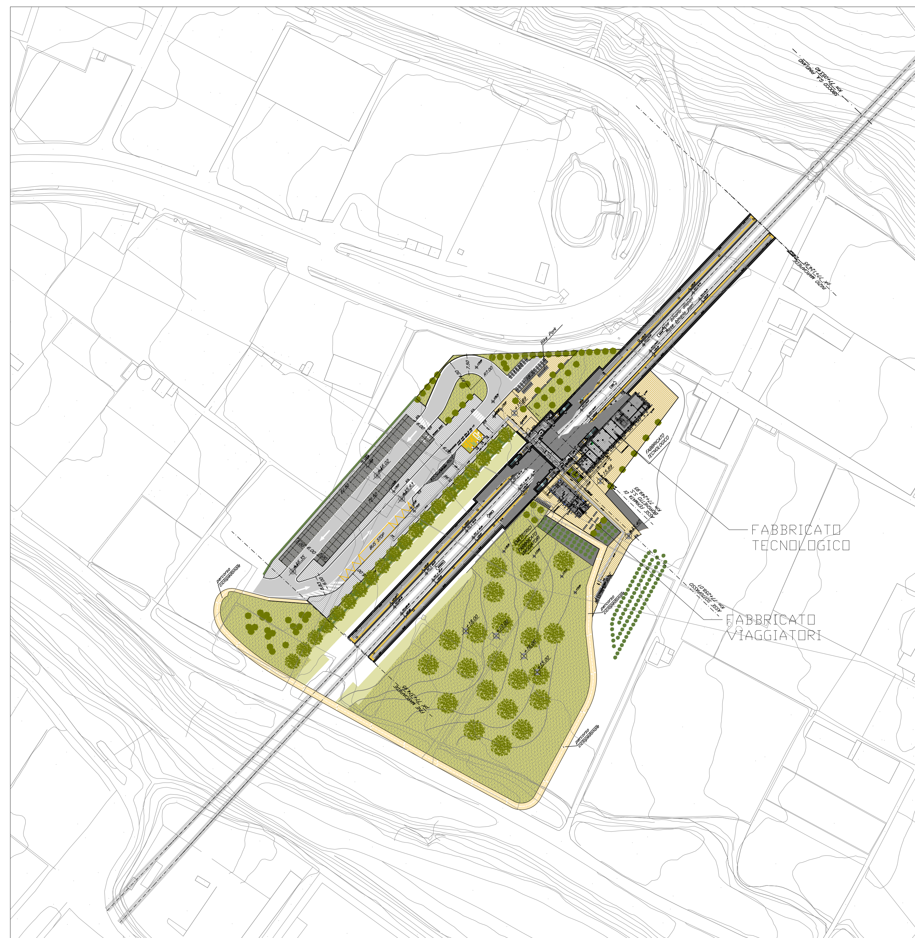
PIANTA CHIAVE - SCALA 1:1000