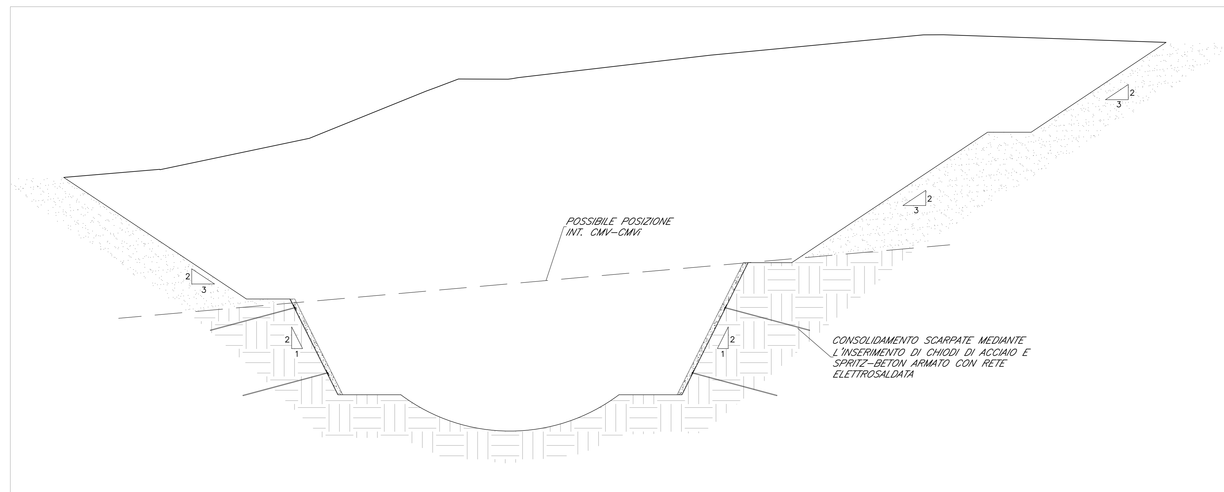
FASE "1" Scavo fino a quota fondo galleria.