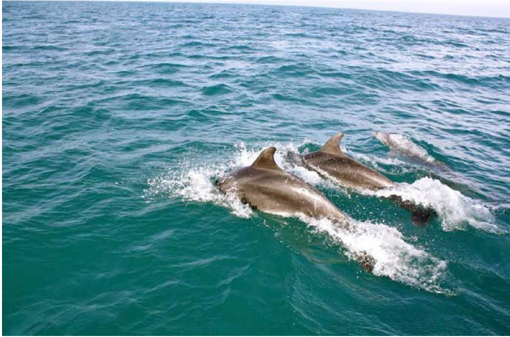
In figura: Delfini avvistati nei pressi delle isole Tremiti nel 2009