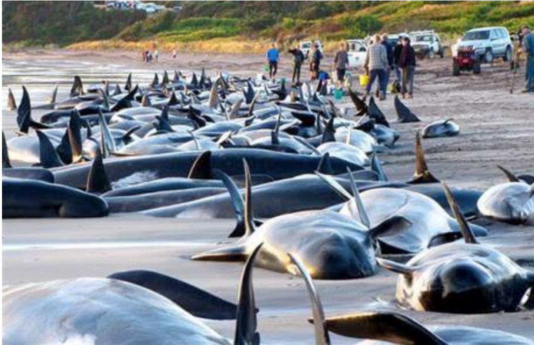
In figura: Spiaggiamento di balene in Tanzania, 2009 dovute alle operazioni di airgun. Tutte le 200 balene spiaggiate sono poi morte.

Infine nel 2009 a King's island, in Tasmania, ci fu lo spiaggiamento di circa 200 balene, tutte morte, in seguito ad attività di ispezioni sismiche, di 48 balene a Perkins Island e di altre 80 a Sandy Cape, nella stessa nazione e sempre a causa di ispezioni sismiche [50]. Tutto questo è da considerarsi contrario a quanto afferma la Northern Petroleum Plc a pagina 54 del suo Studio di Impatto Ambientale quando afferma che vi è "assenza di mortalità nella fauna marina" legati alle tecniche di airgun o a pagina 57 dove si afferma che le specie ittiche commerciali "risentono poco delle prospezioni sismiche", sebbene la stessa Northern Petroleum Plc affermi che mortalità maggiore ai campodi di media è stata registrata per orate e calamari esposti ad airgun.