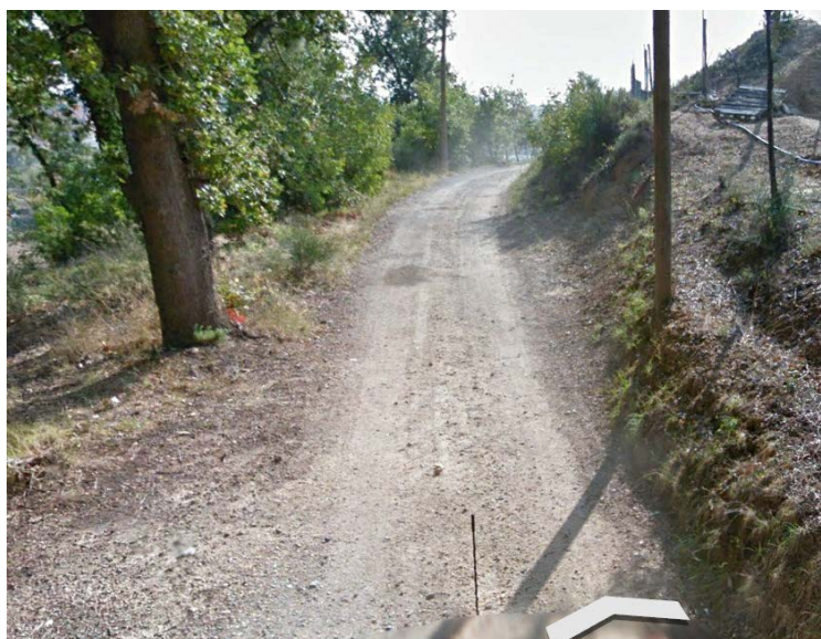
Figura 3 - Stato di fatto

Nella configurazione attuale pertanto si registra una difficoltà oggettiva per gli utenti, che porta a un problema di sicurezza stradale e quindi a un maggior rischio di incidenti.