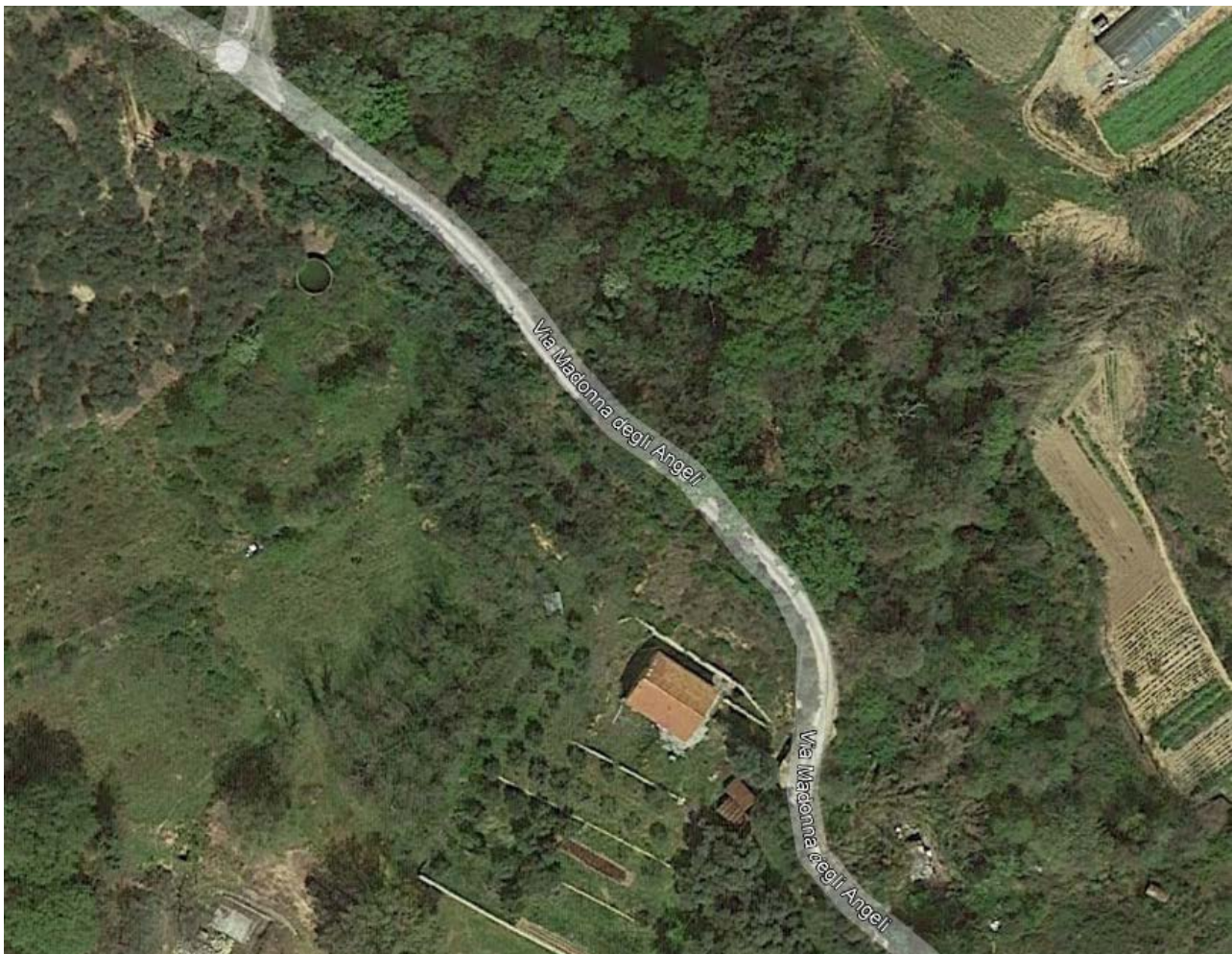
Figura 1 - Stato di fatto - Vista dall'alto

La viabilità attuale presenta forti criticità e si riscontrano diversi elementi di geometria stradale assolutamente non conformi alla normativa per la tipologia di riferimento. In primis vi è la presenza di curve con raggi ridotti e comunque sempre prive di elementi di transizione.