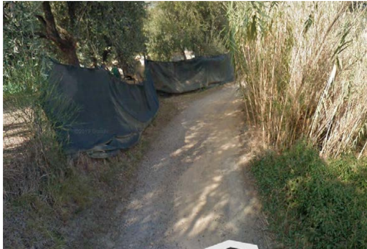
Figura 2 - Stato di fatto

La pavimentazione è inesistente, e manca, completamente, una corretta regimentazione delle acque meteoriche, che provoca importanti problemi di sicurezza e una forte accelerazione dei fenomeni di deterioramento.