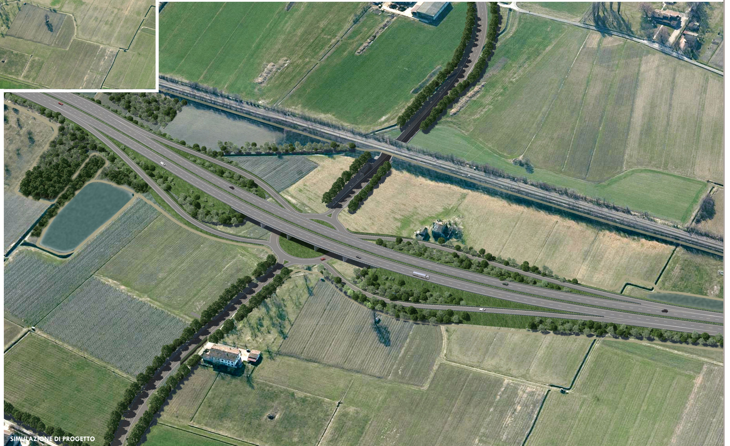
SIMULAZIONE DI PROGETTO