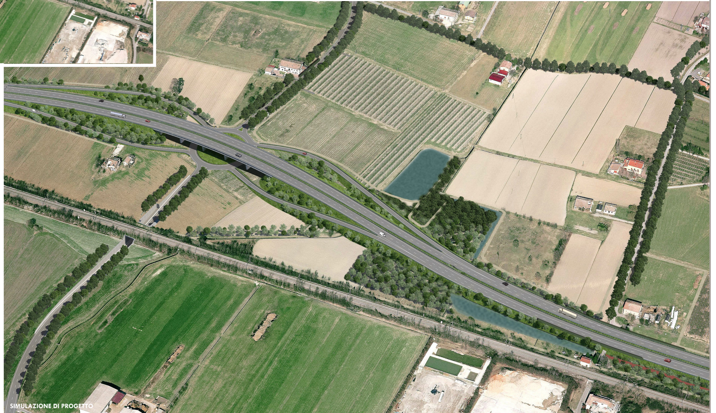
SIMULAZIONE DI PROGETTO