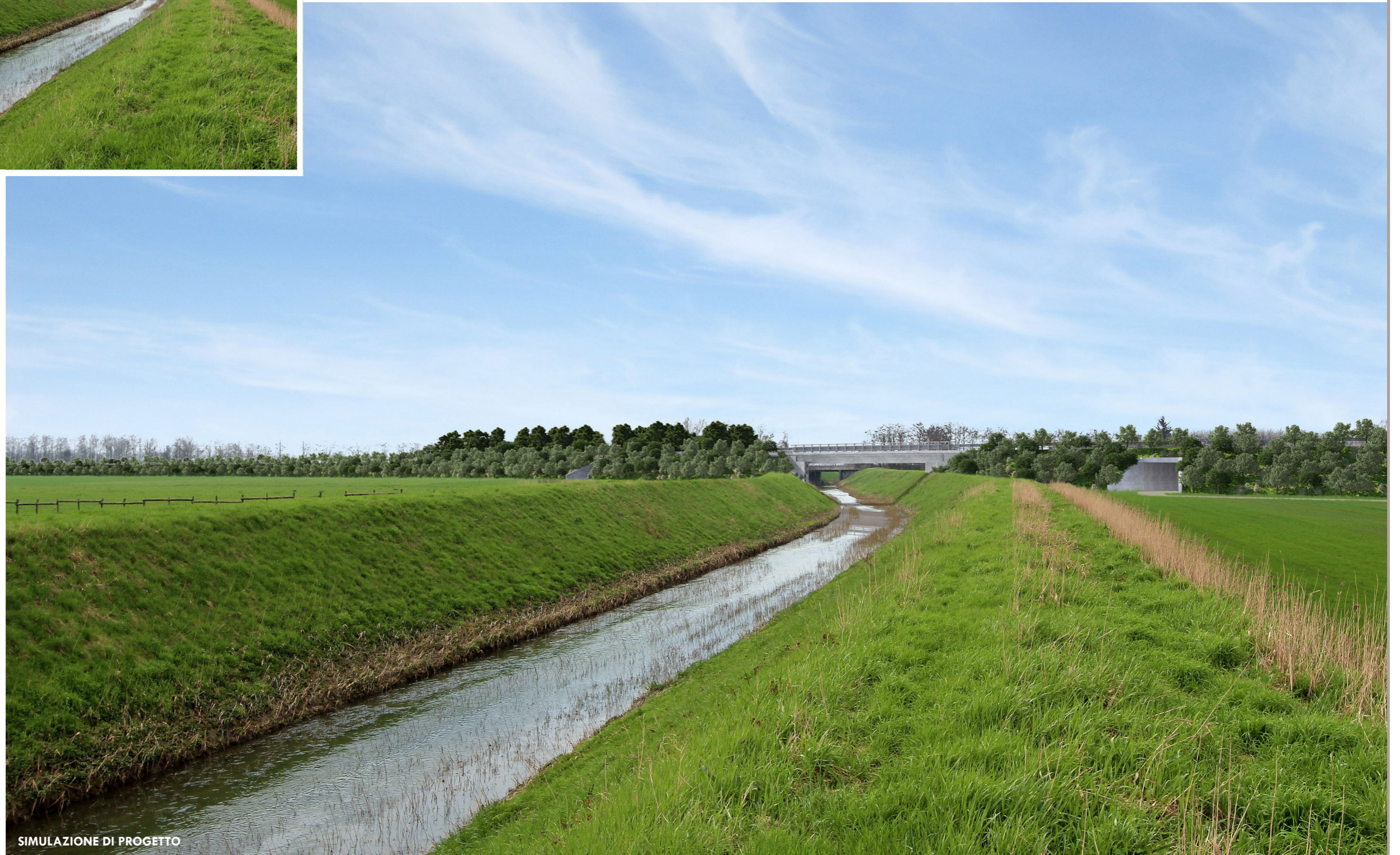
SIMULAZIONE DI PROGETTO