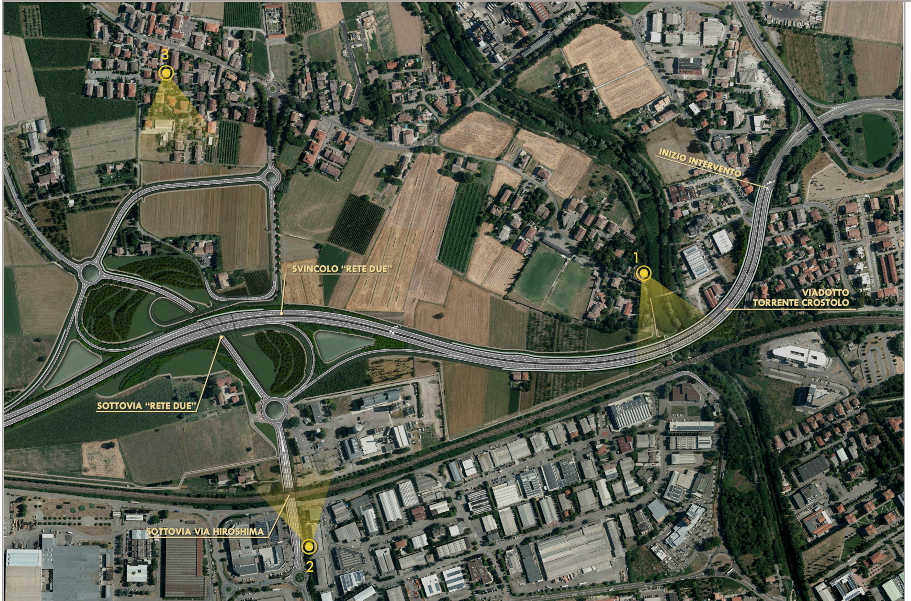
FOTOPIANO CON INDICAZIONE DEI PUNTI DI VISTA DELLE SIMULAZIONI DI PROGETTO