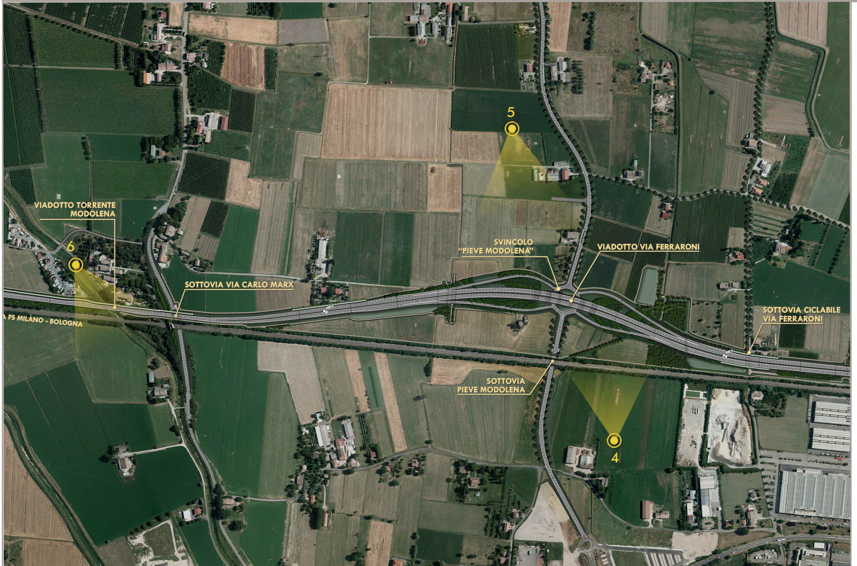
FOTOPIANO CON INDICAZIONE DEI PUNTI DI VISTA DELLE SIMULAZIONI DI PROGETTO