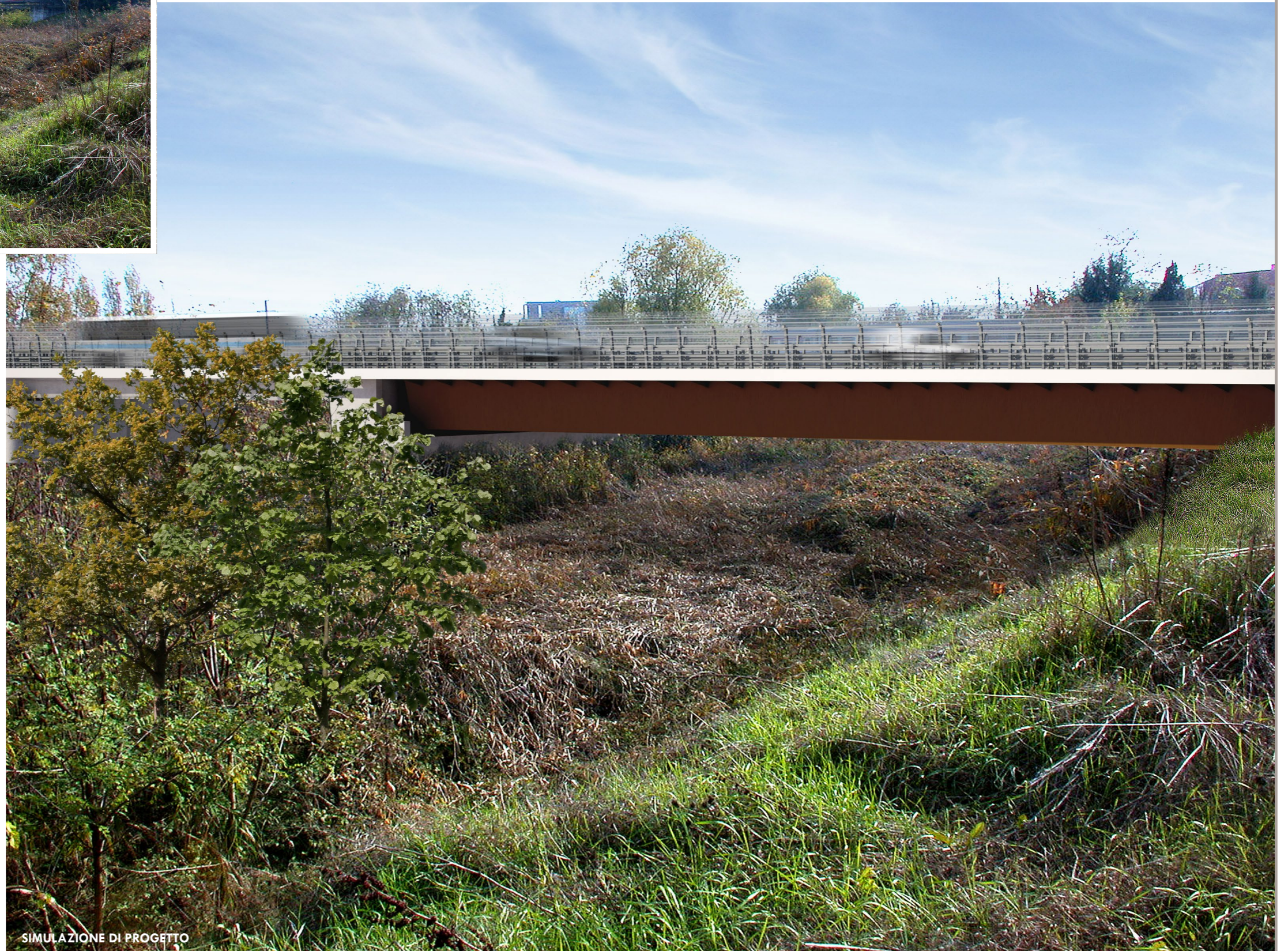
SIMULAZIONE DI PROGETTO