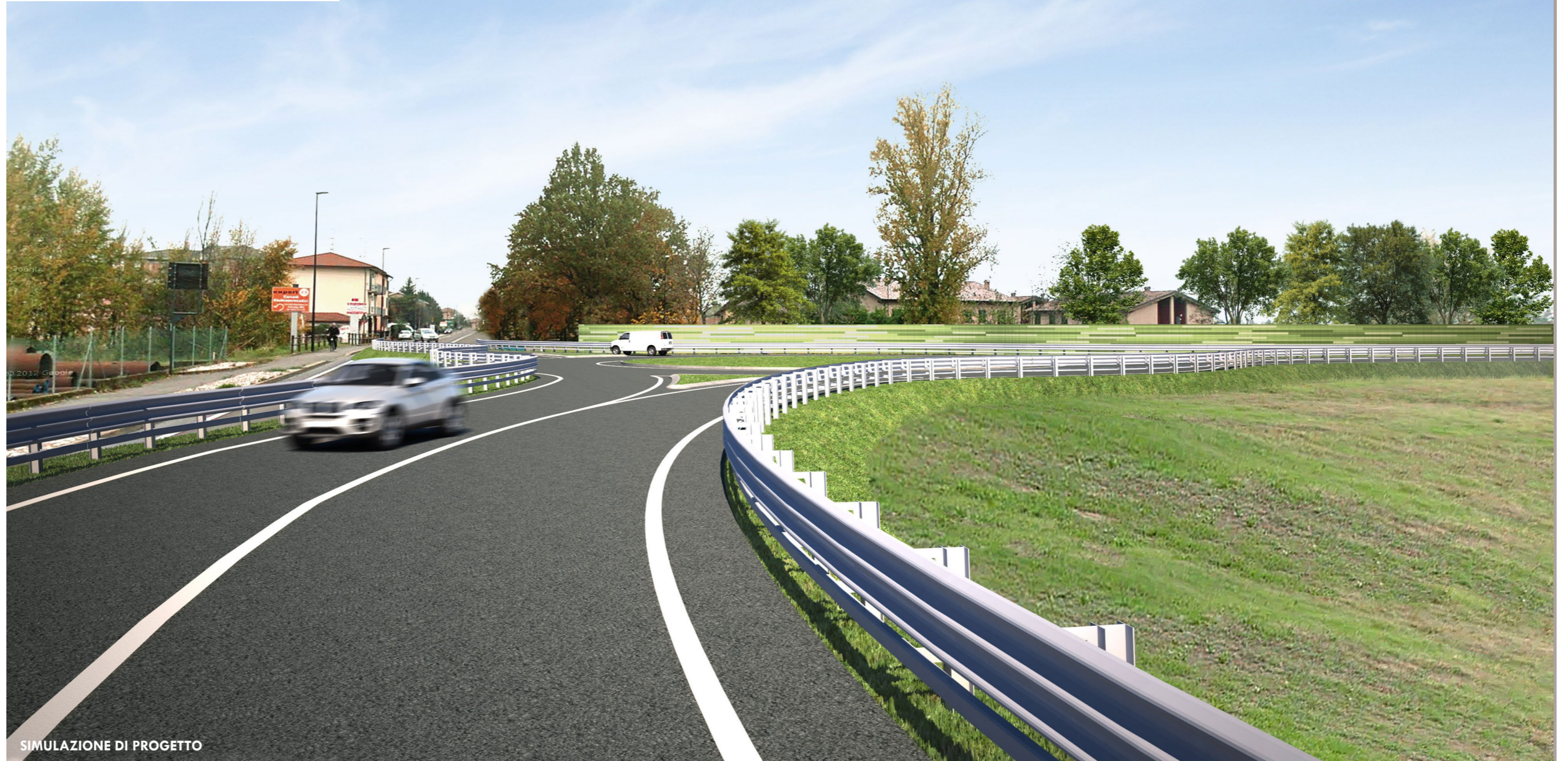
SIMULAZIONE DI PROGETTO