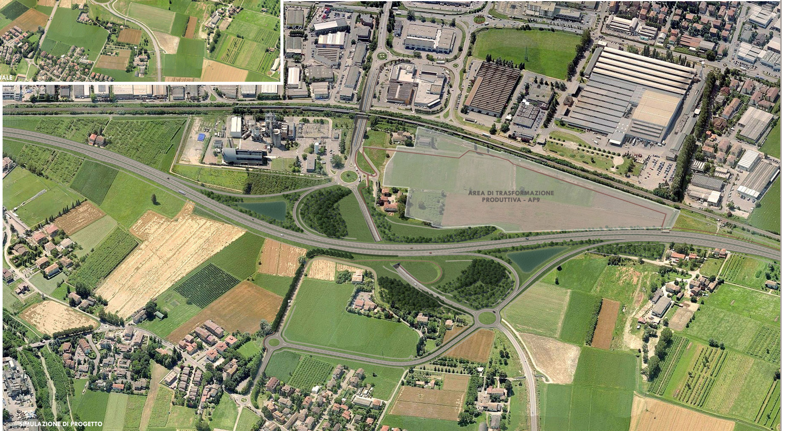
SIMULAZIONE DI PROGETTO