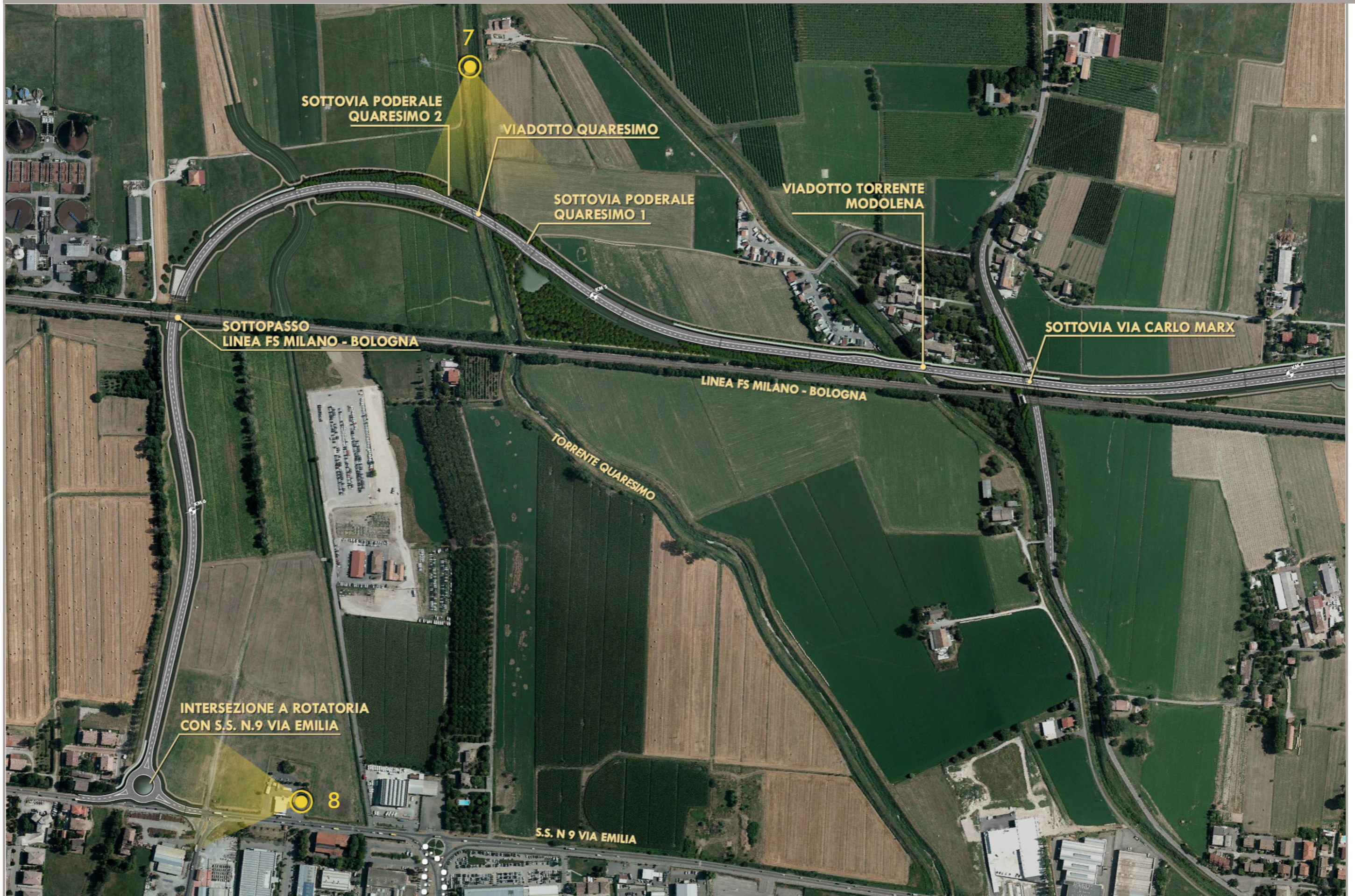
FOTOPIANO CON INDICAZIONE DEI PUNTI DI VISTA DELLE SIMULAZIONI DI PROGETTO