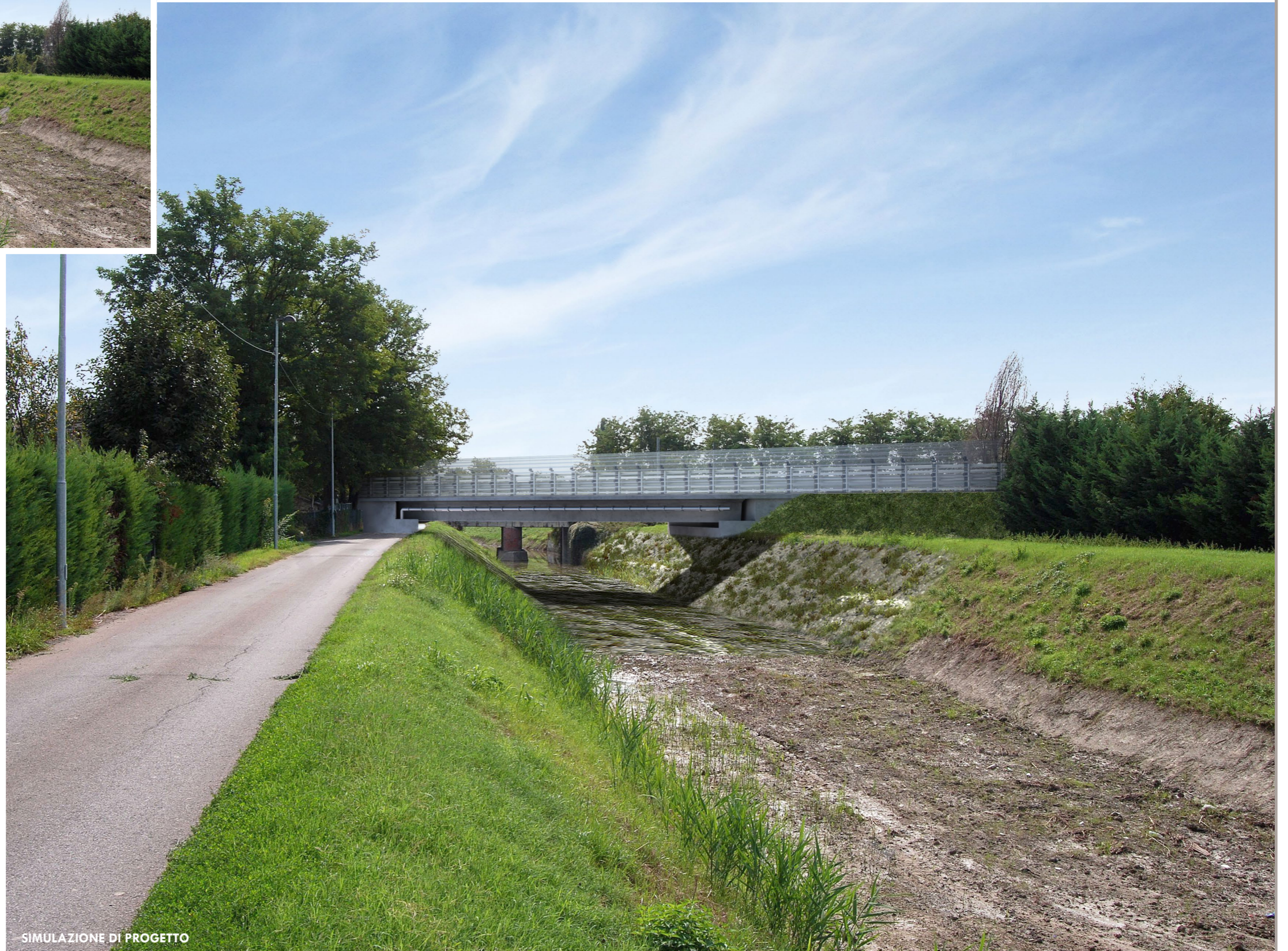
SIMULAZIONE DI PROGETTO