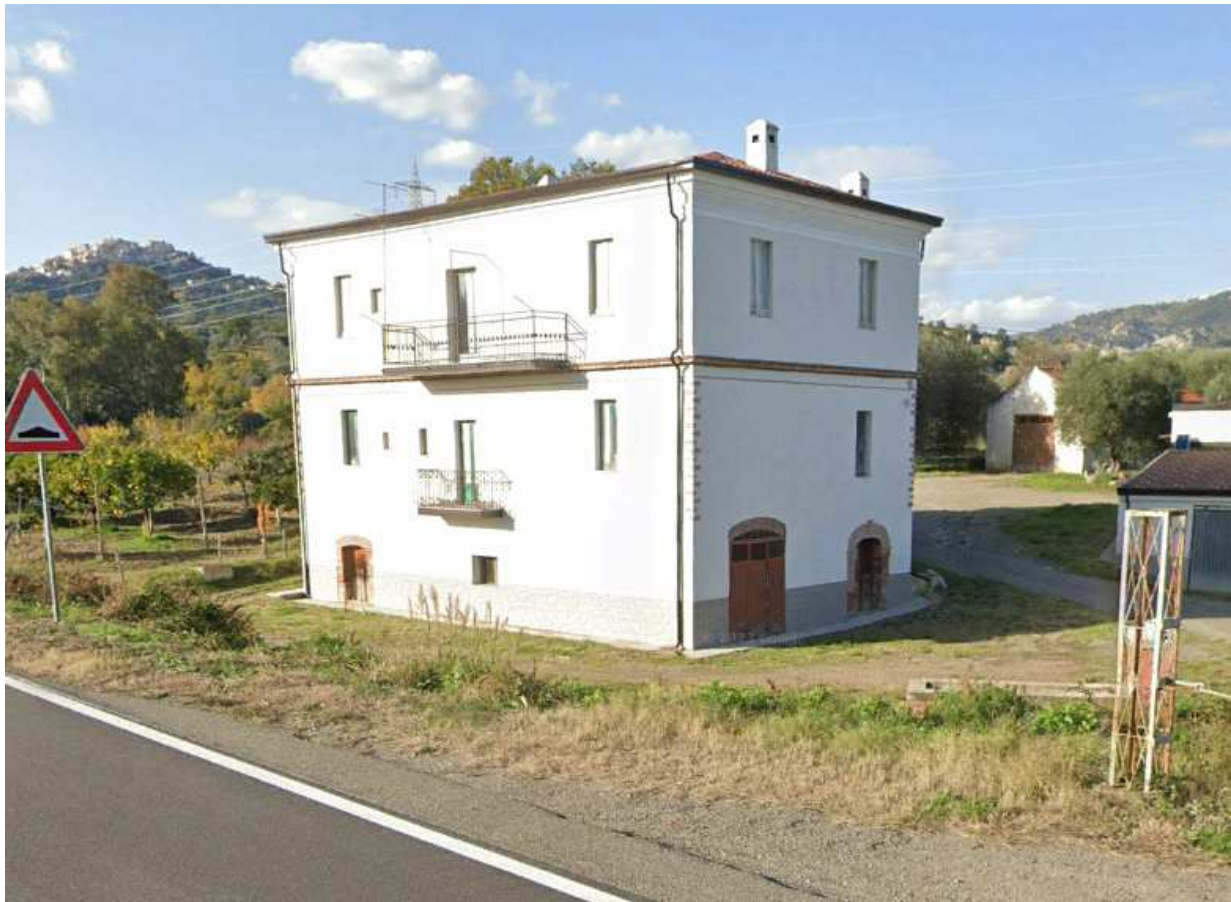
Figura 5: Recettore sensibile 2

Il Comune di Aliano, non ha provveduto alla zonizzazione acustica del proprio territorio. Secondo quanto previsto dall' art. 15 della Legge del 26 ottobre 1995 n. 447 occorre far riferimento all' art. 6 del D.P.C.M. 1 Marzo 1991, secondo il quale le sorgenti sonore fisse devono riferirsi ai Limiti di accettabilità di seguito riportati: