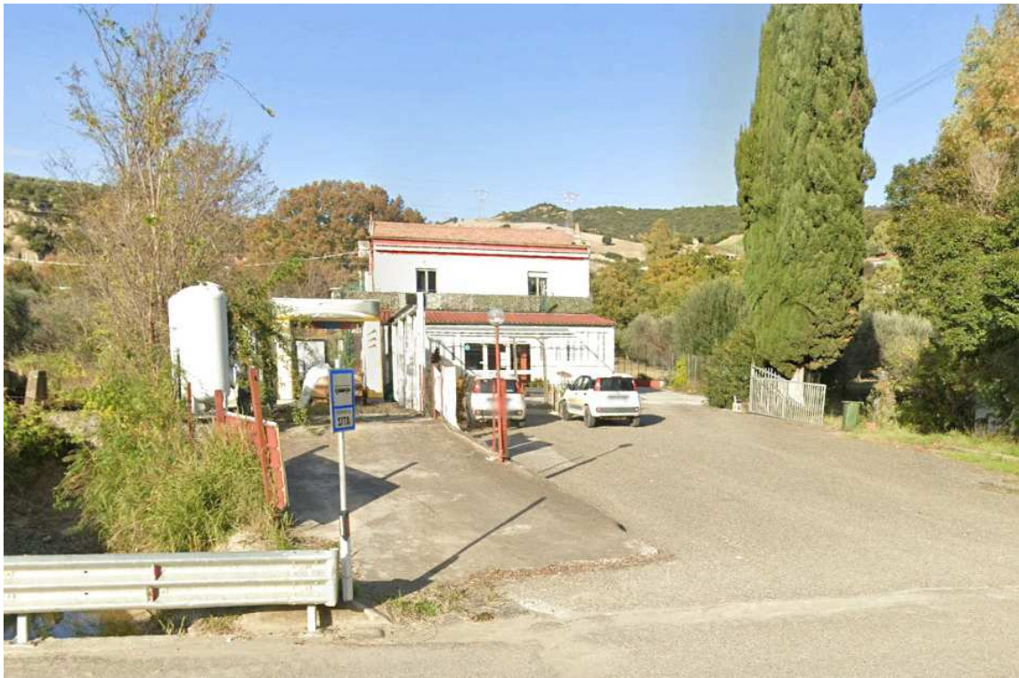
Figura 4: Recettore sensibile 1