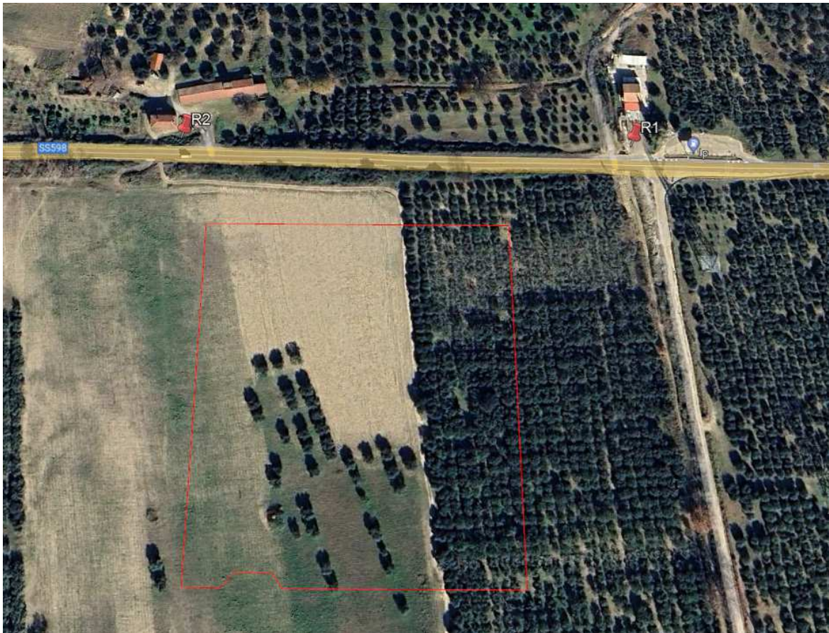
Figura 3: Posizione recettori sensibili