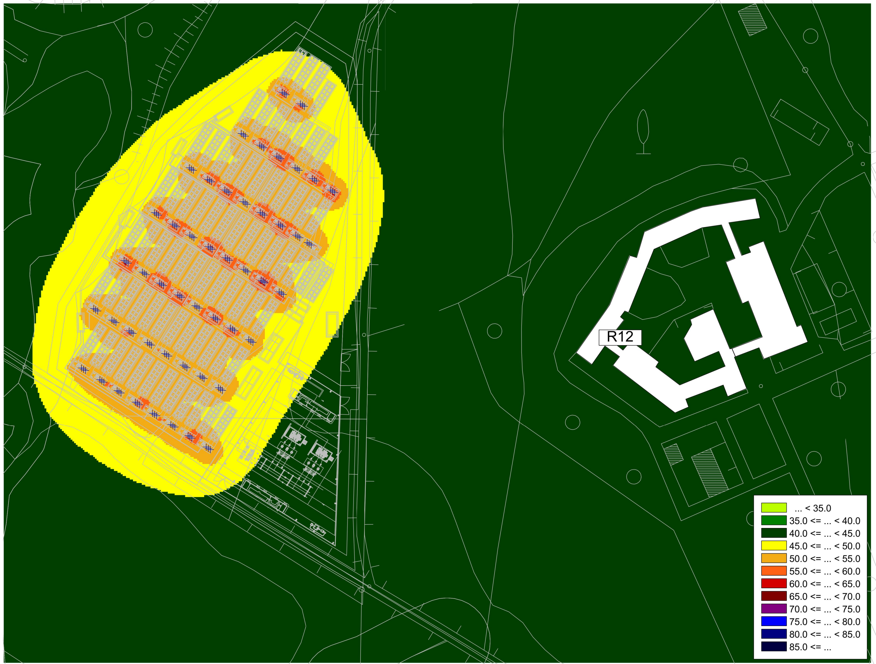
MAPPA A COLORI CON ISOFONICHE - LIVELLI DI IMMISSIONE DIURNO - IMPIANTO ACCUMULO