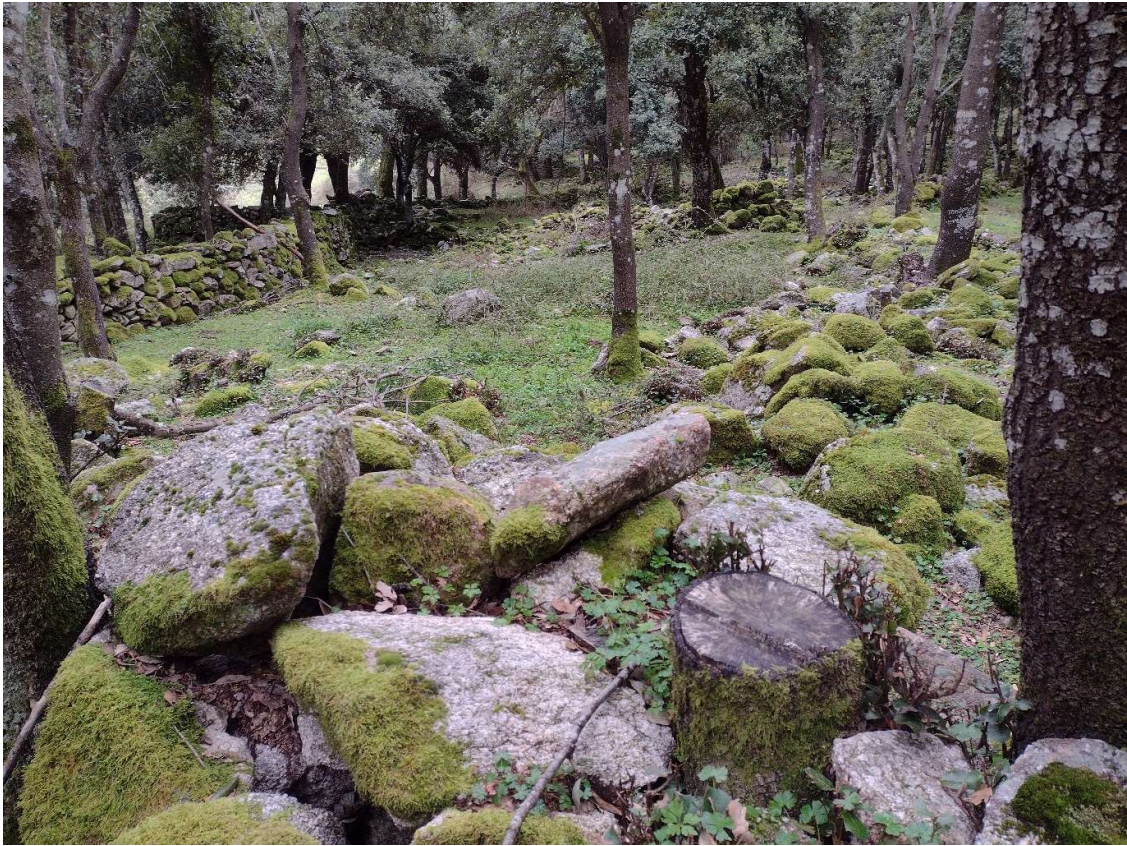
3 – Nuraghe Litu Pedrosu Mannu (40.549612922029205, 9.1100845508959)