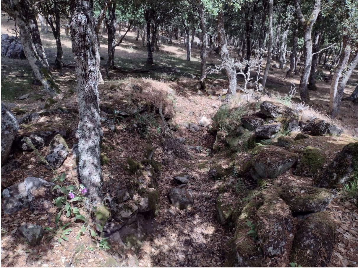
9 – Tomba dei giganti 2 Sedda Otinnera (40.54125632401779, 9.116427732301505)