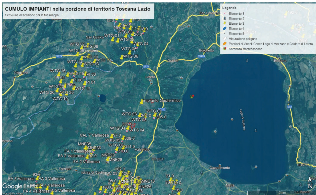
Immagine 3. Cumulo di una parte di impianti eolici, fotovoltaici e geotermici industriali in progettazione ed esistenti intorno all'eolico industriale Pitigliano .

Nella Parte IV delle Linee guida citate al punto 16.1, nello stabilire i requisiti per la valutazione positiva dei progetti nel procedimento di VIA si parla di individuazione delle aree idonee per l'insediamento degli impianti tenendo conto di aree degradate da attività antropiche pregresse o in atto (brownfield) tra cui siti industriali, cave, discariche, siti contaminati. Stessa raccomandazione viene ribadita anche nell'art.20 del D.Lgs n. 199/2021. Ma appare inascoltata dalla proponente. Infatti, insiste molto nel dire che il suo impianto industriale è compatibile con il territorio nonostante le numerose incompatibilità paesaggistiche, culturali, economiche e naturalistiche che esso incontra.