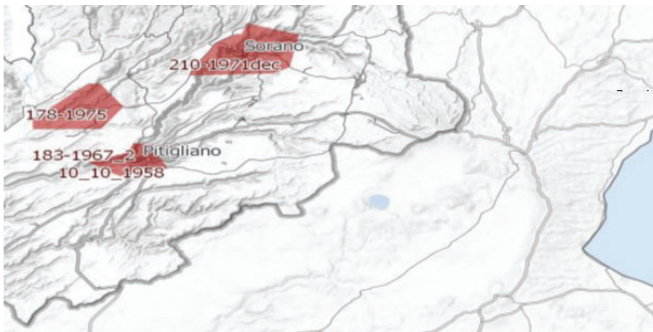
Immagine 1. Vincoli ex art. 136 del CBC dal PIT della Regione Toscana e zona approssimativa dove è progettato l'impianto industriale.

Per quanto riguarda le numerose incompatibilità dell'impianto eolico Pitigliano , con i copiosi e pregevoli beni culturali ed archeologici presenti e caratterizzanti questa parte di territorio tosco-laziale, si rimanda alla documentazione prodotta dalla Proponente che ne individua una messe. La presenza di questi numerosi e significativi beni culturali, insieme ad altre peculiarità, evidenzia in modo lapalissiano che l'impianto eolico Pitigliano , con la sua essenza e carattere industriali, nulla avrebbe a che vedere con il contesto paesaggistico, culturale, storico, economico e delle tradizioni agroalimentari della zona interessata. L'impianto industriale si caratterizzerebbe come elemento estraneo ed avulso oltre che dalla realtà storica ed economica di questo territorio tosco-laziale anche dalla sua stessa e radicata identità culturale.