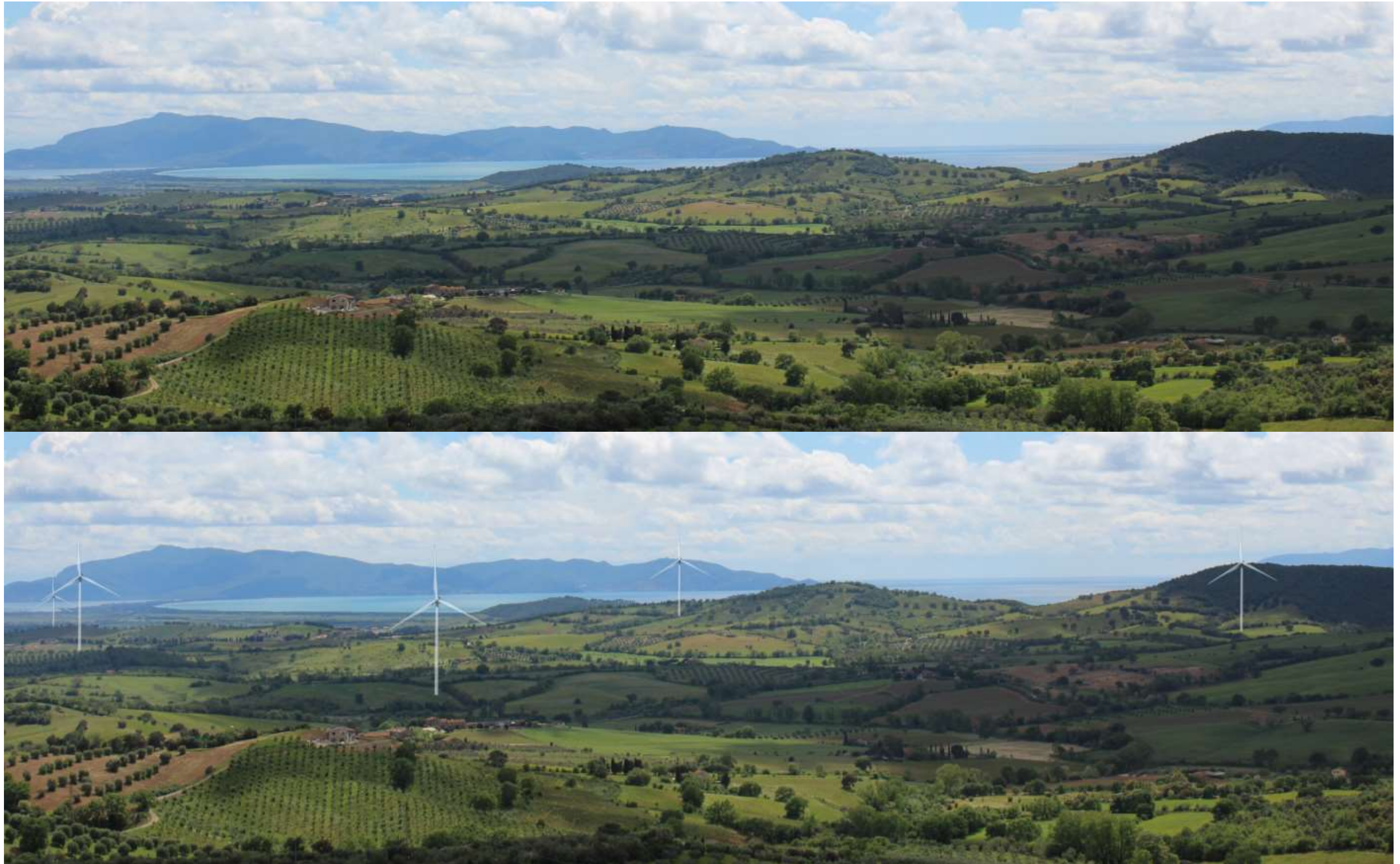
Figura 4—25 Fotoinserimento dal PdO 3.

ALLEGATO_4_m_amte.MASE.REGISTRO UFFICIALE. ENTRATA. 0149237. 09-