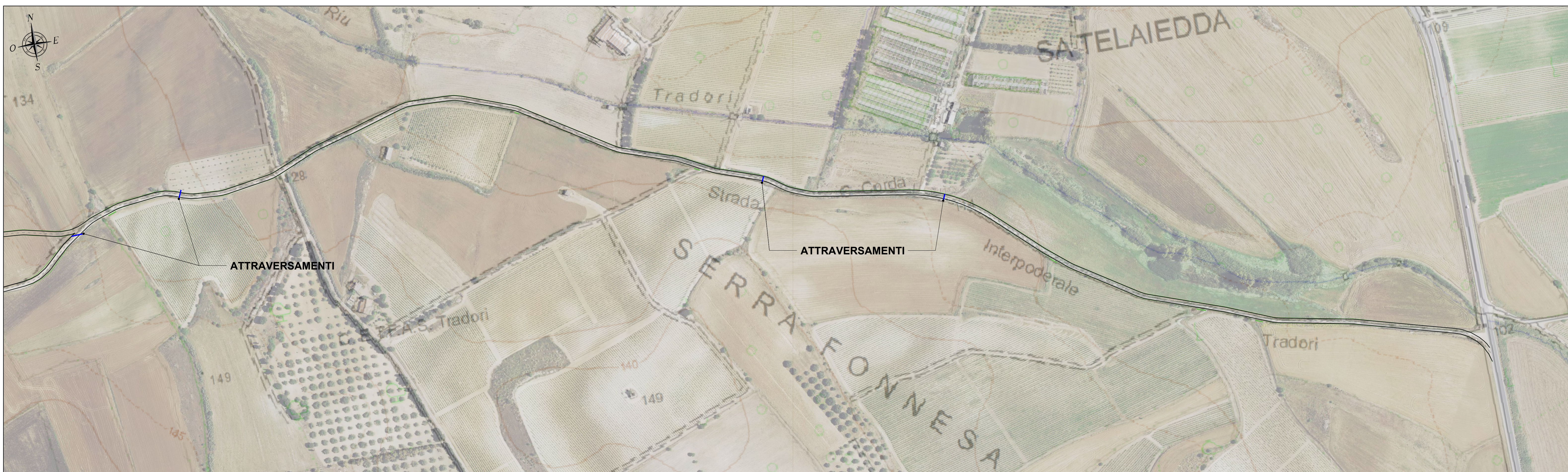
PLANIMETRIA QUADRO 9 - SCALA 1:2.000