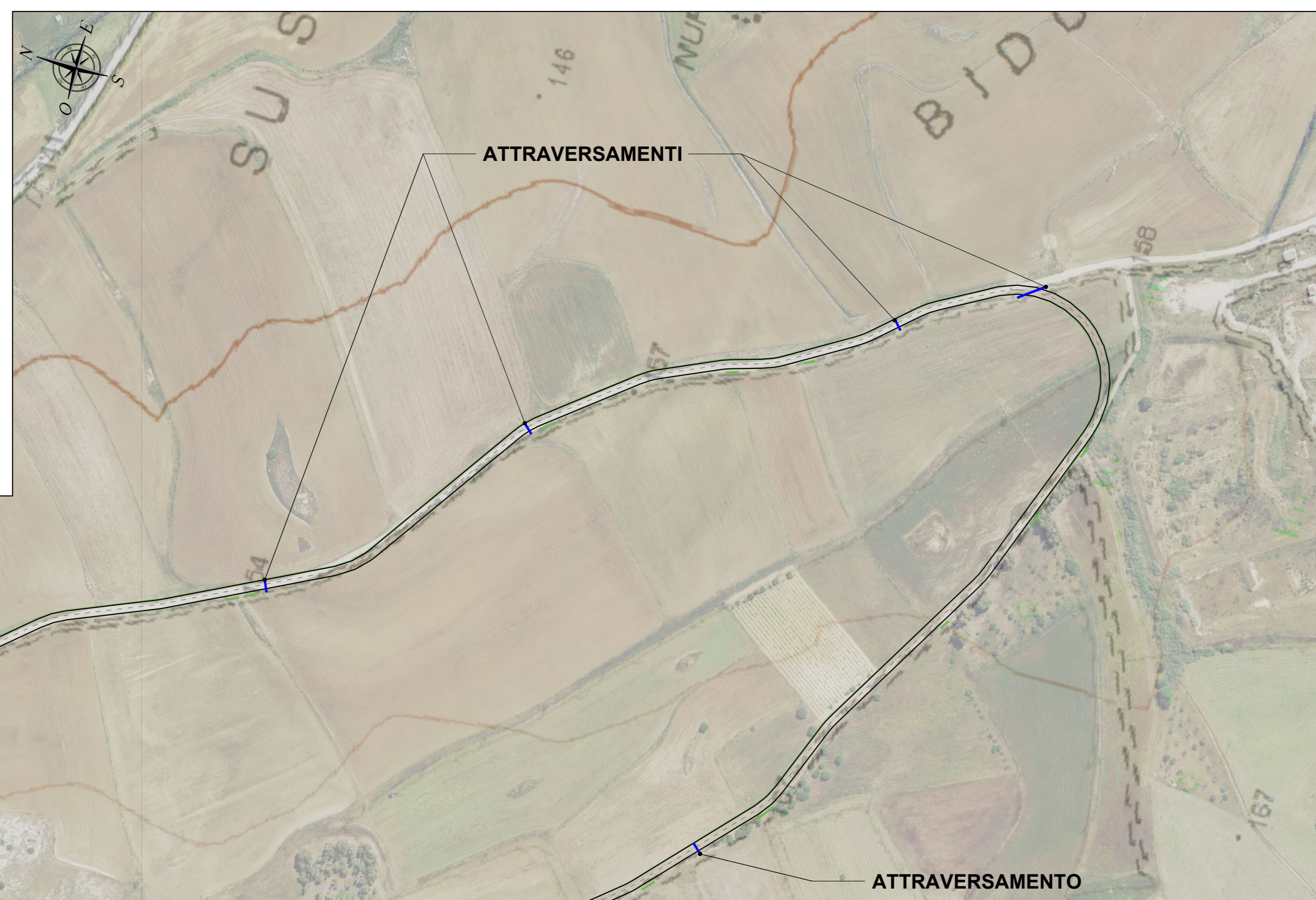
PLANIMETRIA QUADRO 4 - SCALA 1:2.000