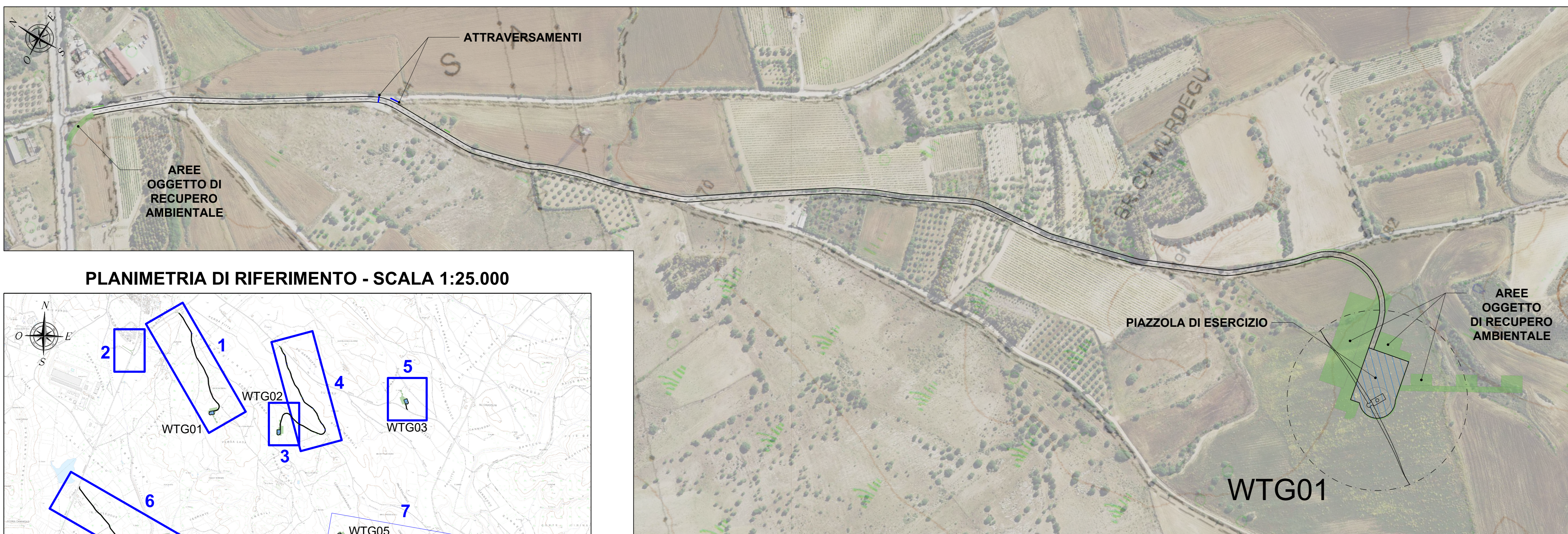
PLANIMETRIA QUADRO 1 - SCALA 1:2.000