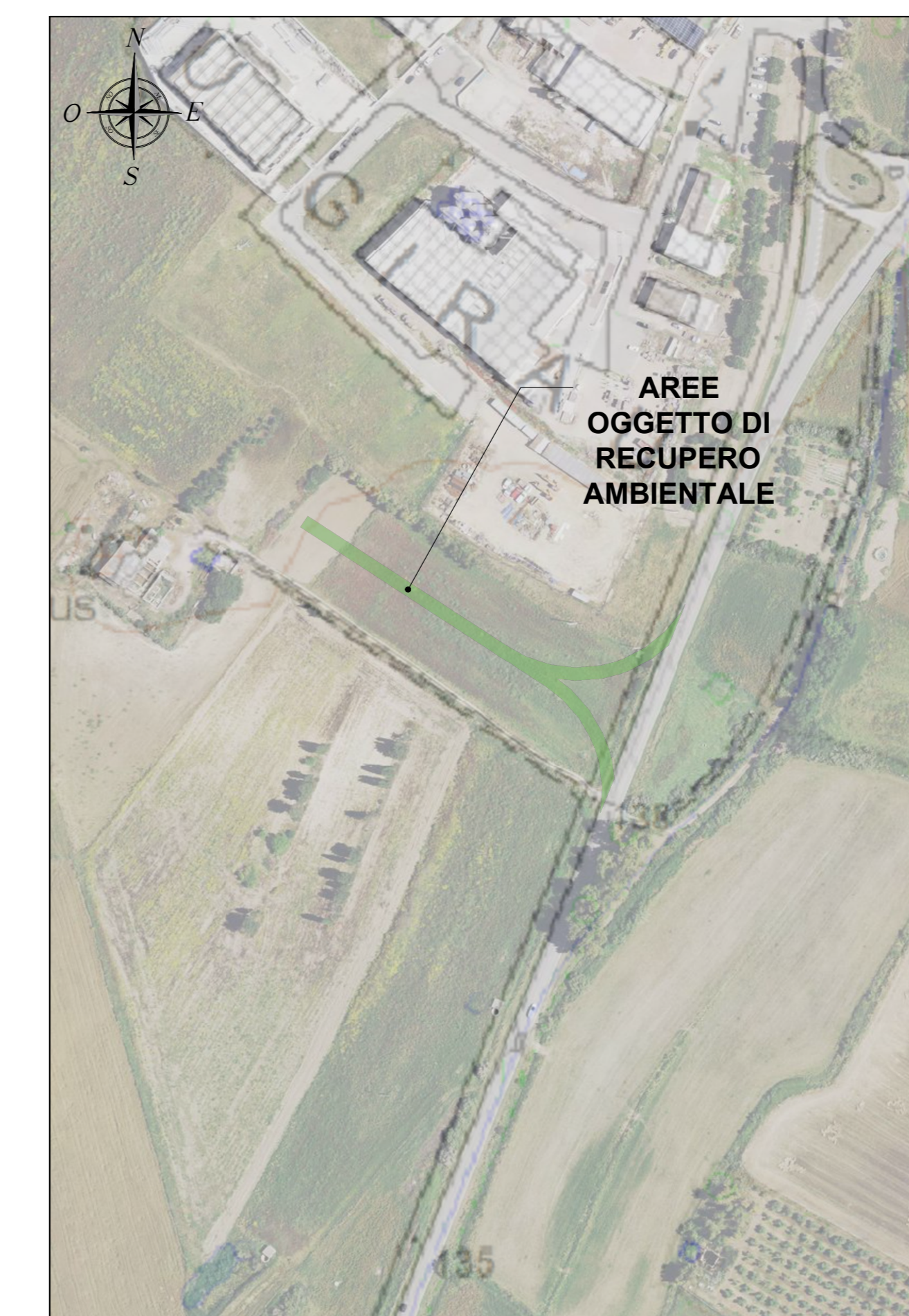
PLANIMETRIA QUADRO 2 - SCALA 1:2.000