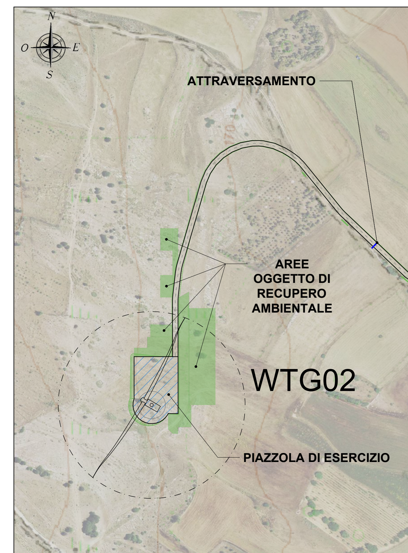
PLANIMETRIA QUADRO 3 - SCALA 1:2.000