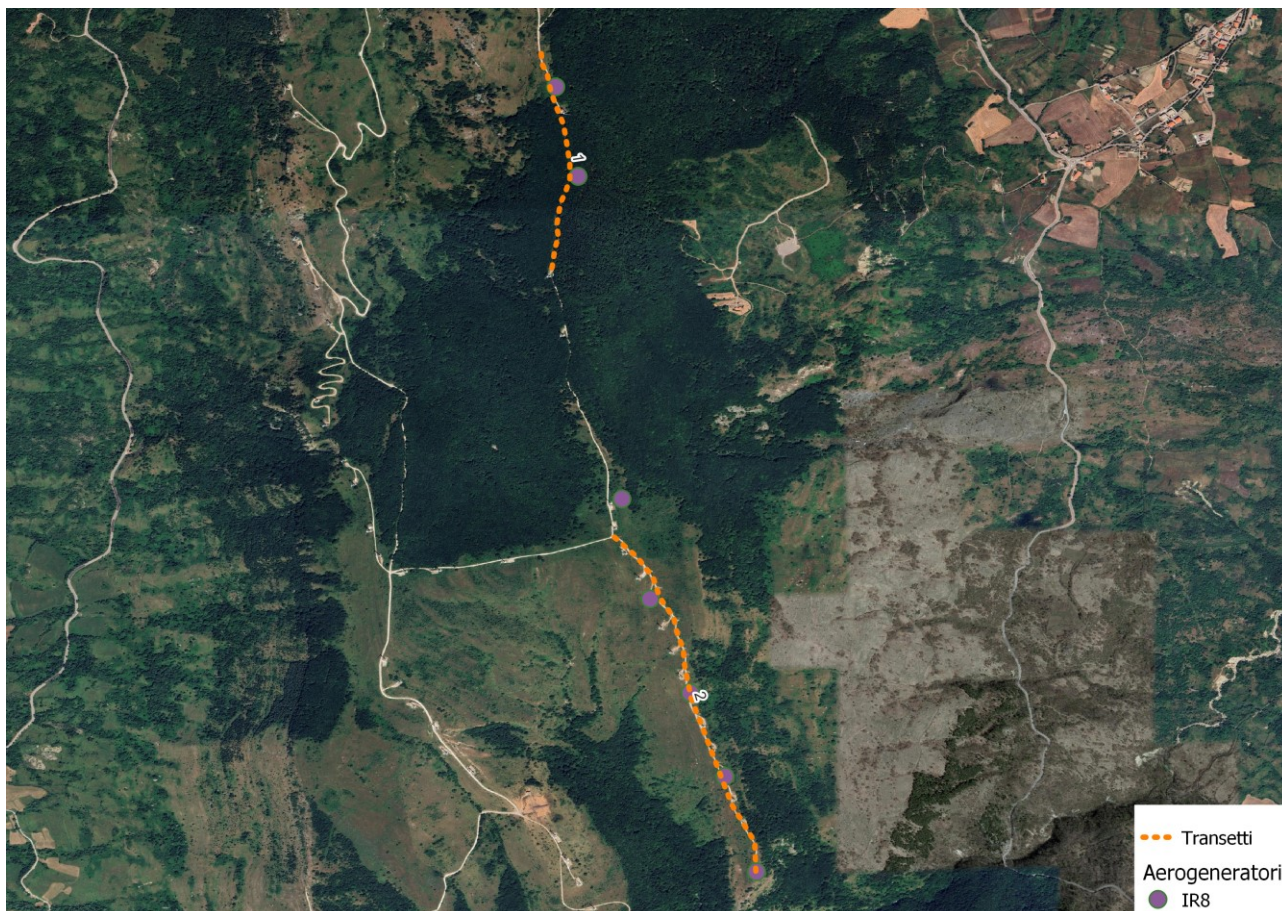
Figura 1 – Transetti per nidificanti e svernanti