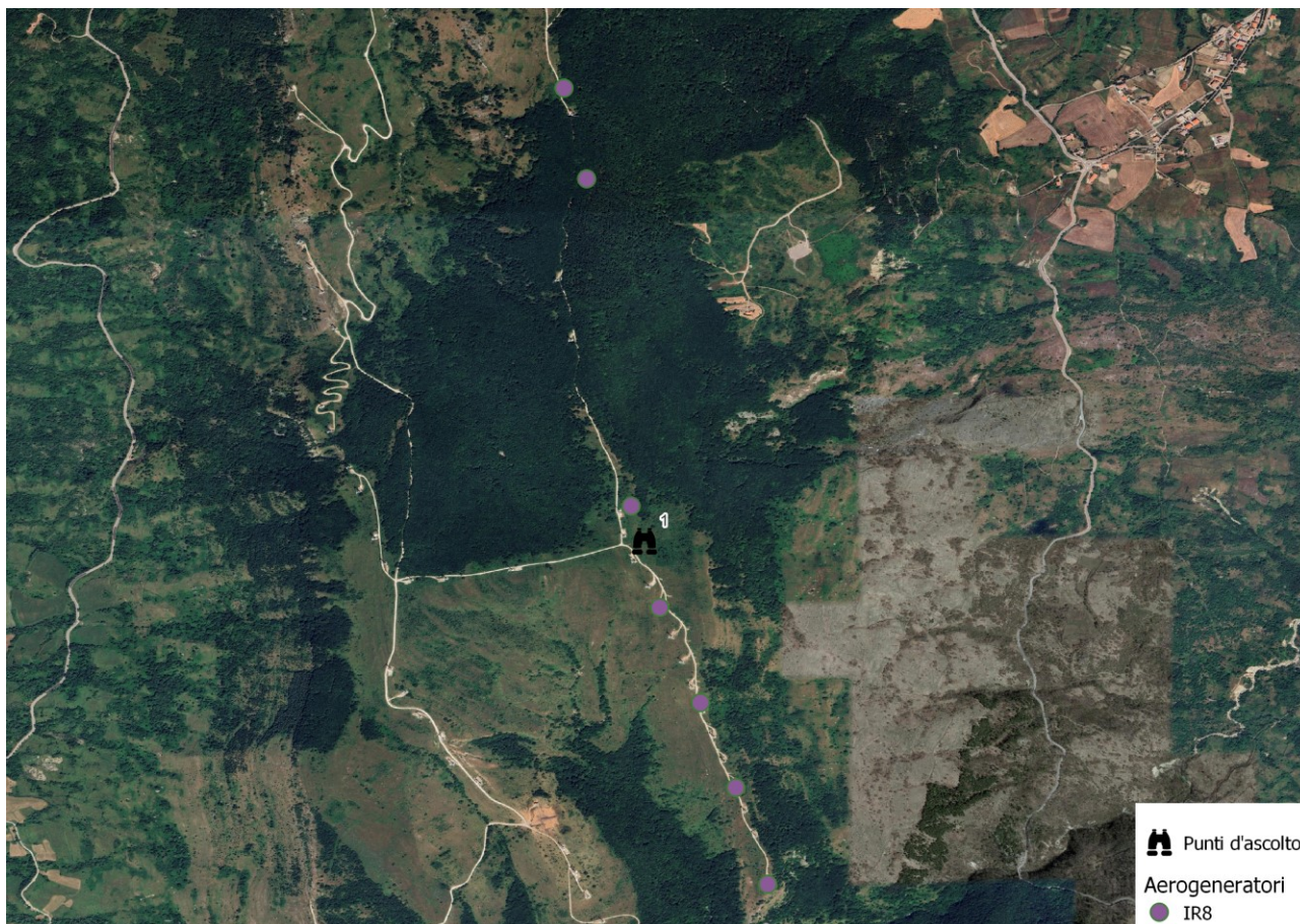
Figura 3 – Punti d’ascolto per uccelli migratori