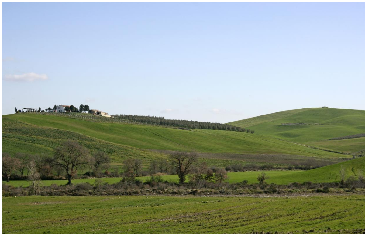
Figura 1 - Veduta aziendale

Azienda Agricola Parmoleto di Sodi Duilio Podere Parmoletone 44 58033 Montenero d'Orcia – Castel del Piano (GR) C.F. SDO DLU 49 E11 C085 B - P . I . 00273130534