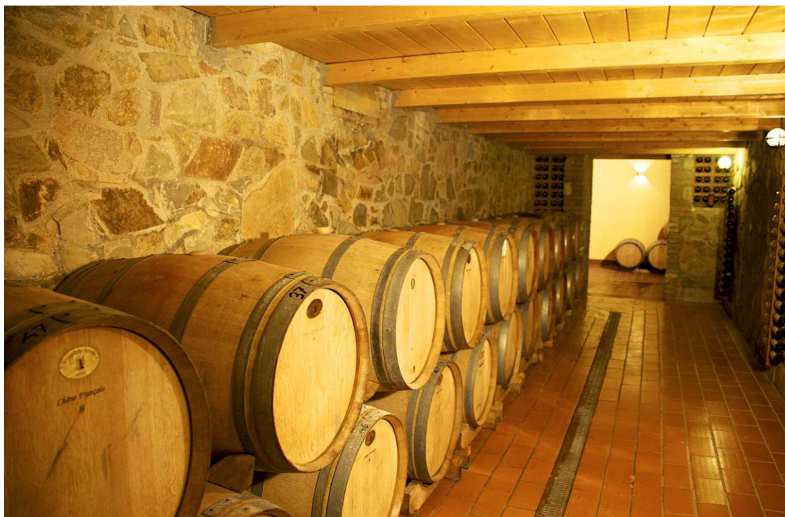
Figura 5 - Cantina ristrutturata nel 2012

Azienda Agricola Parmoleto di Sodi Duilio Podere Parmoletone 44 58033 Montenero d'Orcia – Castel del Piano (GR) C.F. SDO DLU 49 E11 C085 B - P . I . 00273130534