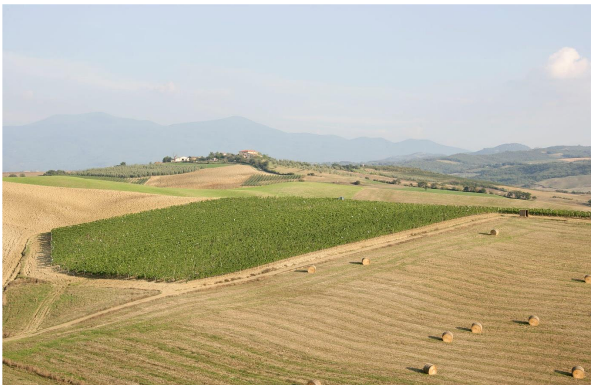
Figura 2 - Impianto di vigneto del 2000