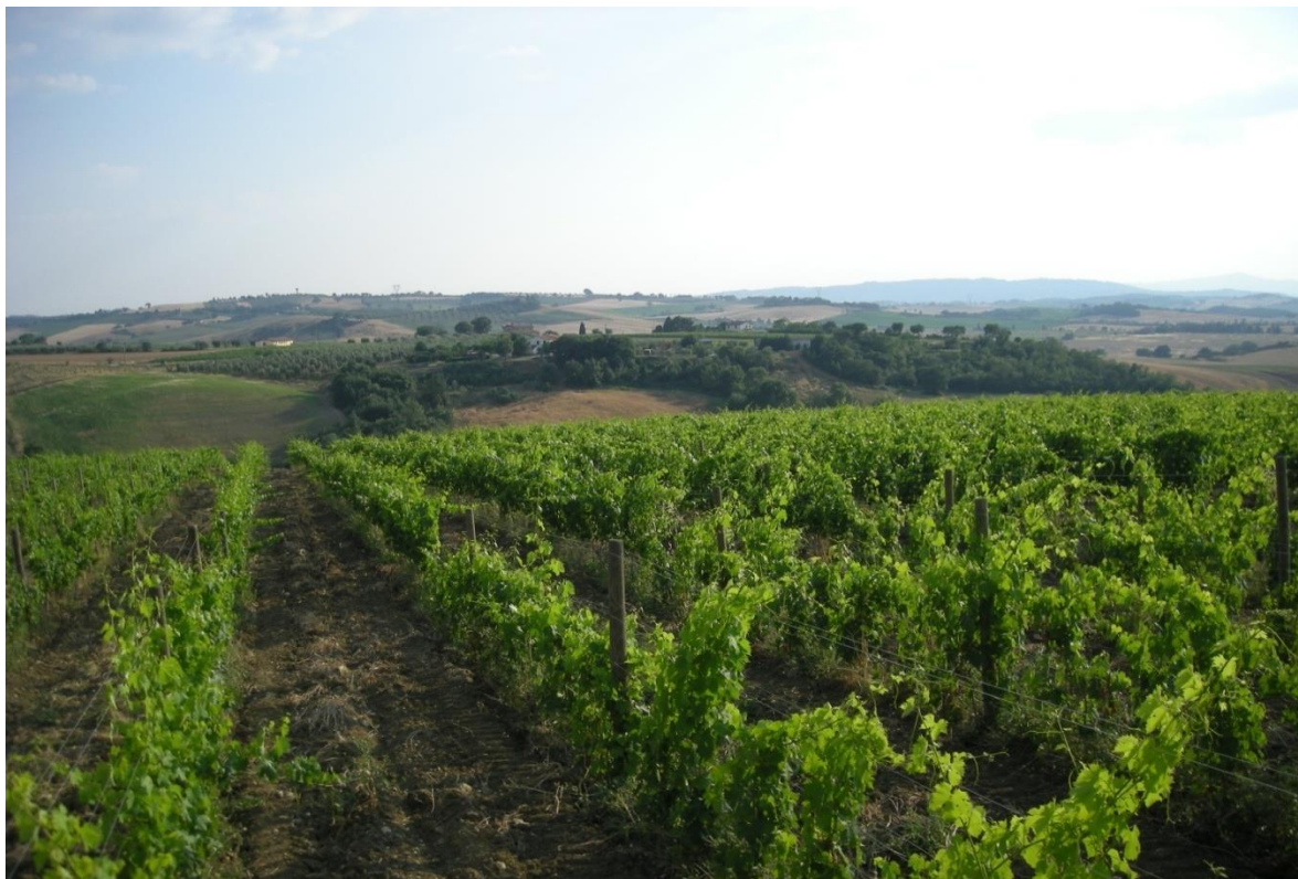
Figura 3 - Impianto di vigneto del 2008

Azienda Agricola Parmoleto di Sodi Duilio Podere Parmoletone 44 58033 Montenero d'Orcia – Castel del Piano (GR) C.F. SDO DLU 49 E11 C085 B - P .I . 00273130534