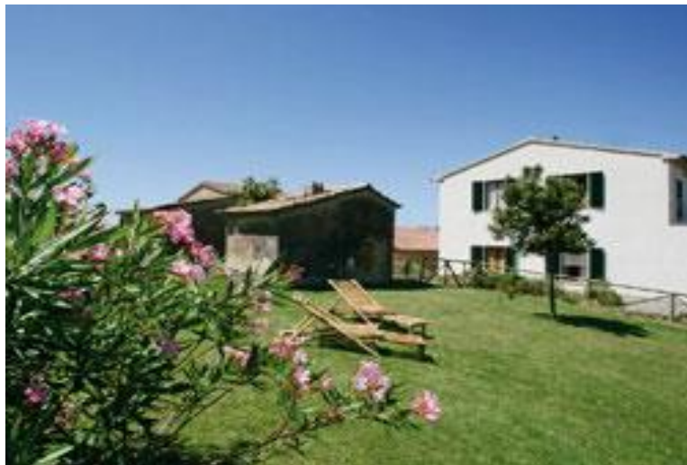
Figura 7 - Veduta della struttura Agrituristica

Azienda Agricola Parmoleto di Sodi Duilio Podere Parmoletone 44 58033 Montenero d'Orcia – Castel del Piano (GR) C.F. SDO DLU 49 E11 C085 B - P .I . 00273130534