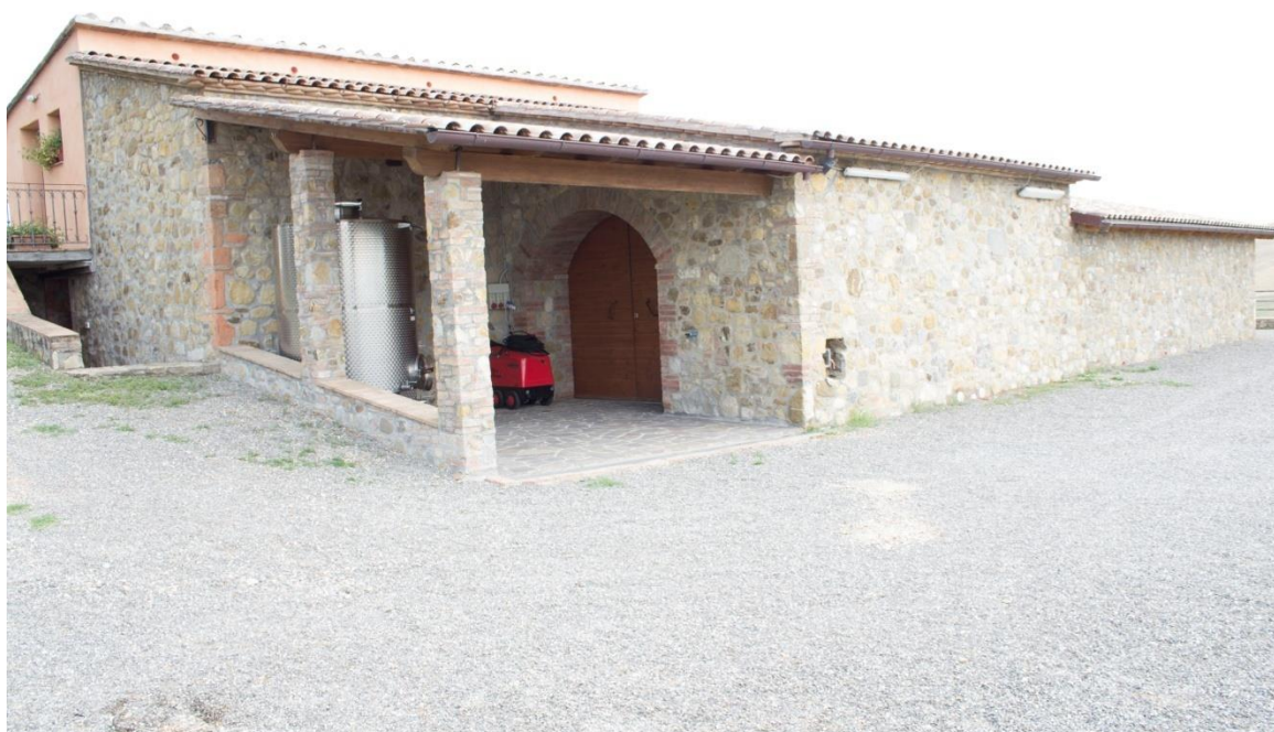
Figura 4 - Veduta esterna cantina