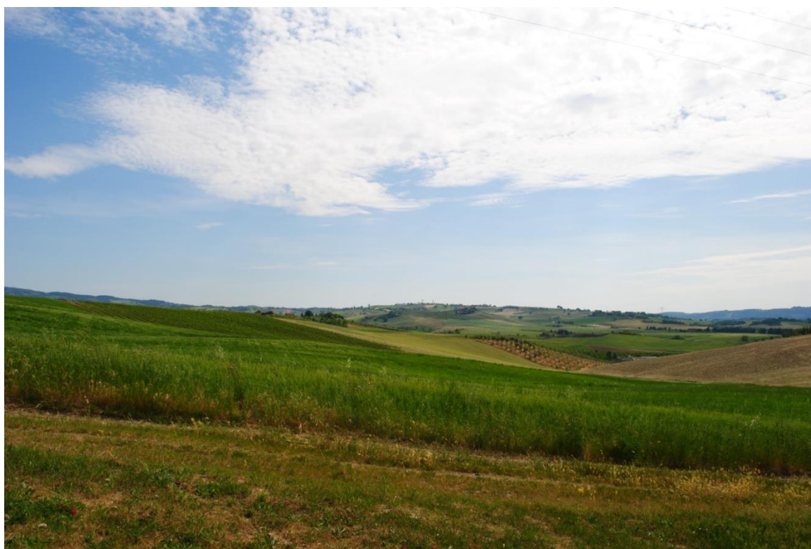
Figura 6 - Esterno dell'Agriturismo