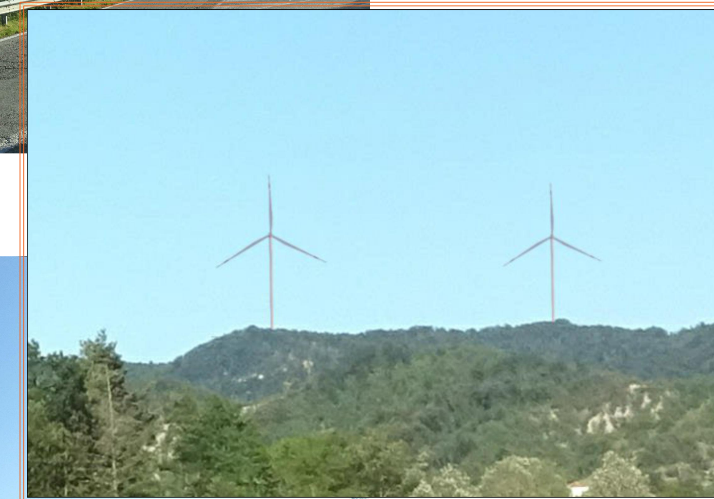
INGRANDIMENTO 1 FOTOMONTAGGIO 03 All'interno della fotografia è possibile vedere un fotomontaggio degli aerogeneratori collocati presso il Monte Cerchio. Leggendo l'immagine da destra verso sinistra è possibile notare gli aerogeneratori 5 e 6.