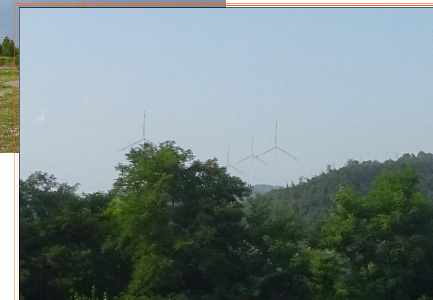
INGRANDIMENTO FOTOMONTAGGIO 06-1 All'interno della fotografia è possibile vedere un fotomontaggio degli aerogeneratori collocati presso il Monte Cerchio. Leggendo l'immagine è possibile notare la presenza degli ultimi quattro aerogeneratori in progetto.