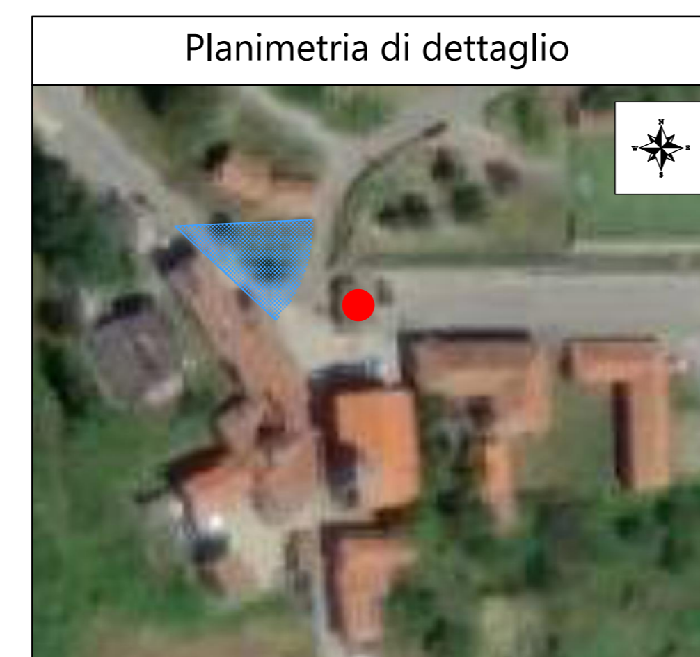
Vista generale - stato di fatto