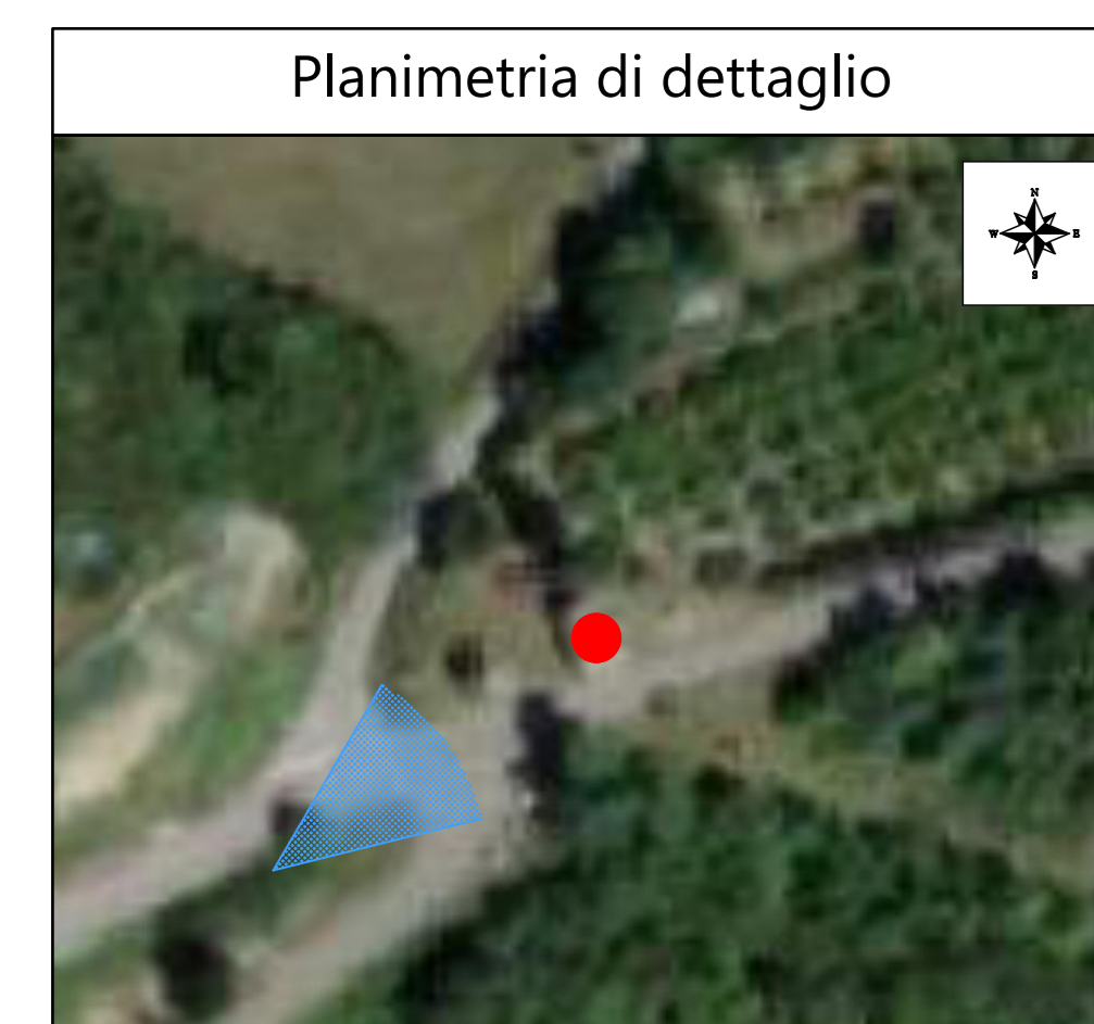
Vista generale - stato di fatto