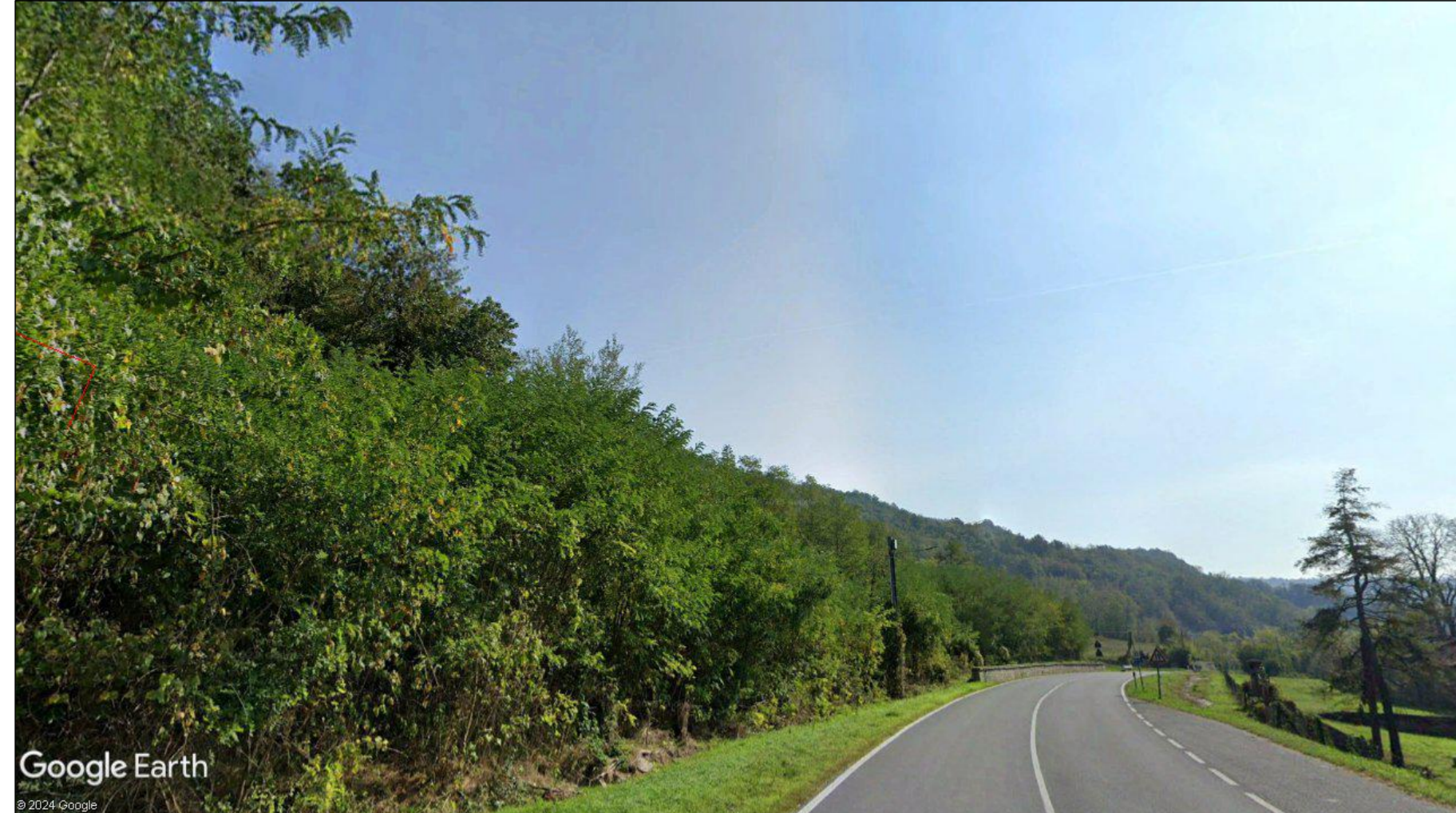
Fotografia 12 - fotosimulazione