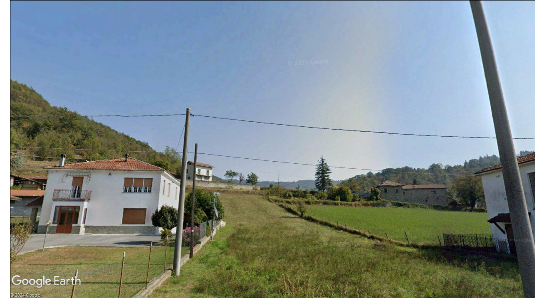
Fotografia 13 - fotosimulazione