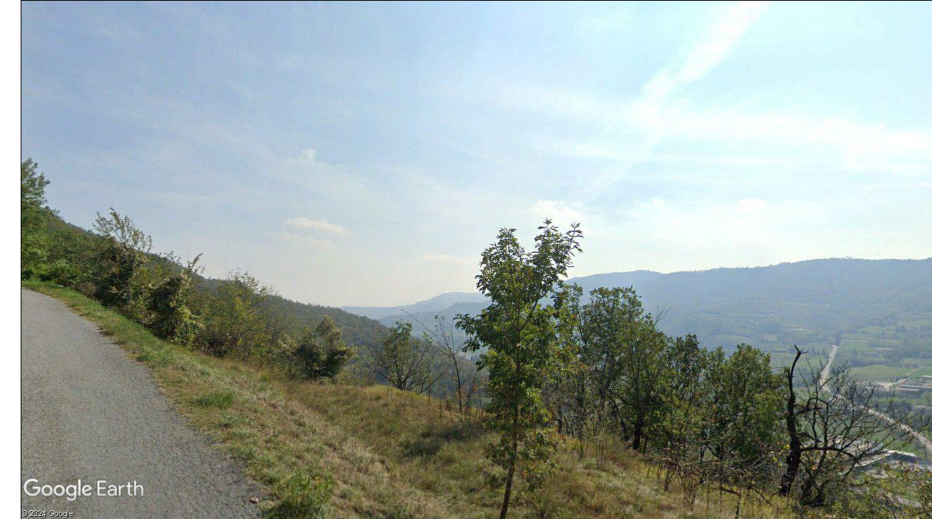
Fotografia 10 - fotosimulazione