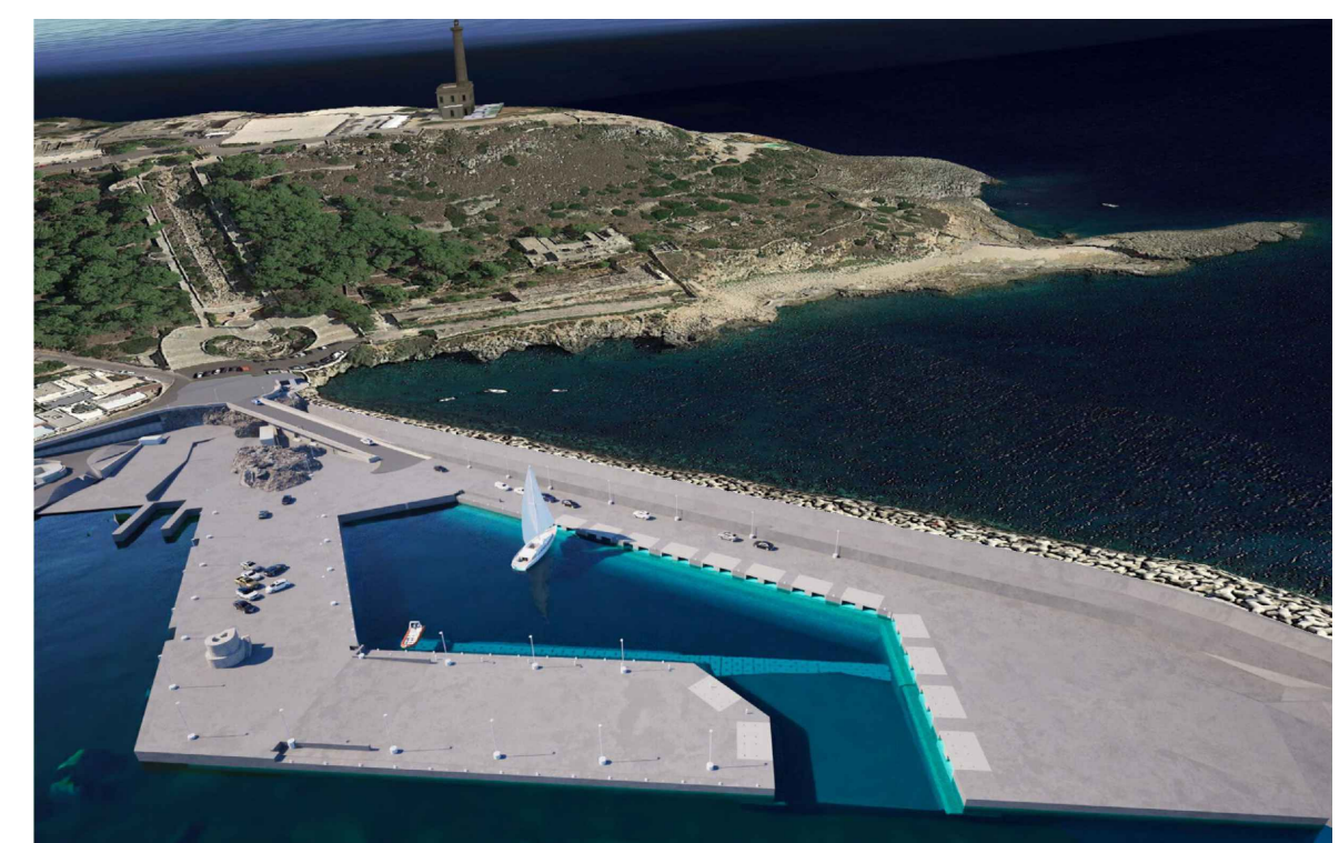
- PROGETTO DEFINITIVO -

LAVORI DI MIGLIORAMENTO DELLA VIABILITA' E RIQUALIFICAZIONE DELL'AREA PORTUALE SULLA FASCIA DI S. M. DI LEUCA