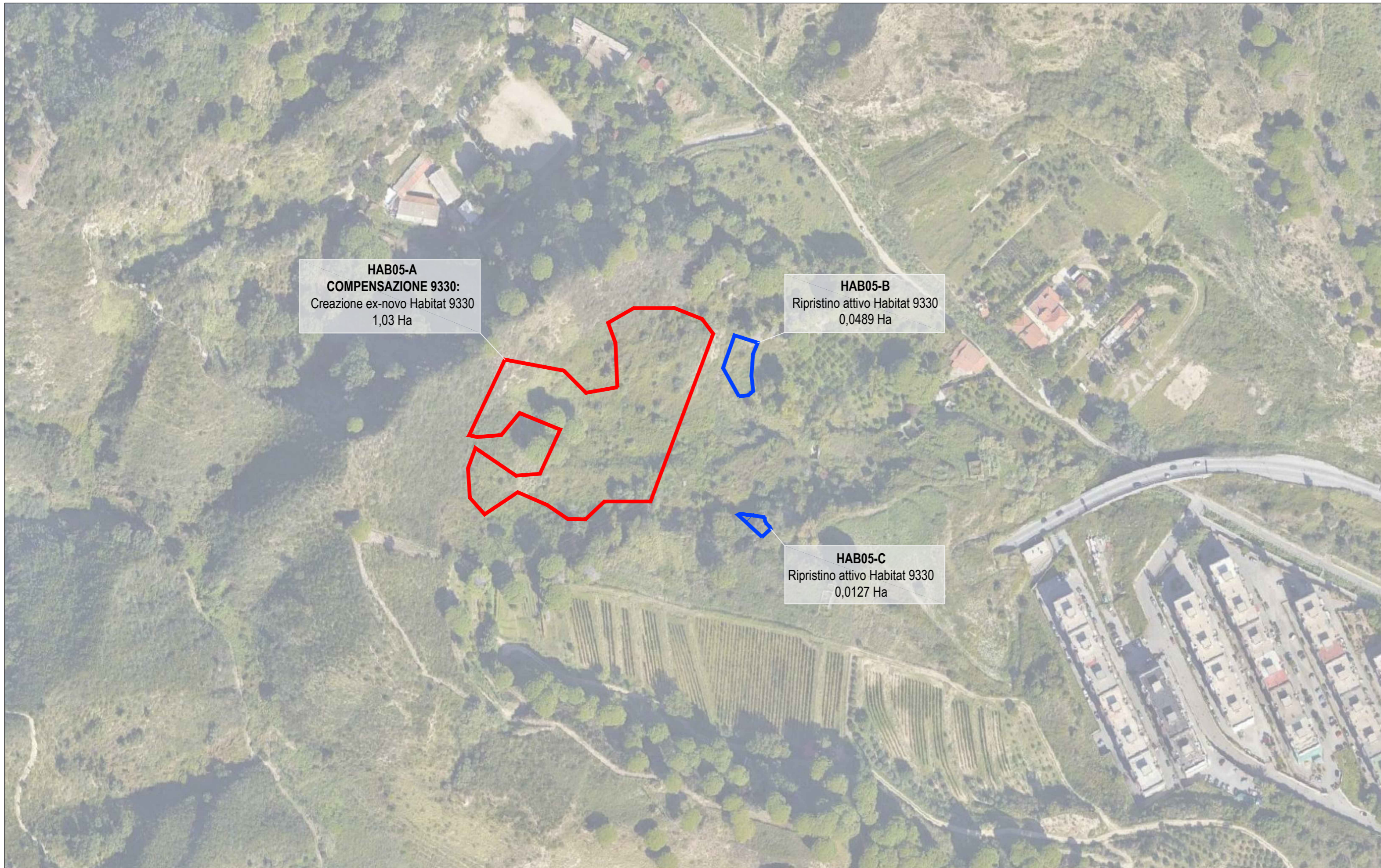
HAB05 Interventi di ripristino e compensazione ambientale per perdita di Habitat 9330 in Regione Sicilia - Planimetria di progetto