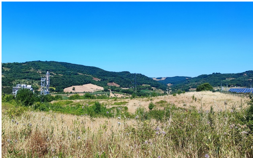
Vista della Centrale Enel Green Power "Cornia 2"