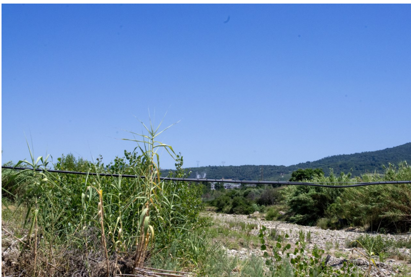
Vista dell'area di sito da sud-ovest sul ponte del fiume Cornia