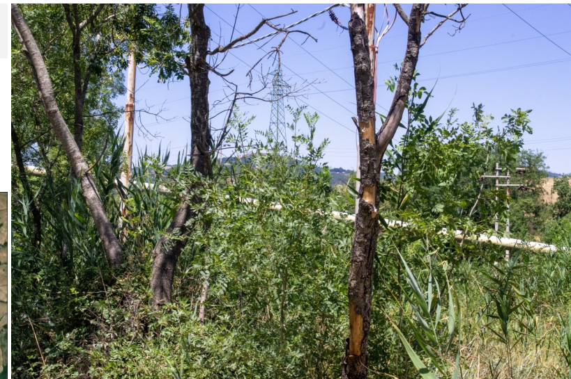
Vista di un'interferenza lungo la SP62 verso l'area di sito