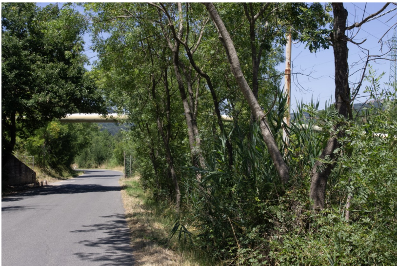
Vista di un'interferenza lungo la SP62