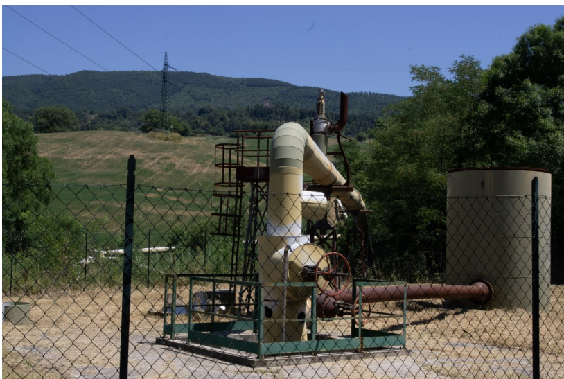
Vista della Centrale Enel Nuovo Lago ubicata a sud dell'area di sito