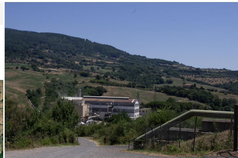
Vista della Centrale Enel Nuovo Lago ubicata a sud dell'area di sito