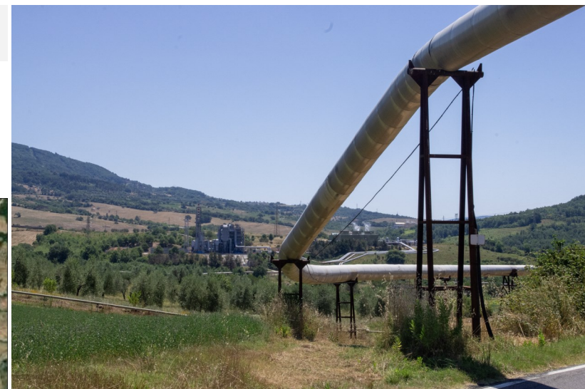
Vista da ovest dell'area di sito dalla SP49