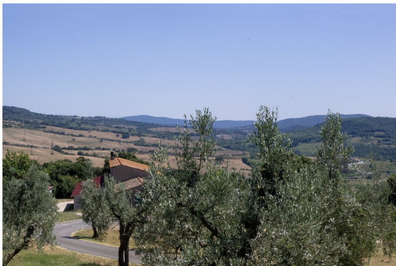
Vista da nord-ovest dell'area di sito dalla SP49