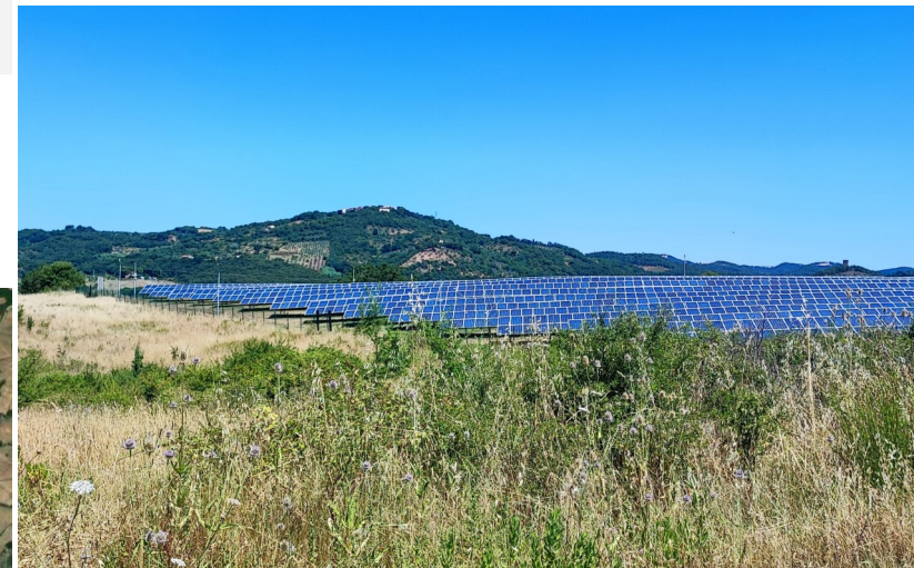
Vista del campo fotovoltaico esistente interno all'area di sito