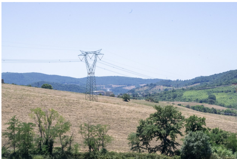
Vista dell'area di sito e sullo sfondo la Centrale Enel Nuovo Lago, ubicata a sud dell'area di sito