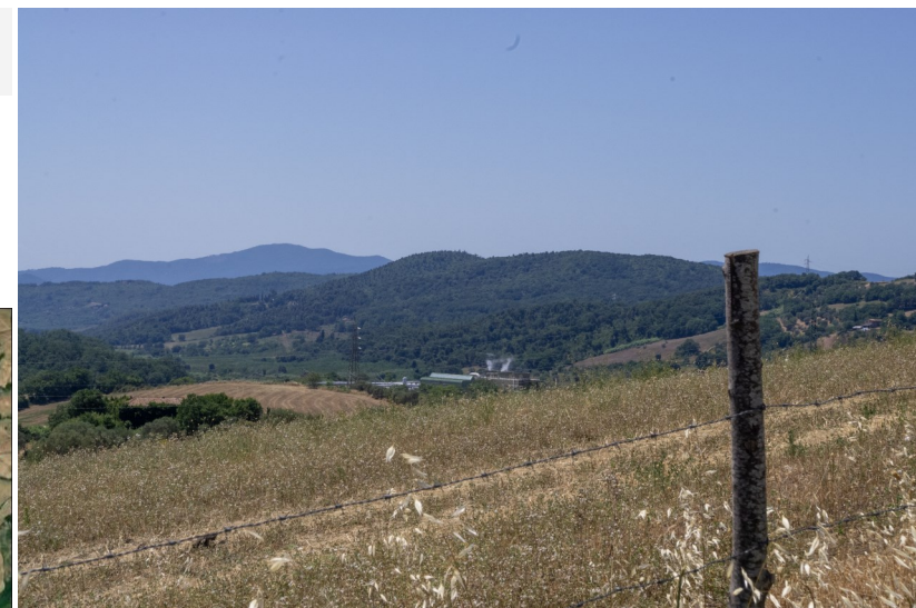
Vista dell'area di sito e sullo sfondo la Centrale Enel Green Power "Cornia 2", ubicata a ovest dell'area di sito